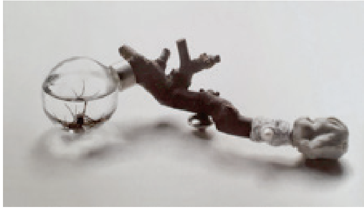
Görsel 5. Sebastian Buescher, “Pregnant Tree Boy” isimli broş; Ahşap, gümüş, porselen, inci, cam, karadul örümceği; 2005

Sanatta olduğu gibi, geçtiğimiz yüzyılda takı için de; dünya çapında uzman altyapısı, kendi eğitim programları ve galerileri, müze koleksiyonları ve koleksiyoncuları, kitap ve katalogları ile oluşturulmuş; yeni anlam, yeni bir form dili ve yeni bir estetik geliştirmek için her çeşit malzeme ve teknik kullanılmıştır. Bireysel stüdyo üretim ölçülerinde, en son teknolojinin erişilebilirliğinin ve kullanımının neredeyse imkansız olması nedeniyle, üretimde gelişmiş teknolojiden nadiren faydalanılmaktadır (Astfalck (vd.), 2005, 13).