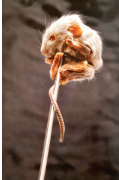
Görsel 8. Julia Deville, "Mouse-Pin" isimli broş; fare, yakut, gümüş, 18 ayar altın, 2004

Avustralyalı avangard takı sanatçısı Julia Deville, çalışmalarında malzeme olarak doldurulmuş hayvanları kullanmakta ve bunları siyah inci, fildişi ve mercan gibi değerli malzemelerle kombine ederek; süslenme ve ölüm arasında geleneksel bir ilişki kurmaktadır (Cheung (vd.), 2006, 164). Eğitimli bir tahnitçi olan Deville, organik malzemeyi gümüş ya da altının içine gömerek takılabilen hassas parçalara dönüştürmektedir.