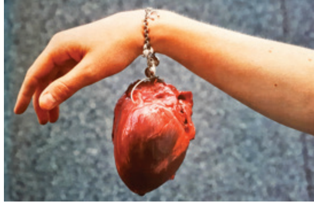
Görsel 4. Nanna Melland, “Heart Charm” isimli bilezik; gümüş tılsım (charm) bilezik, domuz kalbi, 2000

Endüstriyel olarak üretilen veya doğada bulunan her malzemenin kendine ait karakteristik özellikleri vardır. Sanatçı, üretiminde tek malzeme kullanarak veya farklı karakteristik özellikler taşıyan malzemeleri bir araya getirerek, bir kurgu veya bir anlam bütünlüğü oluşturmaktadır. Bu da, sanatçının eserinde kullanacağı malzemeyi anlatım aracı olarak seçtiğini açıkça göstermektedir. Takı sanatı için de aynı süreç geçerlidir. Sanatsal takı; “giyilebilir/ takılabilir” bir anlatım aracı olduğundan, onu üreten sanatçı, özgün olan ve yaratmak istediği anlam bütünlüğüne uygun malzemeyi kullanarak, kendi kişisel bakış açısını yansıtan kurguyu oluşturmaktadır. Amacı; üretimini daha çarpıcı, benzersiz ve özgün hale getirmektir.