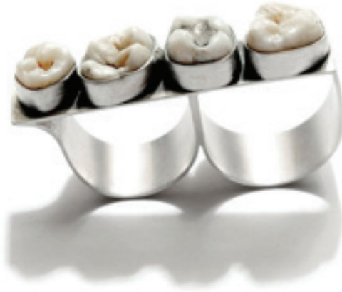
Görsel 11. Polly van der Glas, yüzük; insan dişi ve gümüş

Takı üretiminde aşırılık derecesinde sıradışı malzemeler kullanan bir diğer Avustralyalı takı sanatçısı ise, Polly van der Glas'tır. Sanatçı, takı ve küçük heykellerinde vücut ve ona yüklenen anlamları içeren temalar kullanmaktadır. 2005 yılından bu yana, van der Glas, bir zamanlar insan vücudunun parçaları olan ama kesilmiş ya da çekilmiş saç, diş ve tırnaklar ile çalışmaktadır.