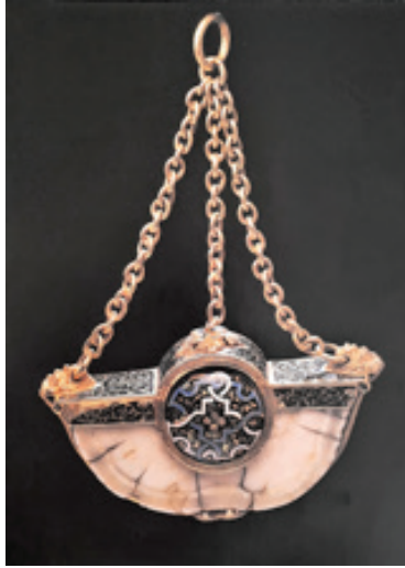
Görsel 1. İngiltere'de yapılmış deniz gergedanı boynuzu ve minelenmiş altından pandantif, yaklaşık 1550 yılı

İ.Ö. 30.000'e kadar Avrupa'nın farklı bölgelerindeki avcılar, hayvanların kemik ve dişlerinden yapılan kolye uçları takmışlardır. Avcıların, vücutlarını dekore etmenin yanısıra bu takıları, başarılı bir av için tılsım olarak kullanmış olmaları da tahminler arasındadır (Phillips, 1996, 7). Malzemelerin delinebilmesini, yontulabilmesini sağlayan teknik imkanların gelişmesiyle, takının varyasyonları da değişmeye başlamıştır.