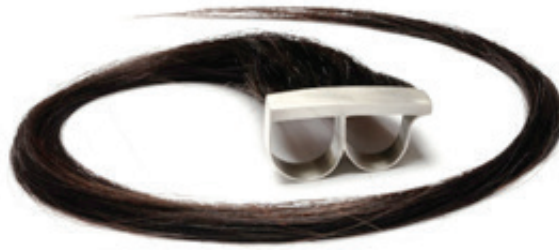
Görsel 12. Polly van der Glas, yüzük; insan saçı ve gümüş

Takı üretiminde aşırılık derecesinde sıradışı malzemeler kullanan bir diğer Avustralyalı takı sanatçısı ise, Polly van der Glas'tır. Sanatçı, takı ve küçük heykellerinde vücut ve ona yüklenen anlamları içeren temalar kullanmaktadır. 2005 yılından bu yana, van der Glas, bir zamanlar insan vücudunun parçaları olan ama kesilmiş ya da çekilmiş saç, diş ve tırnaklar ile çalışmaktadır.