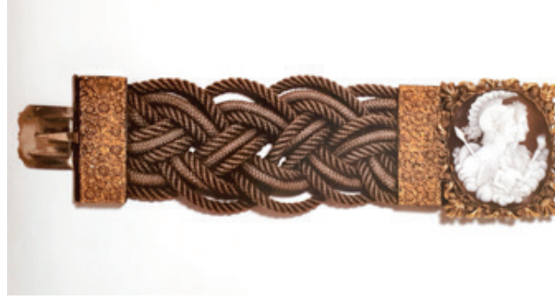
Görsel 2. İnsan saçından örülerek yapılmış bilezik, altın kilit kısmına kabuk cameo yerleştirilmiş; t ahminen İsviçre'den, yaklaşık 1825 yılı (Victoria and Albert Müzesi, Londra)