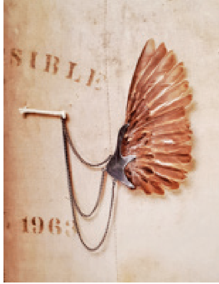
Görsel 9. Julia Deville, "Sparrow Wing Brooch" isimli broş; 925 ayar gümüş, serçe kanadı