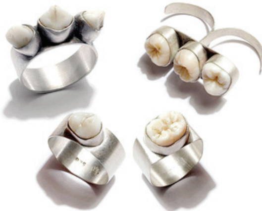
Görsel 13. Polly van der Glas, yüzük koleksiyonu; insan dişi ve gümüş