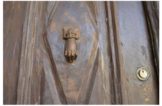
Resim 2: Giriş Kapısı Üzerindeki El Motifli Kapı Tokmakları