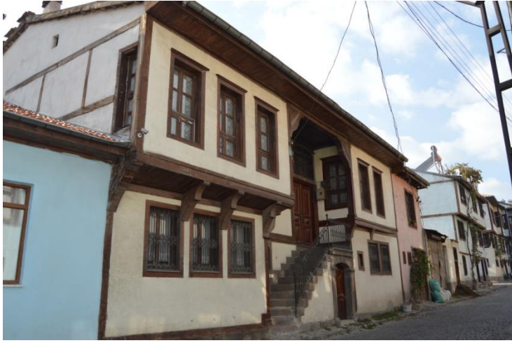
Resim 16: 493 Ada'da Yer Alan Evden Genel Görünüm