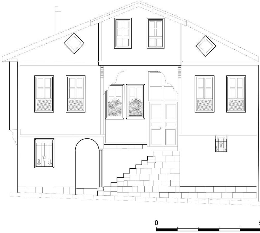
Çizim 5: 489 Ada'da Yer Alan Evin Giriş Cephe Çizimi (Afyon Belediyesinden)