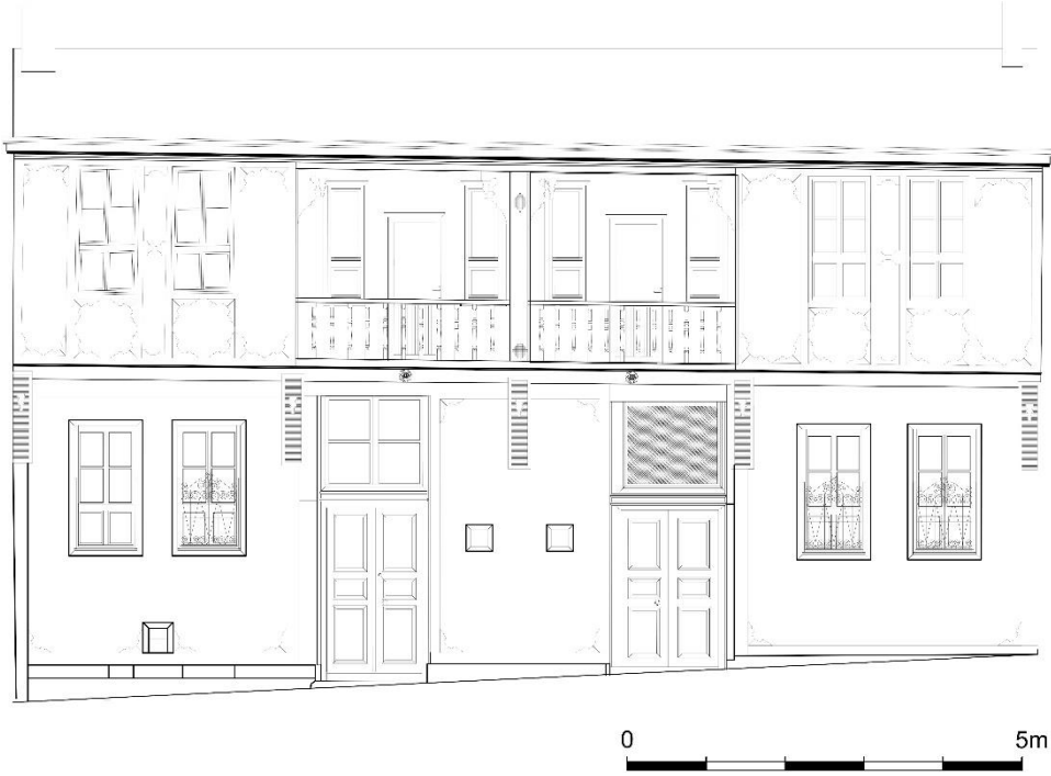
Çizim 13: 200 Ada'da Yer alan Evin Giriş Cephe Çizimi (Afyon Belediyesinden)