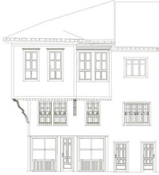
Çizim 7: 498 Ada'da Yer Alan Evin Giriş ve Yan Cephe Çizimleri (Afyon Belediyesinden)