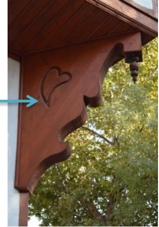
Resim 11: Evin Çıkmasını Taşıyan Elibelindelerden Genel Görünüm