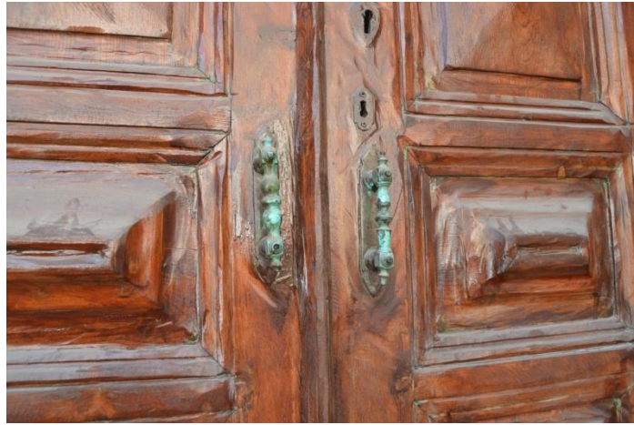
Resim 18: Evin Giriş Kapısı Üzerindeki Kapı Kollarından Genel Görünüm