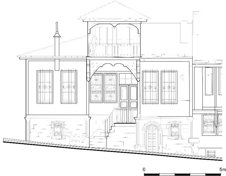
Çizim 2: 211 Ada'da Yer Alan Evin Giriş Cephe Çizimi (Afyon Belediyesinden)