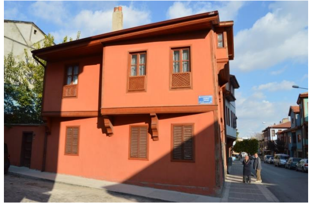
Resim 9: 489 Ada'daki Evin Giriş Cephesinden Genel Görünüm