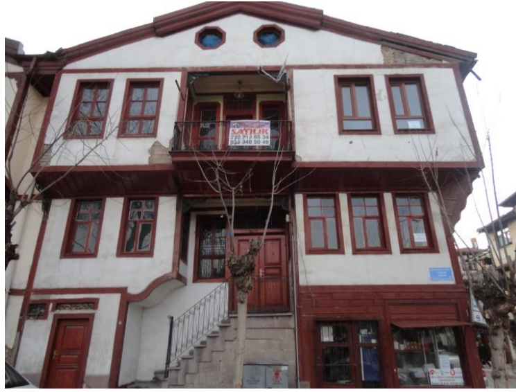
Resim 8: 497 Ada'daki Evden Genel Görünüm