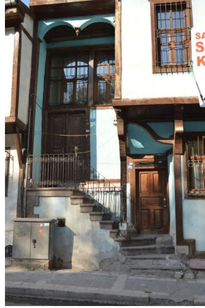
Resim 14: 495 Ada'da Yer Alan Evden Genel Görünüm