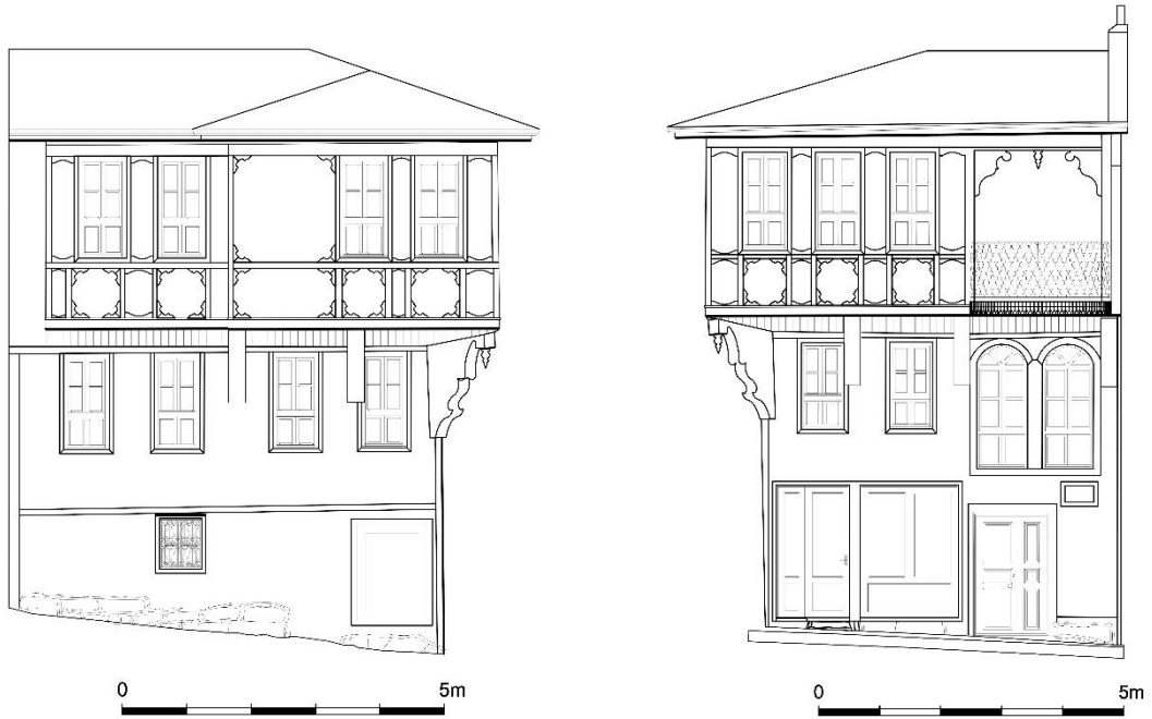
Çizim 6: 490 Ada'da Yer Alan Evin Giriş ve Yan Cephe Çizimi (Afyon Belediyesinden)