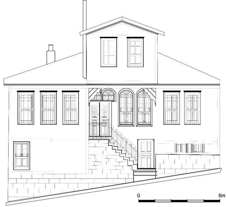
Çizim 1: 495 Ada'da Yer Alan Evin Giriş Cephesi (Afyon Belediyesinden)