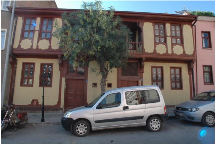
Resim 20: 200 Ada'da Yer Alan Evden Genel Görünüm