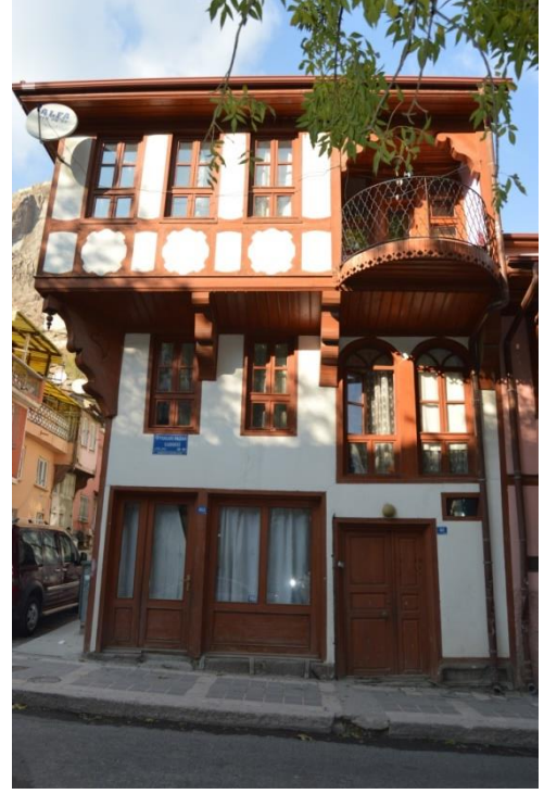
Resim 10: 490 Ada'da Yer Alan Evin Giriş Cephesinden Genel Görünüm