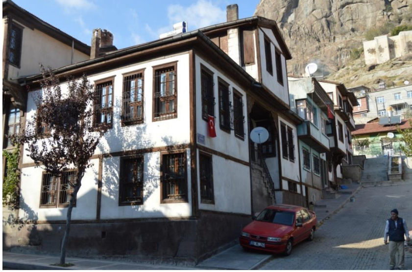
Resim 1: 495 Ada'da Yer Alan Evden Genel Görünüm