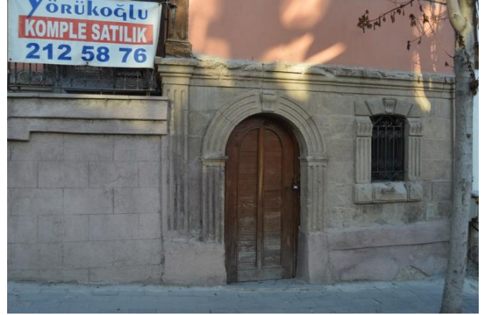
Resim 3: 211Nolu Parseldeki Evden Genel Görünüm