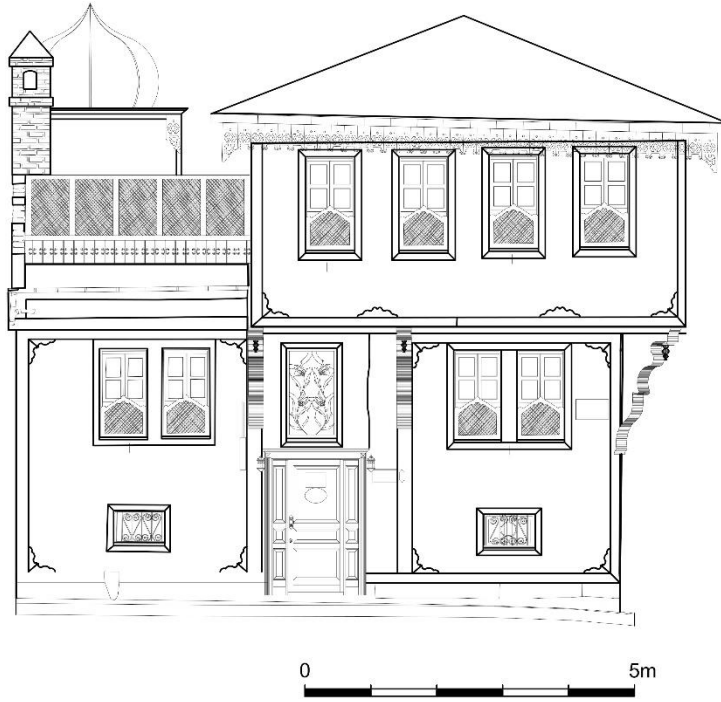
Çizim 8: 497 Ada'da Yer Alan Evin Giriş Cephe Çizimi (Afyon Belediyesinden)