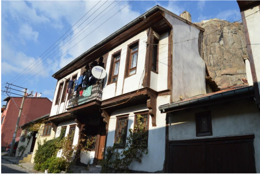
Resim 15: 515 Ada'da Yer Alan Evden Genel Görünüm