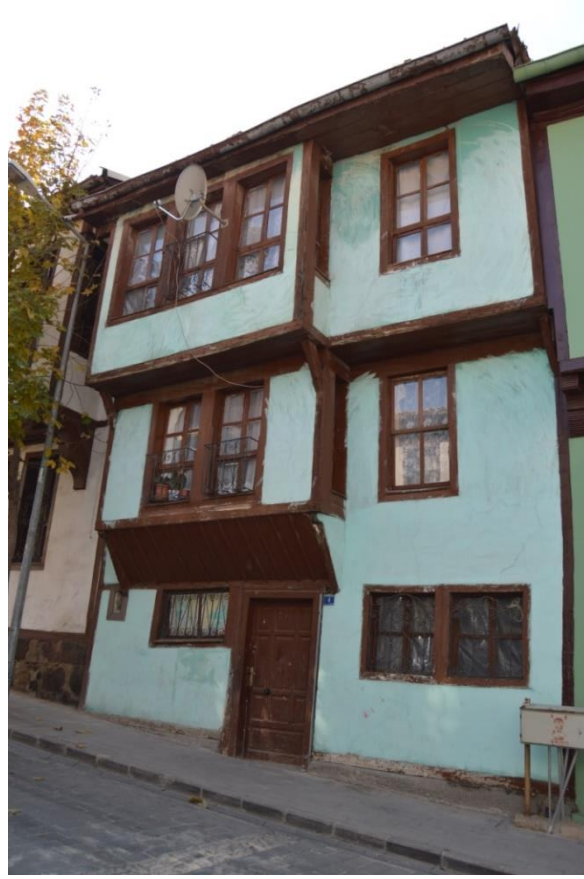
Resim 19: 498 Ada'da Yer Alan Evden Genel Görünüm