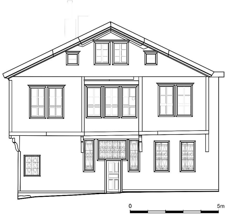
Çizim 3: 503 Ada'da Yer Alan Evin Giriş Cephesi (Afyon Belediyesinden)