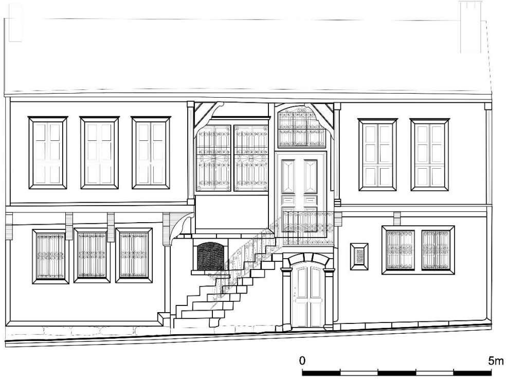
Çizim 11: 493 Ada'da Yer Alan Evin Giriş Cephe Çizimi (Afyon Belediyesinden)