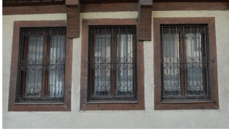
Resim 17: Evin Zemin Kat Pencerelelerinden Genel Görünüm