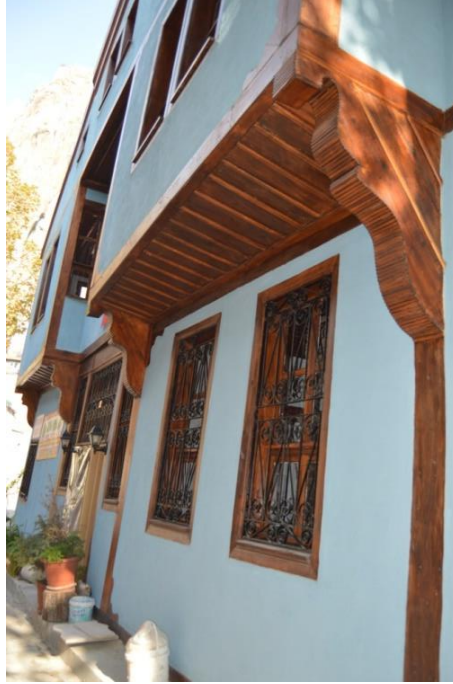
Resim 7: Evin Çıkmalarını Taşıyan Elibelindelerden Genel Görünüm