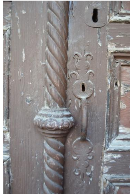
Resim 4: Giriş Kapısından Genel Görünüm Resim 5: Kapı Binisi ve Zemberek'ten Genel Görünüm