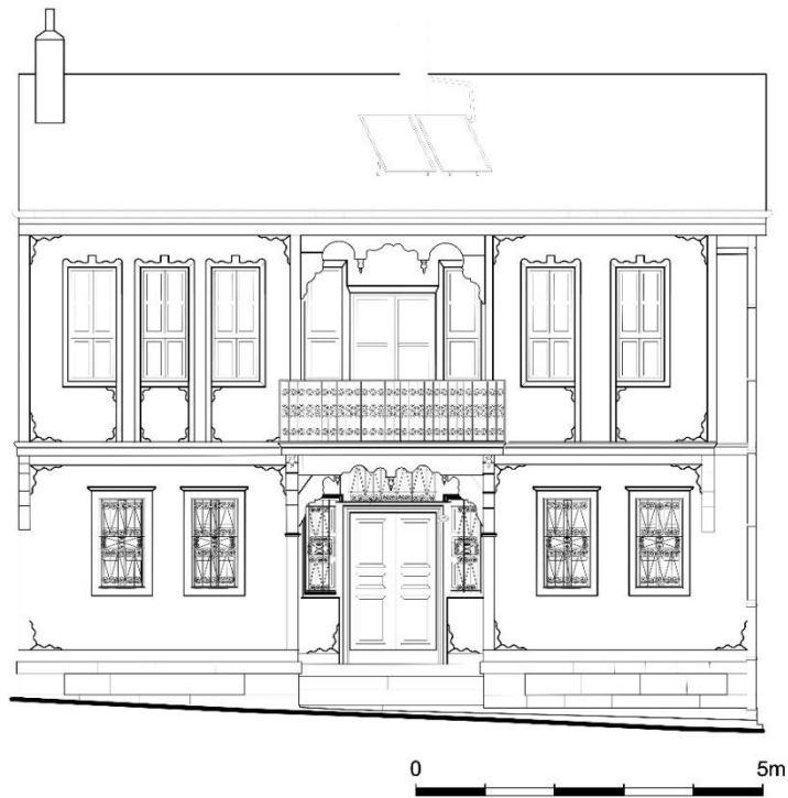
Çizim 10: 515 Ada'da Yer Alan Evin Giriş Cephe Çizimi (Afyon Belediyesinden)