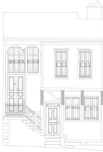
Çizim 9: 495 Ada'da Yer Alan Evin Giriş Cephe Çizimi (Afyon Belediyesinden)