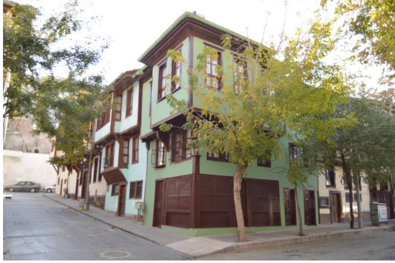
Resim 12: 498 Ada'da Yer Alan Evden Genel Görünüm