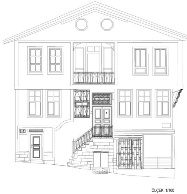
Çizim 4: 497 Ada'da Yer Alan Evin Giriş Cephe Çizimi (Afyon Belediyesinden)