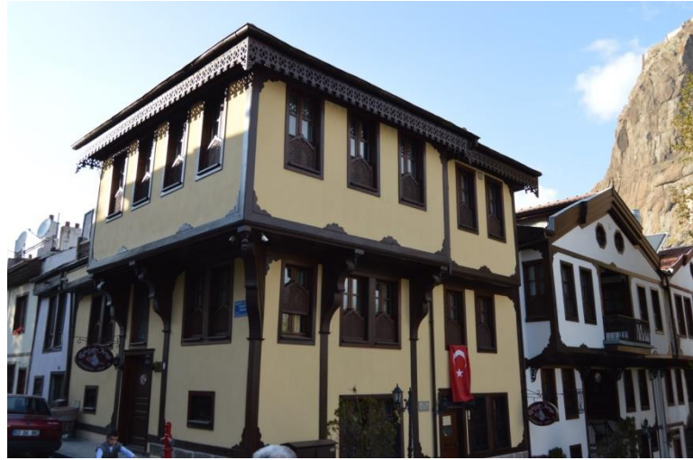
Resim 13: 497 Ada'da Yer Alan Evin Genel Görünümü