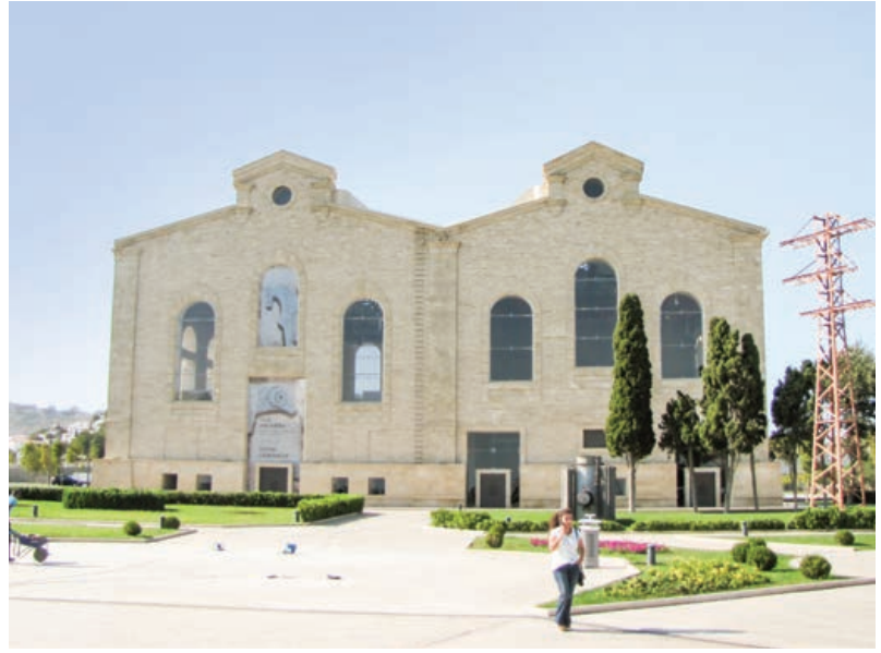
Şekil 8. “ Daş Salnamə ” Müzesi

İçerişehar’ın en yüksek noktasında ise Şirvanşahlar Sarayı yer alır. Şirvanşahlar Devleti’nin başkentinin 12. yüzyılda Bakü’ye taşınmasının ardından inşa edilen yapı kompleksi; saray, divanhane, türbe yapıları, mescitler, hamam ve “ ovdan ” dan (sarnıç) oluşmaktadır. Sarayı oluşturan yapılarda taş oyma sanatının ve kârgir yapım tekniklerinin etkileyici örnekleri görülmektedir (Şekil 7). Hâkim yapı malzemesi “ Bədamdam ” adı verilen yerel kireçtaşı olan saray, Şirvan-Abşeron mimarlık ekolünün en önemli örneklerindedir. On altıncı yüzyılın başındaki Safevi akınlarmında harap olan yapı, 1828 yılındaki Rus işgali sonrasında karargâh ola-