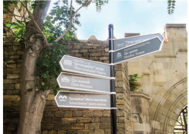
Şekil 26. İcerişeher'de yönlendirme tabelaları

■ Azərbaypa tarafından yapılan restorasyon çalışmalarında geleneksel mimarlık ve malzeme bilgisi kullanılmasına rağmen, bir koruma laboratuvarına duyulan ihtiyaç Azərbaypa personeli tarafından da dile getirilmiştir.