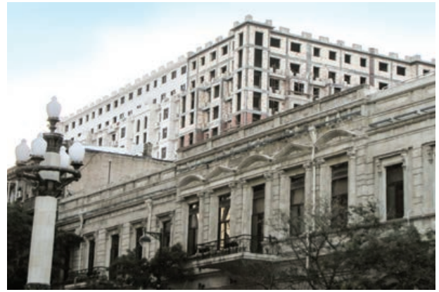
Şekil 25. Çağdas yapılarda doğal taş kullanımı