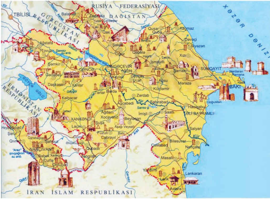
Şekil 1. Azerbaycan mimarlık mirasının bazı örneklerini gösteren harita (Azerbaycan Tarihi Atlası, Bakı Kartoğrafiya Fabriki, 2007, Bakü)