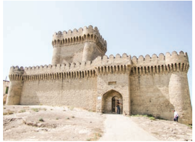
Şekil 12. Ramana Kalesi

yeraltından sızan gaz alev alması halinde uzun yıllar yanabilmekteydi. Hatta bu nedenle Azerbaycan, “Odlar Yurdu” olarak da anılmaktadır. Dolayısıyla, ateşe tapanların mabetlerini buraya inşa etmeleri bir tesadüf değildir. Bu inanca sahip olanların erken dönemlerden bu yana bölgede ibadet amacıyla toplandıkları düşünülse de, günümüzdeki Ateşgâh yapısının 16. yüzyıl sonu veya 17. yüzyıl başında inşa edildiği belirtilmektedir. Merkezi ibadet alanı ve hücrelerden oluşan yapı kompleksi surlarla çevrilidir. Geçmişte, yer altından sızan doğalgazın sürekli olarak yandığı alanda, günümüzde ancak kurulan tesisat sayesinde devamlı olarak ateş vardır. Ateşgâh, Azerbaycan’ın UNESCO Dünya Miras Geçici Listesi’ndeki anıtlarından biridir. 3