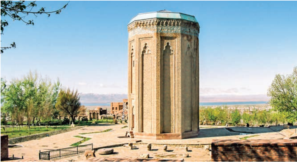
Şekil 2. Mümine Hatun (Möminə Xatun) Türbesi Nahçıvan, (Azerbaycan Devlet Başkanlığı Kütüphanesi)

hareketlilik artmış, farklı işlevlere sahip endüstri yapıları inşa edilmiştir. Sovyet döneminde de anıtsal yapıların inşasına devam edilmekle birlikte, özellikle Bakü’de toplu konut projelerine ağırlık verilmiştir. Azerbaycan’ın bağımsızlığını kazanmasının ardından Zaha Hadid gibi uluslararası üne sahip mimarlar ülkeye davet edilerek, özellikle başkent Bakü’deki mimarlık ortamının çağdaş yapılarla zenginleştirilmesi amaçlanmıştır.