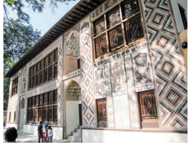
Şekil 14. Şeki Hanlar Sarayı güney cephesi

Azerbaycan Cumhuriyeti Medeniyet ve Turizm Nazırlığına bağlı olarak faaliyetlerini sürdürmektedir. Azerbaycan genelinde tescil edilmiş 6308 anıtın yaklaşık 1500'ü hakkında çalışma yürütmüş olan kurum, ülkede koruma alanında çalışan meslek insanlarının büyük çoğunluğunu bünyesinde toplamıştır. Enstitünün görevleri şunlardır: