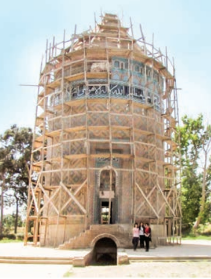
Şekil 17. Allah Allah Türbesi, Berde