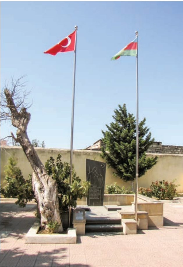
Şekil 24. Mastaga Sehitiği, Merdekan