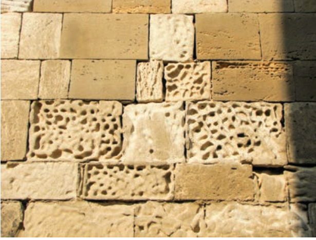
Şekil 3. "Bədamdam daşı"nda görülen oyuklanma/alveoler bozulma