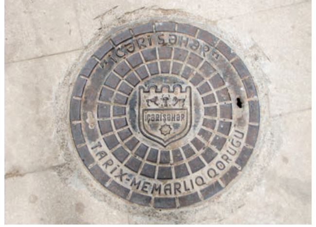
Şekil 4. İçerişehir Tarih-Mimarlık Qoruğu Logosu