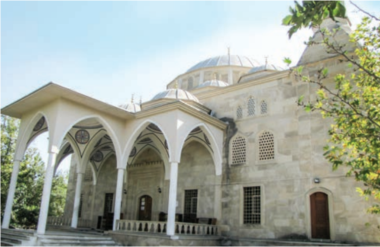
Şekil 22. Yevlah Cuma Mescidi