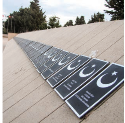
Şekil 23. "Şehidler Xiyabanı", Bakü