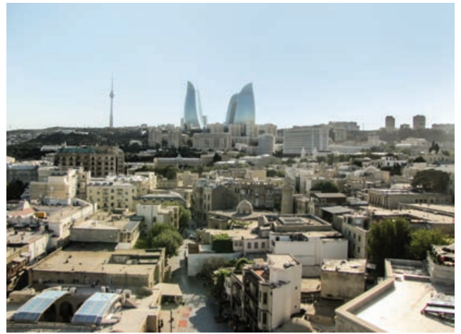
Şekil 6. Qız Qalası'ndan İçerişehir'e bakış

kültür varlıkları, 10 Nisan 1998 tarih ve 470 sayılı "Tarix və mədəniyyət abidələrinin qorunması haqqında Azərbaycan Respublikasının Qanunu" başlıklı kanunla, devlet tarafından koruma altına alınmıştır. Kanunda, Türkiye Cumhuriyeti mevzuatında "sit" olarak anılan alanlar "qoruq", "anıt" olarak nitelendirilen yapılar ise "abide" olarak tanımlanmaktadır (Url-2).