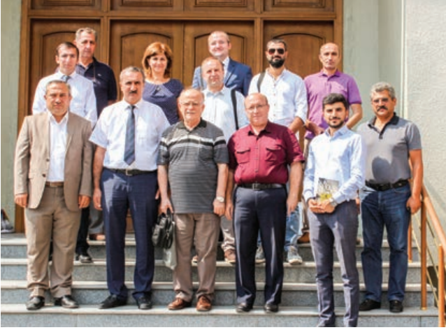
Şekil 13. Azərbaypa ekibiyle toplantı sonrası çekilen hatıra fotoğrafı