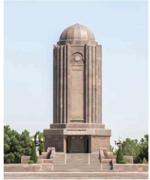
Şekil 20. Nizami Gencevi Türbesi

Gence, ticaret yolları üzerinde olduğundan, tarihte birçok kuşatmaya maruz kalmıştır. Kentteki yapılar; gerek kuşatmalar, gerekse doğal afetler yüzünden maruz kalan hasarlar nedeniyle birçok defa onarılmıştır.