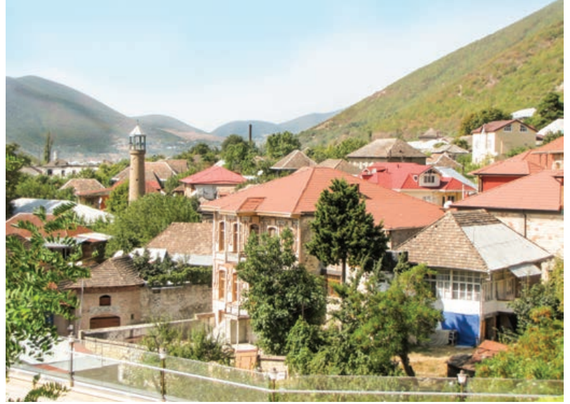
Şekil 18. Şeki tarihi kent merkezinden bir görünüm.

hazırlanarak restorasyon çalışması yapılmıştır.