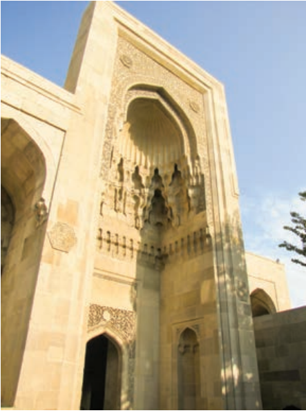
Şekil 7. Şirvanşahlar Sarayı, Portal

izler taşımaktadır. İçerişehar’i çevreleyen ve savunma sisteminin temelini oluşturan surların büyük bir bölümü 12. yüzyıldan günümüze ulaşmış olmakla birlikte, kentin simgesi olan ve günümüzde müze olarak kullanılan Qız Qalası ’nın (Kız Kulesi) ilk inşa tarihinin MÖ 6-7. yüzyıllara uzanabileceği düşünülmektedir. 1 Kent merkezinde Ortaçağ’dan günümüze ulaşan birçok cami, kervansaray ve hamamla birlikte, özellikle 18., 19. ve 20. yüzyıllarda inşa edilmiş konut yapıları yer almaktadır.