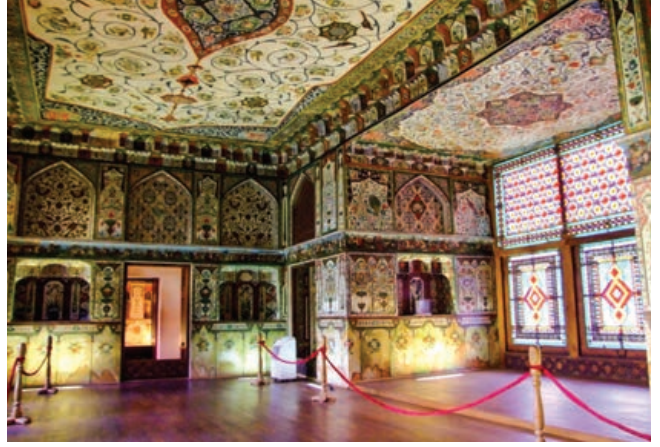
Şekil 16. Şeki Hanlar Sarayı iç mekânından bir görünüm (Url-8)