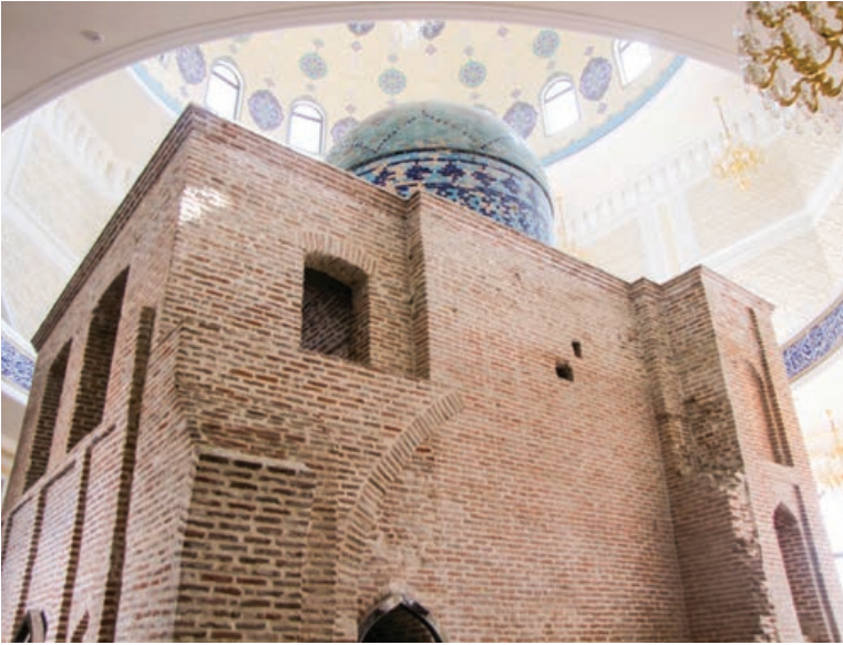
Şekil 19. Gence İmamzade Türbesi