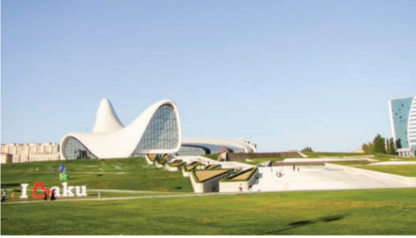
Şekil 9. Haydar Aliyev Merkezi, Bakü