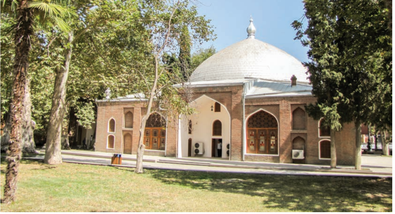
Şekil 21. Sah Abbas Mescidi

gerçekleşmiştir. Heyetlerarası görüş alışverişi şeklinde geçen toplantı öncesinde, kültür merkezi dahilinde bulunan müze de ziyaret edilmiştir. Azerbaycan'ın ilk kadın şairlerinden olan ve 11. yüzyıl sonu ile 12. yüzyıl başlarında yaşamış olan Mehseti Gencevi'ye ithaf edilen müze, Gence ve Azerbaycan kültürü hakkında bilgiler sunmaktadır.