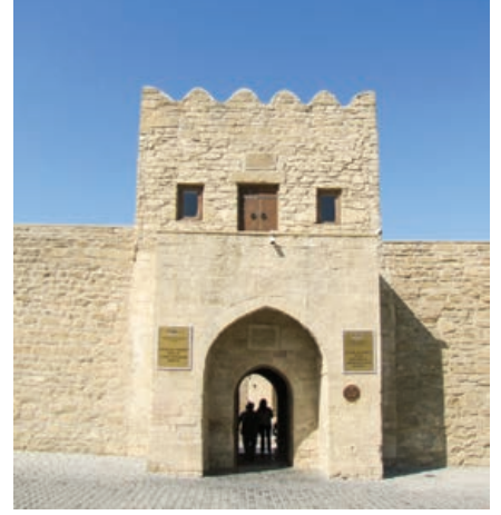
Şekil 10. Ateşgâh yapı kompleksinin girişi