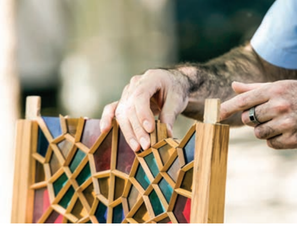
Şekil 15. Ahşap pencere şebekesi detayı (ABAD Merkezi, Url-7)