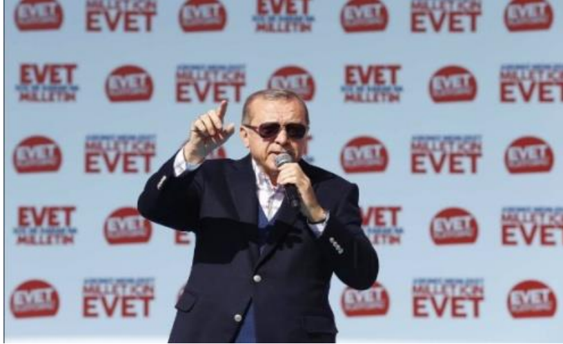
Şekil 1:Recep Tayyip Erdoğan 9 Nisan 2017 Tarihli Twitter Fotoğrafi.

Gösterge: Recep Tayyip Erdoğan'ın Twitter Fotoğrafi.