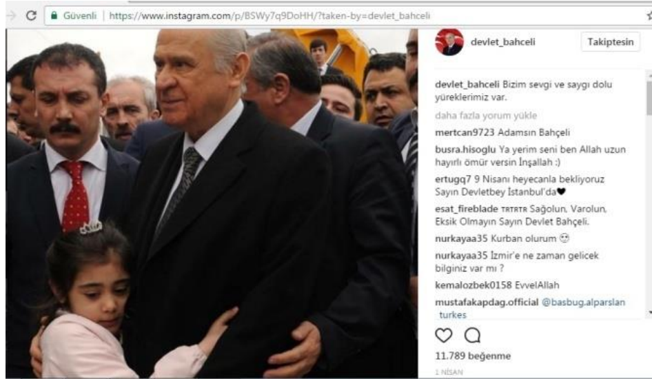
Şekil 7: Devlet Bahçeli 1 Nisan Tarihli Instagram Fotoğrafi

Gösterge: Devlet Bahçeli'nin Instagram Fotoğrafi.