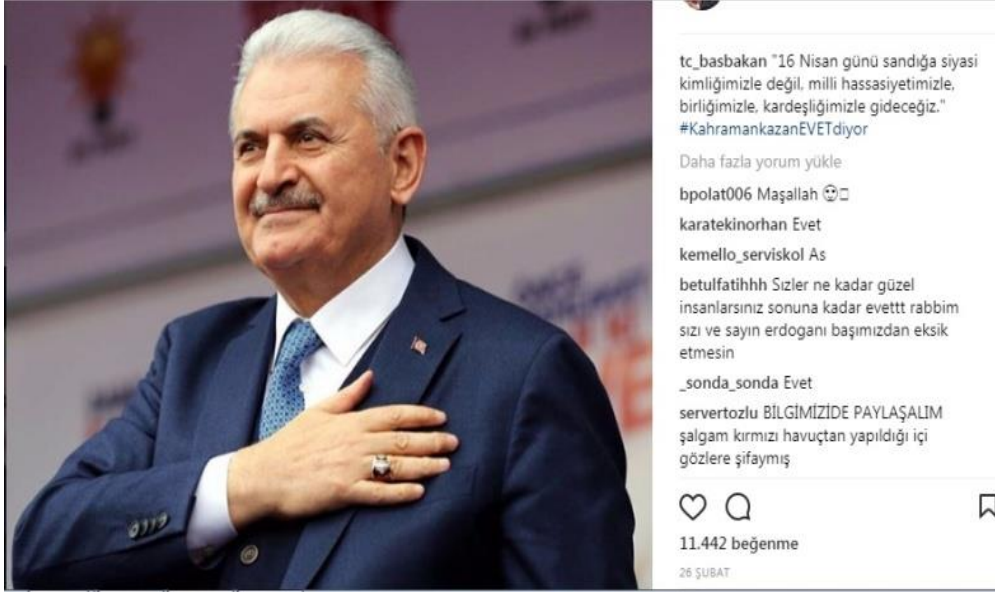
Şekil 4: Binali Yıldırım 26 Şubat Tarihli Instagram Fotoğrafi

Gösterge: Binali Yıldırım'ın Instagram Fotoğrafi.