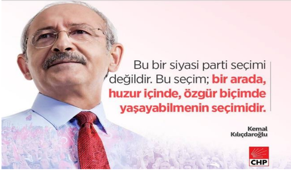
Şekil 5: Kemal Kılıçdaroğlu 22 Şubat Tarihli Facebook Fotoğrafi

Gösterge: Kemal Kılıçdaroğlu'nun Facebook Fotoğrafi.