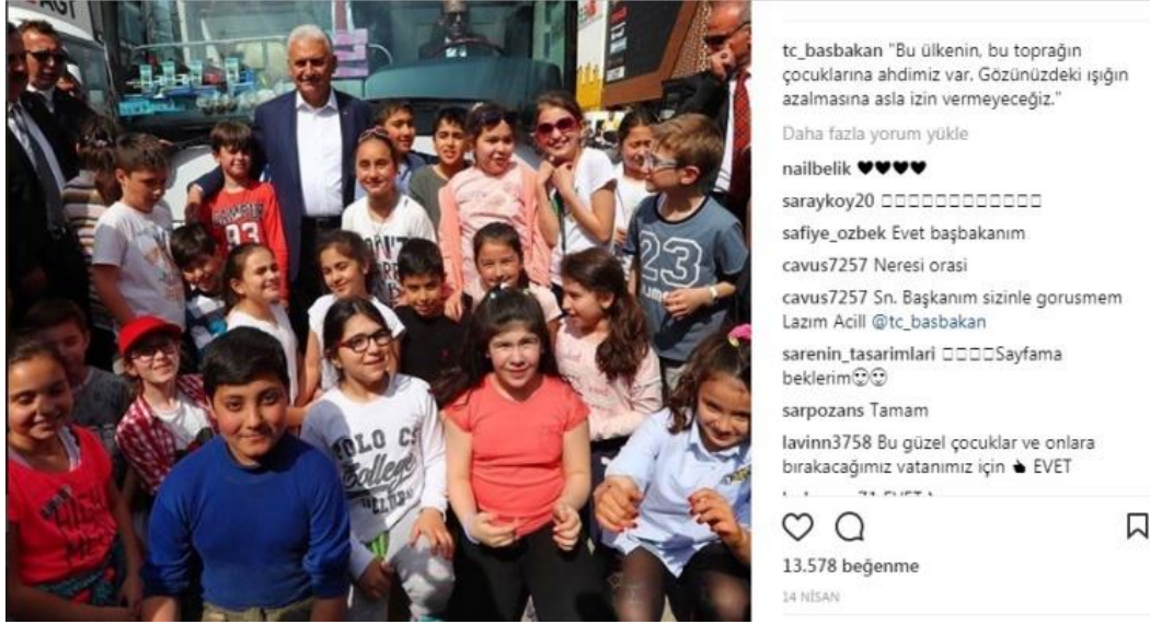
Şekil 3: Binali Yıldırım 14 Nisan Tarihli InstagramFotoğrafi

Gösterge: Binali Yıldırım'ın Instagram Fotoğrafi.