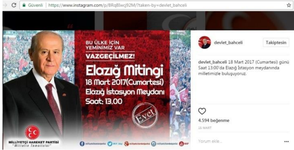
Şekil 8: Devlet Bahçeli 15 Mart Tarihli Instagram Fotoğrafi

Gösterge: Devlet Bahçeli'nin Instagram Fotoğrafi.