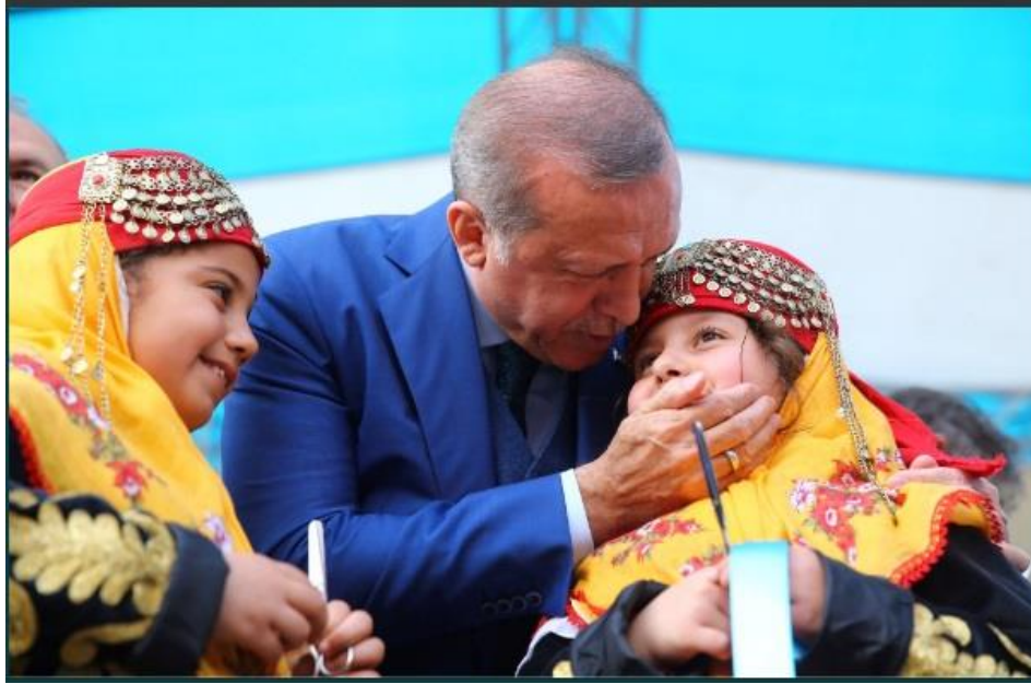
Şekil 2:Recep Tayyip Erdoğan 7 Nisan 2017 Tarihli Twitter Fotoğrafi

Gösterge: Recep Tayyip Erdoğan'ın Twitter Fotoğrafi.