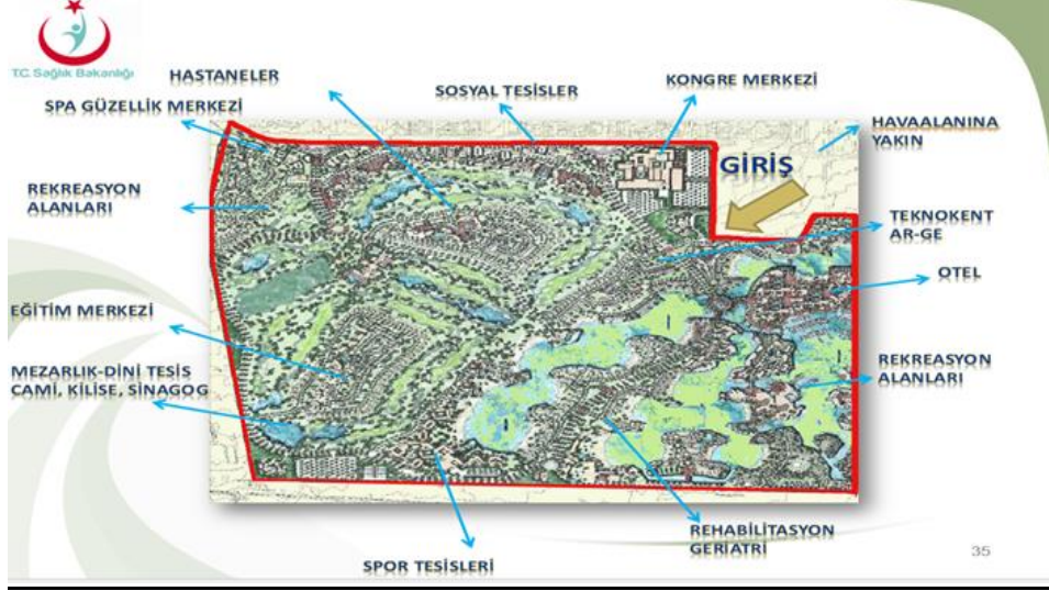
Şekil 2: Sağlık Serbest Bölge Yerleşkesi