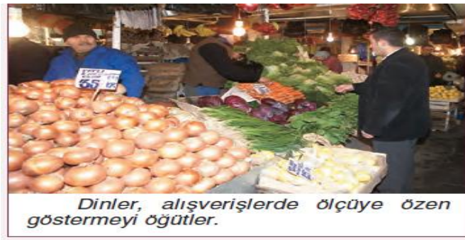
Resim 2. Alışverişle İlgili Resim