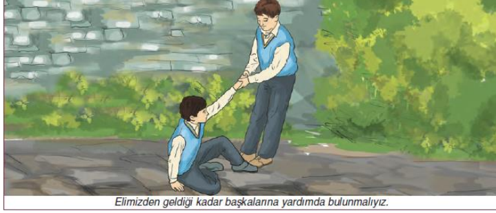
Resim 4. Yardımseverlik ile İlgili Resim