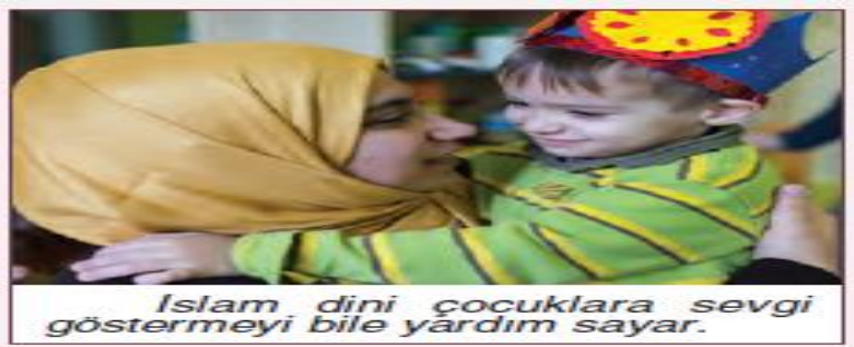
Resim 5. Çocuklara Sevgi İle İlgili Resim