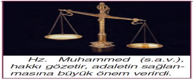
Resim 1. Terazi resmi 51