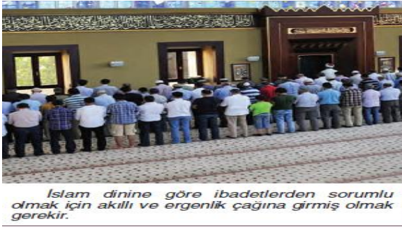
Resim 7. Namaz İle İlgili Resim 69

İslam dinine göre ibadetlerden sorumlu olmak için akıllı ve ergenlik çağına girmiş olmak gerekir.