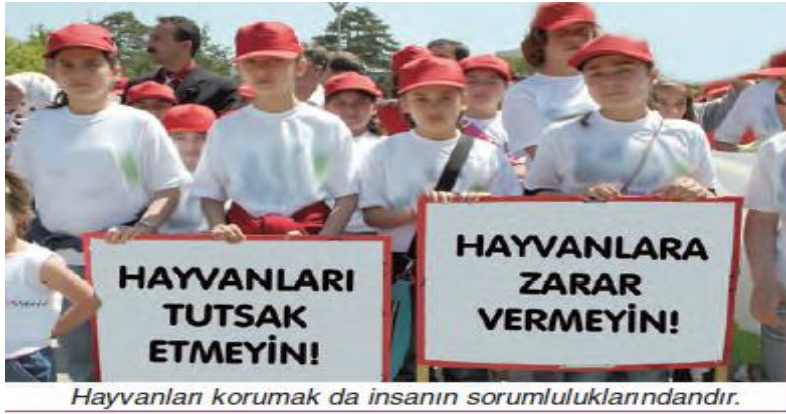
Resim 6. Hayvanları Korumak İle İlgili Resim