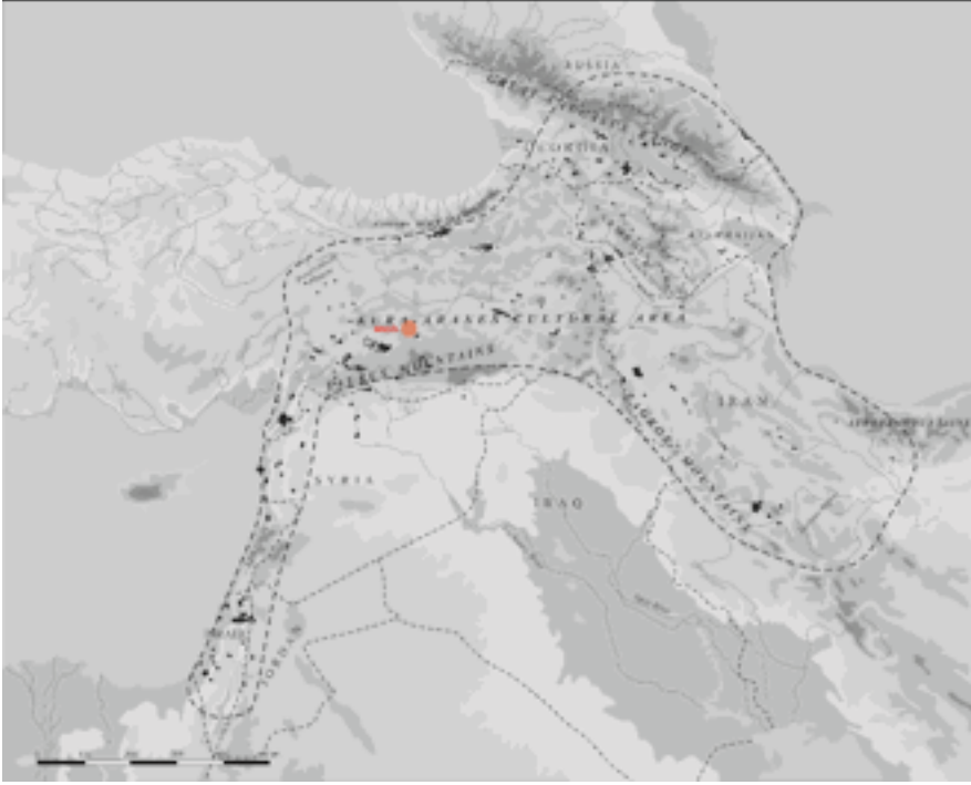
Resim 1 : Kura Aras Kültürü Yayılım Alanı ve Bingöl.