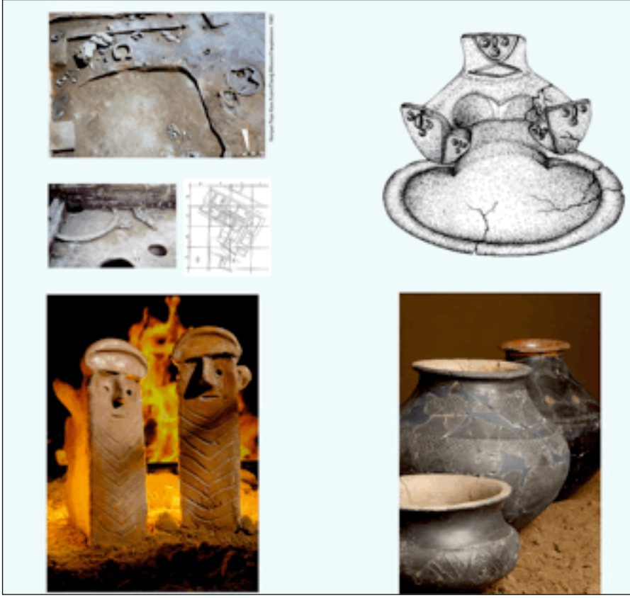
Resim 3: Kura – Aras Kültürüne Ait Materyaller.