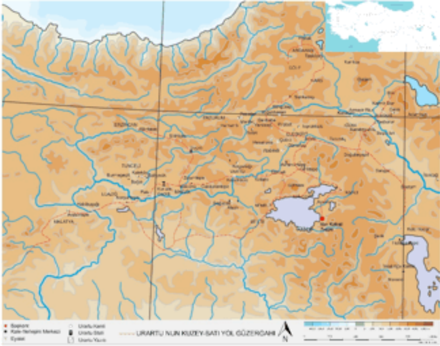
Harita 1: Urartu Krallığının Seferleri.