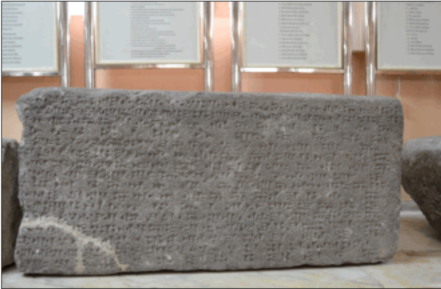
Resim 1: Urartu Kralı Minua'ya ait Alzi ve Şaşnu Ülkelerinin fethini konu alan Aznavurtepe Kalesi Tapınağı Yazıtı (Erzurum Müzesi Env. 37-91).