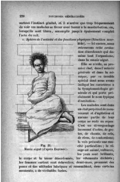
Resim 5: Précis de Psychiatrie deki 21. Resim (Régis, 1906: 220)