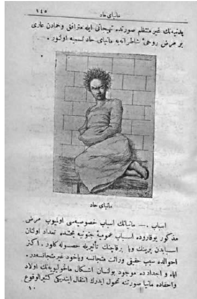
Resim 6: Muhtasar Emrâz-ı Akliyye deki 1. Resim (Mahmud, 1910: 145)