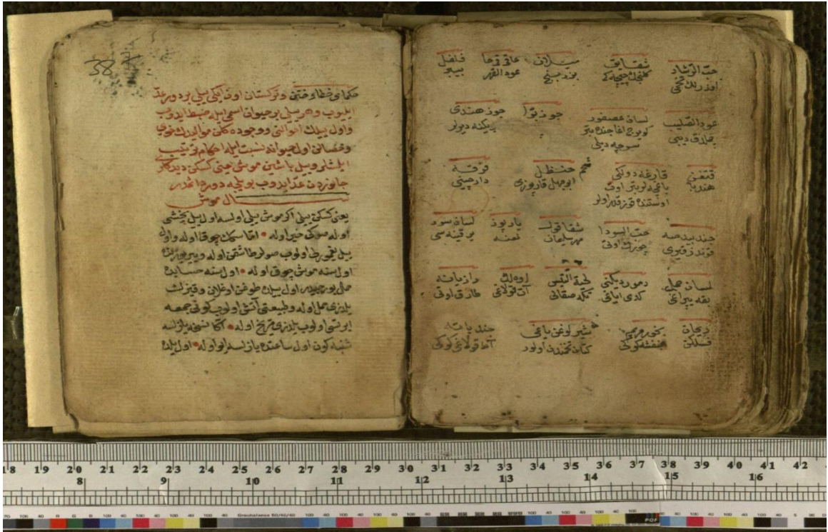
Görsel-2: Bazı bitki isimleri verildiği varak ve 12 Hayvanlı Türk Takvimi’yle ilgili giriş kısmı (37b/38a)

37b’de bir sayfa halinde bazı çiçek isimleri verilmiş ve bunlardan bazıları ile ilgili kısa bilgiler yazılmıştır. “Serçe dili, kunduz kırığı, yir kınası, demür dikenini, kedi ayağı, teke sakalı, at kulağı, şırlugan yağı” gibi bugün kullanılmayan bazı bitki isimleri dikkat çekicidir.