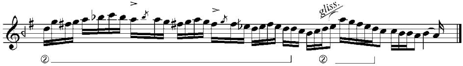
Şekil 7: Lâvta üslûbunda sıklıkla kullanılan cümle (2.13. Saniye).

Aşağıda örnek olarak verilen cümlede Yorgo Bacanos'a ait olan, karakteristik melodilerden birisi göze çarpmaktadır. Bu melodi için tipik bir Yorgo Bacanos tavrı da denilebilir. Bu melodi lâvta üslûbuna yakınlığı ile dikkat çekmekte olup Cemil Bey'in kurduğu cümlelere de benzerliği ile dikkat çekmektedir. Mutlu Torun'a göre bu cümle, "Bacanos'un yaptığı ilk taksimlerden olması sebebi ile lâvta üslûbunun etkileri görülebilmektedir" (Mutlu Torun ile özel görüşme, 24 Aralık 2014).