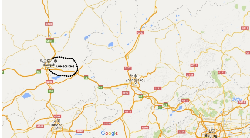
Harita III: Shi Weile'ya göre Longcheng'in konumu

Shi Weile'nin fikrine göre İç Moğolistan'daki Ulaγancab Ayimaγ'ın doğu tarafındadır [Shi Weile 2005: 1472].