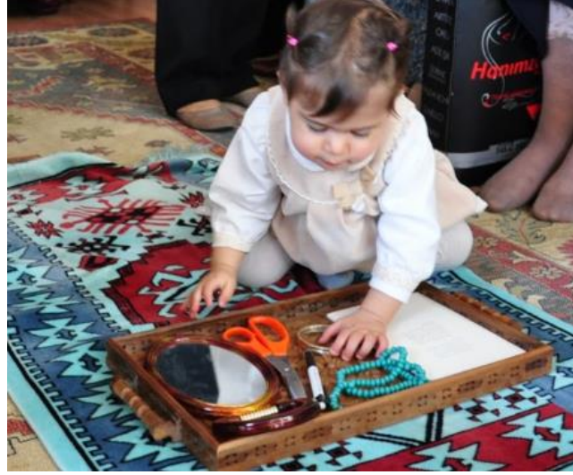
Foto 4. Dış Hedîği Töreninde çocuğun önüne tepsinin içinde her mesleğe ait bir alet – malzeme konur. Çocuk hangisini seçerse gelecekte o mesleği yapacağına inanılır. Makas ise, terzi mesleğini temsil etmek için tepsiye konur.