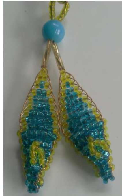
Foto 8. Örne Boncuktan Yapılan, Çocukların Omuzlarına Takılan Nazarlık Örnekleri.