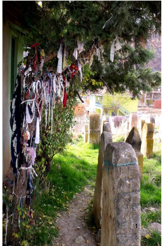
Foto10. Bir Halk Kültürü Unsuru Olarak Kurdelenin Adak Olarak Kullanıldığı Alanlar (Tokat, Zile Acısu Köyü)