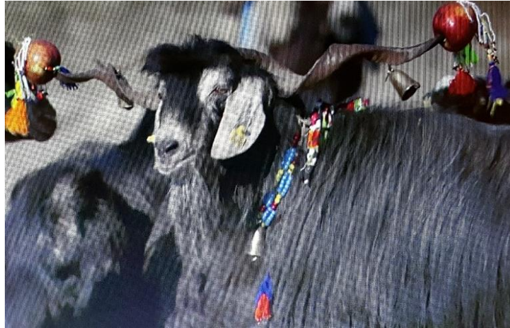
Foto 13. Kurdele, boncuk ve ipliğin hem adak hem de tören amaçlı kullanıldığı bir başka alan ise “Teke Katımı”dır.