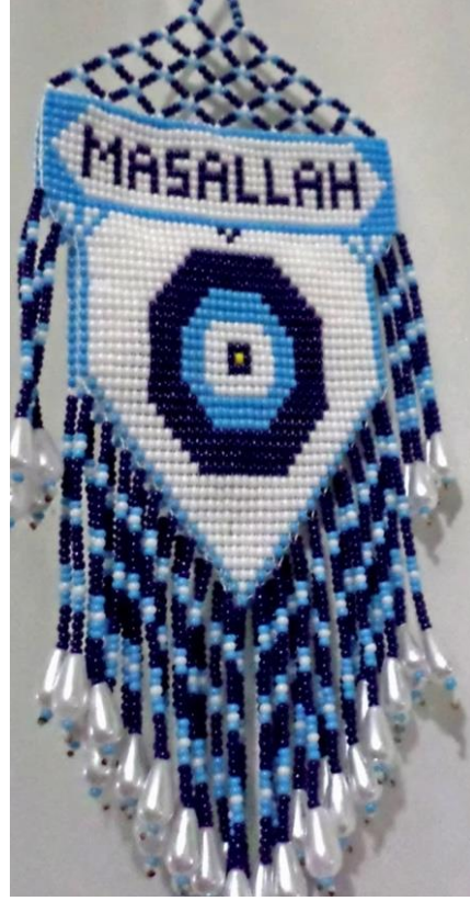
Foto 7. Boncukların Örülmesiyle Yapılmış Halk Arasında Cezaevi Örmesi Olarak da Bilinen Nazarlık Örnekleri.