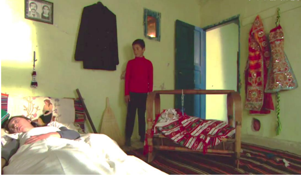
Foto 5. Anadolu'da Lohusa odasının duvarına asılan erkek elbisesi, al karısını evden kapı dışarı eden erkeğin (demircinin) egemenliğinin sabitlenmesidir (TRT SIRAÇ Belgeselinden).