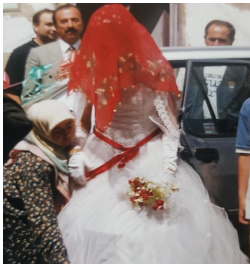
Foto 3. Bir Halk Kültürü Unsuru Olarak Kurdelenin Kullanım Alanlarından Bir Diğeri de, Gelinin Beline Babası ,Abisi Tarafından “Gayret Kuşağı” Olarak Bağlanmasıdır.