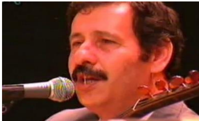
Foto 14. Aşıklık Geleneğinde İğnenin Halk Kültürü Unsuru Olarak kullanıldığı Leb Değmez.