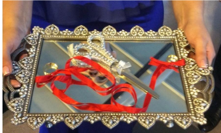
Foto 1. Kurdele ve Makasın Halk Kültürü Unsuruna Dönüştüren Nişan Töreni.