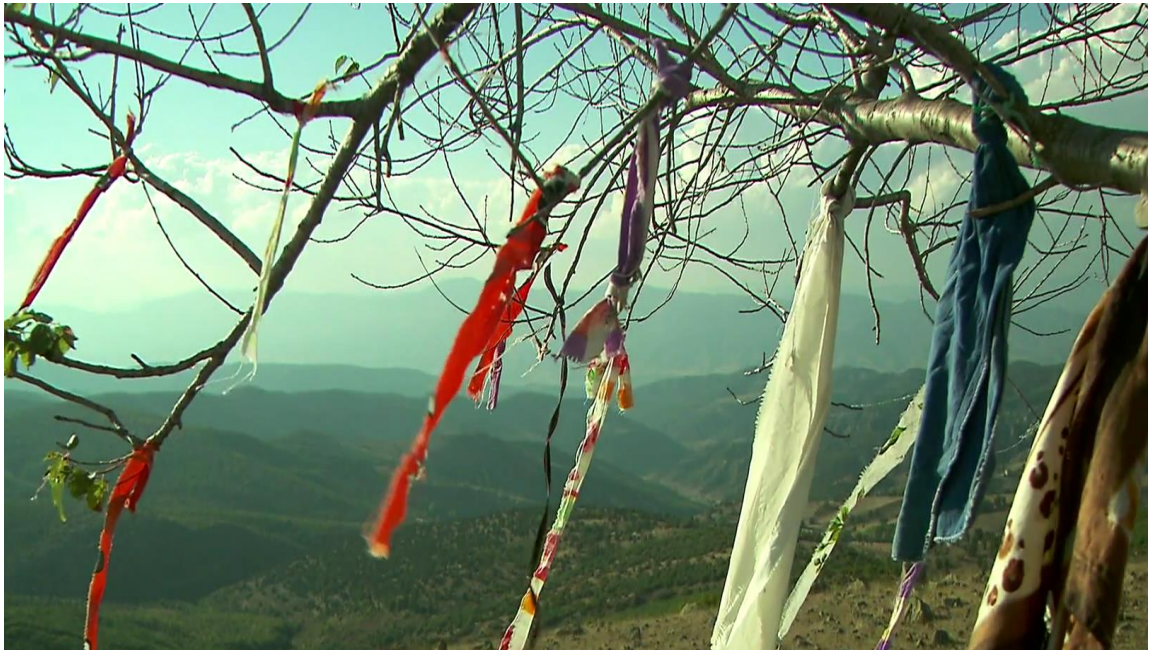
Foto 11. Anşa Bacılı Beydili Sıraç Türkmenlerinde Adağın kutsal kabul edilen ağaçlara İplik, Kurdele veya Kumaş aracılığıyla Nişan Edilmesi (Tokat, Zile Acısu Köyü)