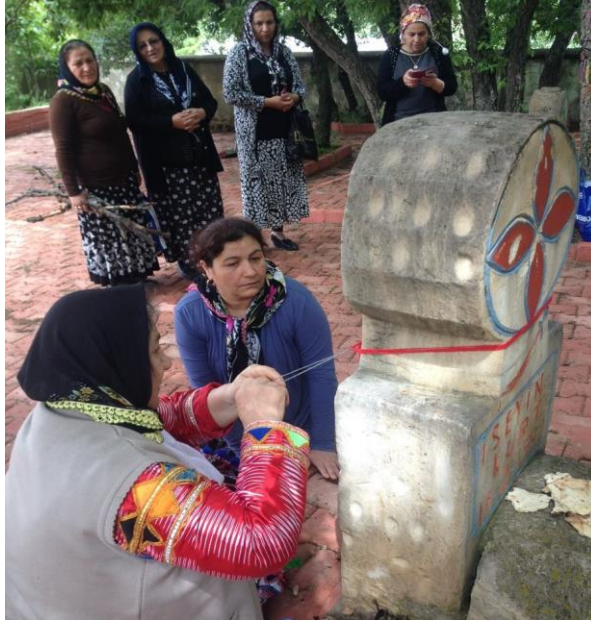
Foto 12. Anşa Bacılı Beydili Sıraç Türkmenlerinde iplik ve kumaş parçaları kutsal kabul edilen ataların mezar taşlarının boyun kısmına adak olarak bağlanmaktadır. (Tokat, Zile Acısu Köyü)