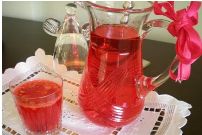
Foto 2. Bir halk kültürü unsuru olarak Kurdelenin kullanım alanlarından biri de Söz kesimi Şerbetidir. Sürahinin