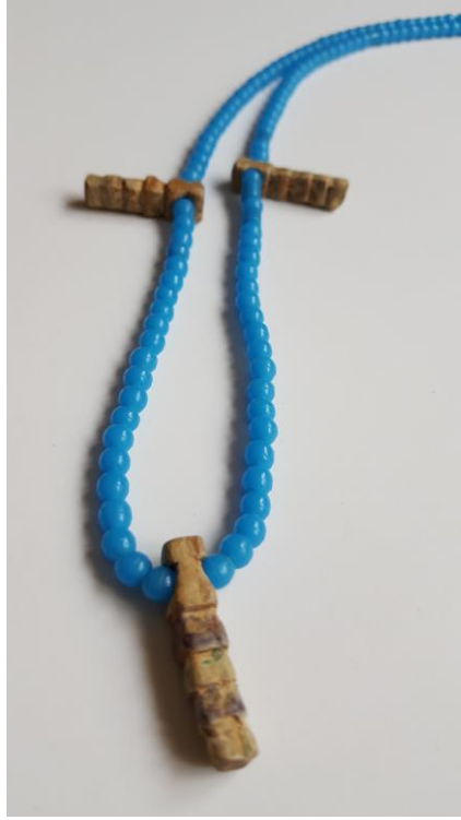
Foto 9. Çocuğa nazar değmemesi için mavi boncuktan ve iğde dalından yapılmış, boyna asılan bir nazarlık