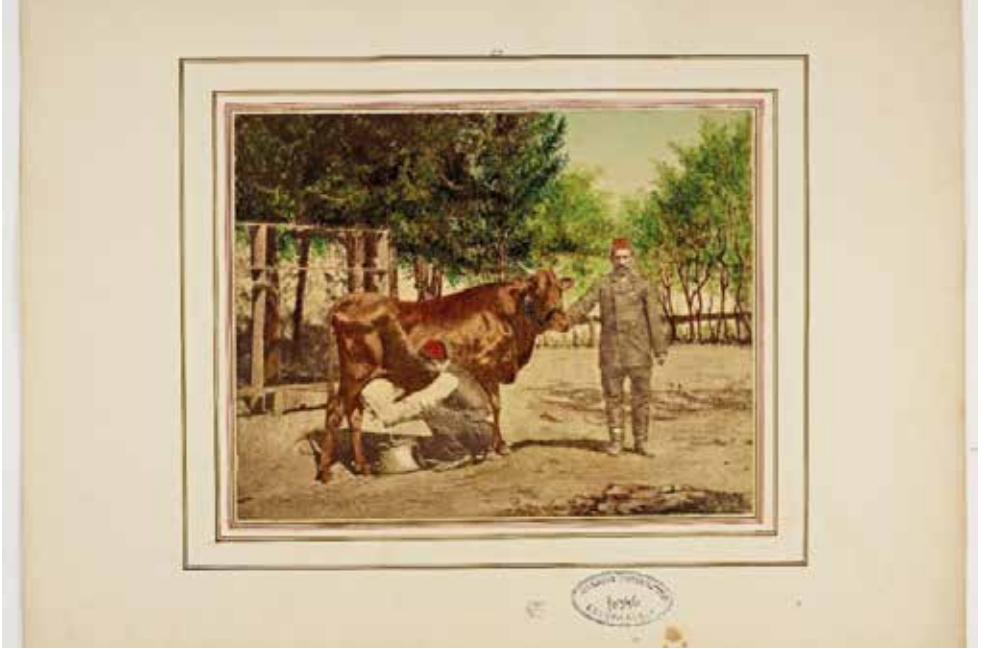
Ek 6-7 . Yıldız Sarayı'nda Bulunan Büyükbaş Hayvanlar