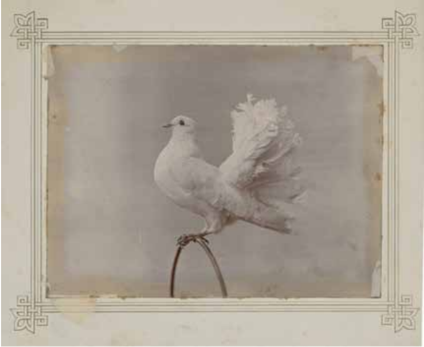
Ek 3-4. Yıldız Sarayı'nda Bulunan Cins Güvercinler