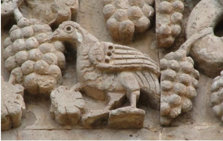
Ek 6. Özdemir Adızel, 2006, Akdamar Kilisesi, Üzüm gagalar vaziyette betimlenen keklik figürü