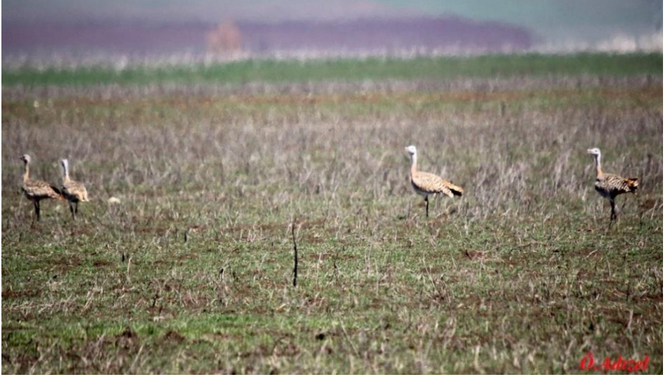
Ek 21. Özdemir Adızel, Toy kuşu.