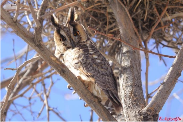
Ek 16. Erkan Azizoğlu, Kulaklı orman baykuşu