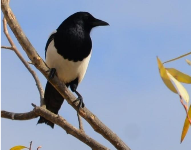
Ek 13. Hasan Buğrul. Alacalı karga