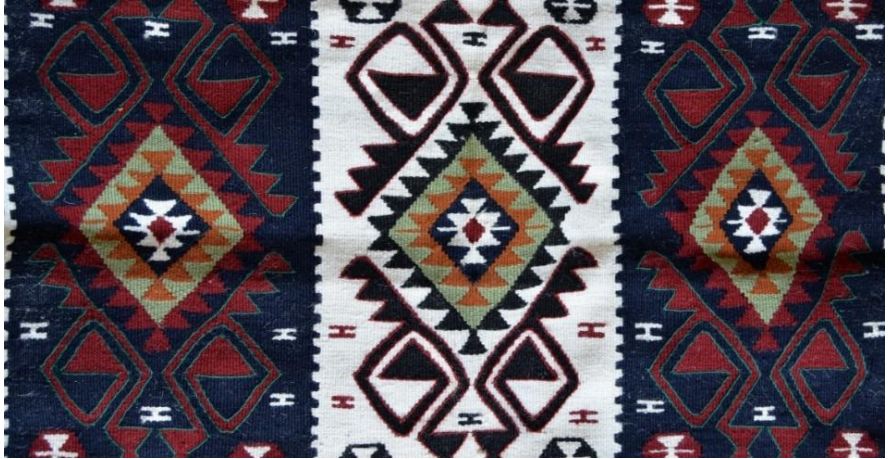
Ek 8. Hasan Buğrul, 2018, Üç kuşak şeklinde dokuması yapılan muhabbet kuşu motifli kilim. Geçitli - Hakkâri. Yörede bu motif "lüleper" olarak bilinmektedir.