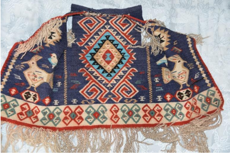
Ek 7. Hasan Buğrul, 2018, Hakkâri'nin Çukurca ilçe merkezinde dokumasına rastlanan hüthüt kuşu & "lüleper / muhabbet kuşu", koçboynuzu, bukağı vb. motiflere sahip kadın kilim yelegi.