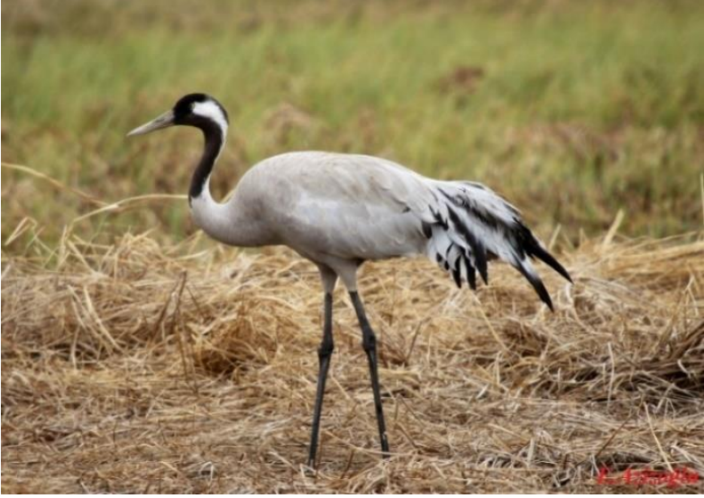
Ek 17. Erkan Azizoglu, Turna.