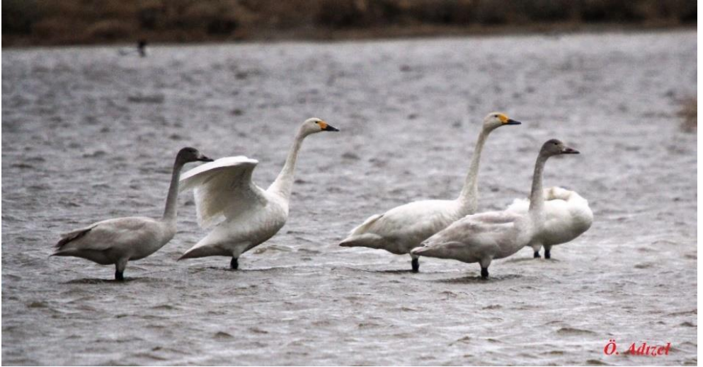
Ek 20. Özdemir Adızel, Kuğu kuşu.