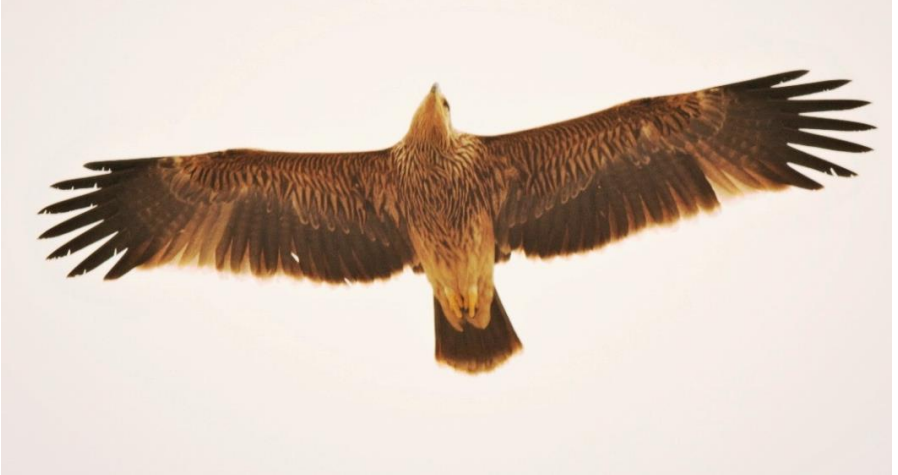
Ek 10. Erkan Azizoğlu. Şah kartalı