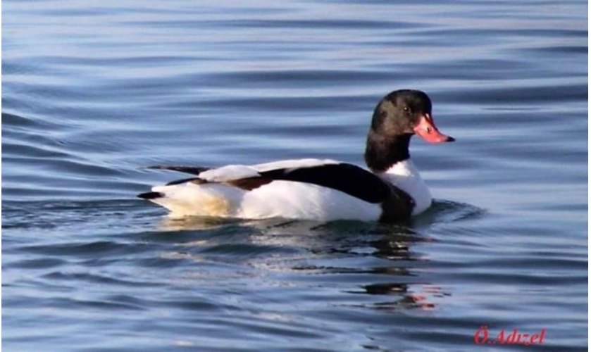
Ek 12. Özdemir Adızel, Dişi bir Suna kuşu.