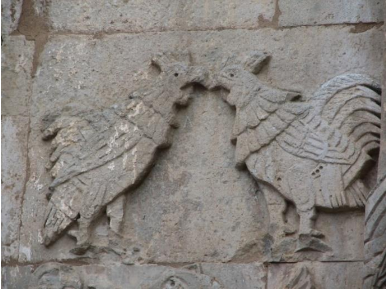
Ek 4. Özdemir Adızel, 2006, Akdamar Kilisesi, Horoz doğuşu figürü