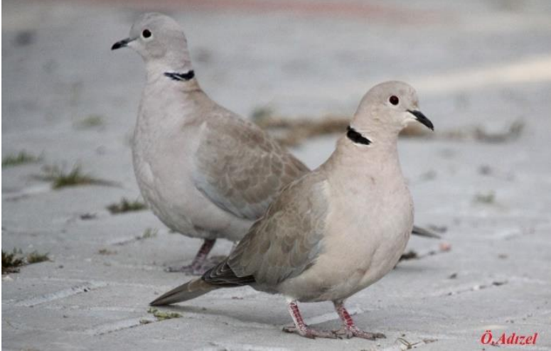
Ek 18. Özdemir Adızel, Kumru