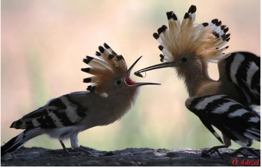
Ek 9. Özdemir Adızel, Yavrusunu besleyen bir hüthüt kuşu.