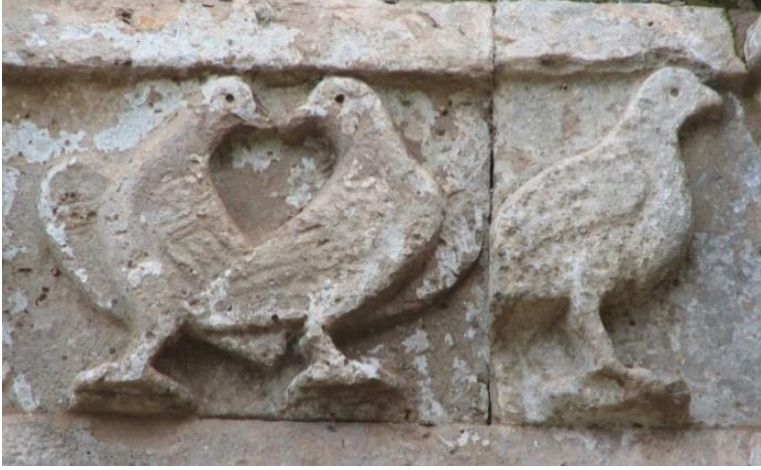
Ek 5. Özdemir Adızel, 2006, Akdamar Kilisesi, üç güvercine ait kabartma figür