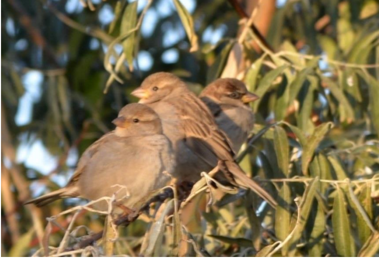
Ek 15. Hasan Buğrul, Serçe kuşu