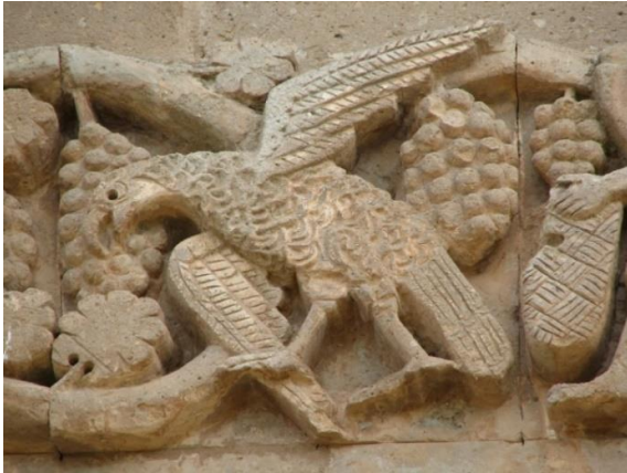
Ek 2. Özdemir Adızel, 2006, Akdamar Kilisesi, üzüm gaganayan bir kartalın kabartma figürü