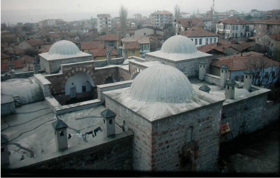
Resim 4. Merzifon Çelebi Mehmed Medresesi, Genel Görünüm