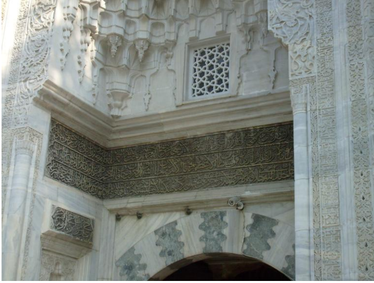
Resim 1. Bursa Yeşil Zaviye, Kitabe