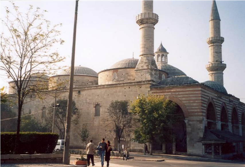
Resim 2. Edirne Eski Cami, Genel Görünüm