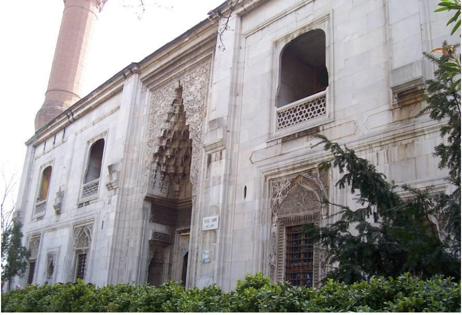
Resim 5. Bursa Yeşil Zaviye, Giriş Cephesi