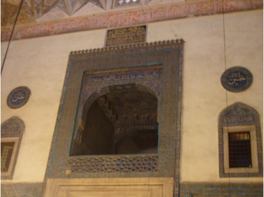
Resim 6. Bursa Yeşil Zaviye, Hünkâr Mahfili