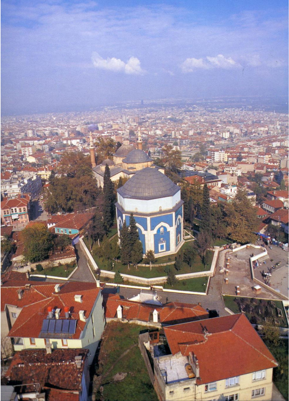
Resim 7. Bursa Yeřil Trbe