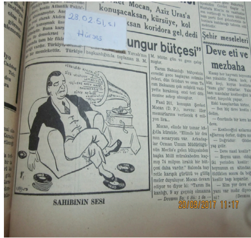
RESİM 4: 28 Şubat 1951, s. 1 (Hürses)

Bu yazıdan sonra yayınlanan bir karikatür de Be. Fa.'nın yazdıkları ile birebir örtüşmektedir. Yine karikatürde de DP isim vermeden eleştirilmiştir.