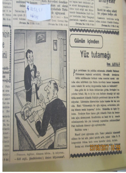
RESİM 3: 4 Ekim 1951, s. 1 (Hürses)