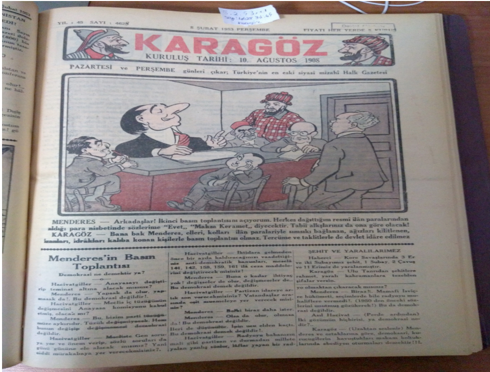
RESİM 5: 5 ŞUBAT 1953, s. 1 (Besleme Basın Karikatürü- Karagöz)

Başyazı görüldüğü gibi, iki bölümden oluşmaktadır: resmi ilanlar ve gazetenin muhalefet anlayışı. Resmi ilan hususunda, kendilerine herhangi bir iltimas geçilmediğinin altı çizilirken, CHP'nin resmi yayın organı Ulus'un iftiralarda bulunduğu dile getirilmiş ve işin muhasebe kısmı için "hodri meydan" denmiştir. Esasında, daha önce de ifade edildiği gibi, çıktığı yıllar içerisinde, Hürses'in aldığı resmi ilan ücretleri toplamı ile Ulus'un arasında çok ciddi bir fark yoktur. Ancak, DP'nin resmi yayın organı Zafer'in aldığı toplam ücret ise Hürses'in yedi katından fazladır. Dolayısıyla, gazetenin bu konudaki beyanı doğrudur. Diğer bir mesele ise, Hürses'in DP'ye karşı tutumudur. Yayın hayatının başından beri "ortada" durulduğunun söylendiği yazıda, klasik muhalefet anlayışına karşı çıkıldığı ve kendileri için ölçünün daima okurlar olduğu ve "rüzgâra göre yön alınmadığı" vurgulanmıştır. Dolayısıyla, bir "DP yayın organı olunmadığı" ifade edilmiştir.