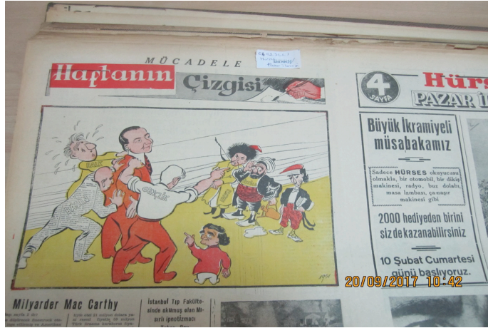
RESİM 1: 4 Şubat 1951, Pazar Eki, s. 1 (Hürses)

Hürses'in yayın politikası incelendiğinde, karikatürlerin ekseriyeti DP'nin seçim vaatlerini yerine getirmediği yönündedir. Bunun yanı sıra, irtica ve torpil ile DP arasında bağ kuran çizimler de yer almıştır.