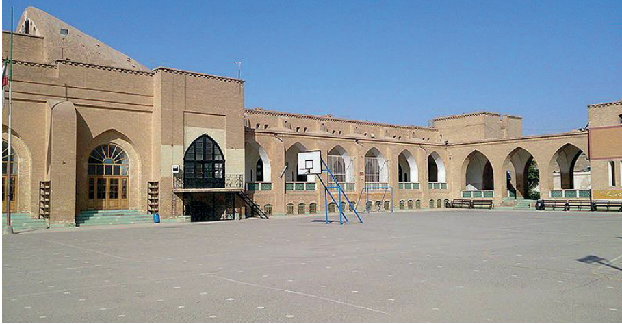
G. 7. Yazd İranşehr Okulu (1934-39) (Arash Kazemivand Niar) Mimar: Andre Godard (Vahid Ghobadian, a.g.e)