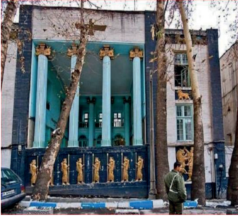
G. 14. Derbend Karakolu (1936) Giriş Bölümü Görünüşü ve Cephedeki Furuher Simgesi (Arash Kazemivand Niar) Mimar: Anonim