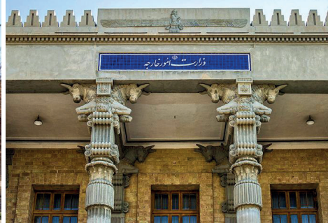
G. 12. (Solda) Şehrbâni Kōşkū (1932-36) (Şimdi Dış İşleri Bakanlığı Binası) Giriş Bölümü Görünüşü ve (Sağda) Cephesinde Kullanılan Furuher Simgesi (Arash Kazemivand Niar), Mimar: Gabel Guevrekian (Vahid Ghobadian, a.g.e)