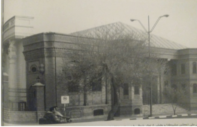
G. 2. Birinci Meclis Binası (1934) Mimar: Kerim Tâhîrzâde (Vahid Ghobadian, a.g.e)

Birinci grup yapılar arasına: Birinci Meclis Binası (1934) (G. 2), Posta İdaresi Binası (1928-1934) (G. 3), İran Dıř İşleri bakanlıđı Köřkü (1933-1939) (G. 4), Firüz Bahram Okulu (1930-1932) (G. 5), Zerdüşťler Ateřkedesi (1934) (G. 6), İranřehir Okulu (1934-1939) (G. 7) ve Antik İran Müzesi Binası (1934-1937) (G. 8) dahil edilebilir.