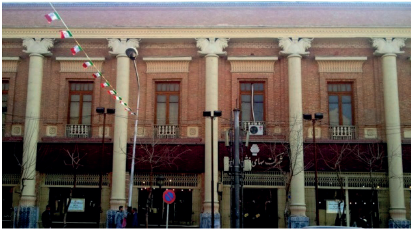
G. 15. Ferş (Halı) Binası (1926) (Vahid Ghobadian, a.g.e), Mimar: Anonim