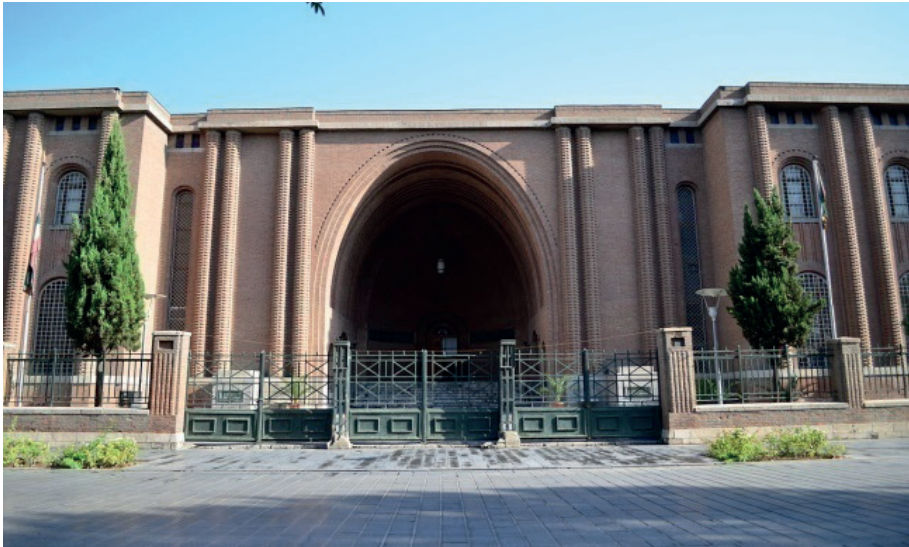
G. 8. Antik İran Müzesi (1934-37)(Arash Kazemivand Niar) Mimar: Andre Godard (Vahid Ghobadian, a.g.e)

İkinci gruptaki binalar arasında ise: Rıza Şah Hastanesi (1928-1934) (G. 9), Enûşirevan Okulu (1934-1936) (G. 10), Firdevsi'nin Mezarı (1929-1934) (G. 11), Şehrbâni Köşkü (1932-1936) (G. 12), İran Milli Bankası merkez binası (1933-1936) (G. 13), Derbend Karakolu (1936) (G. 14) ve Ferş Binası'nı (1926) (G. 15) saymak mümkündür. 43