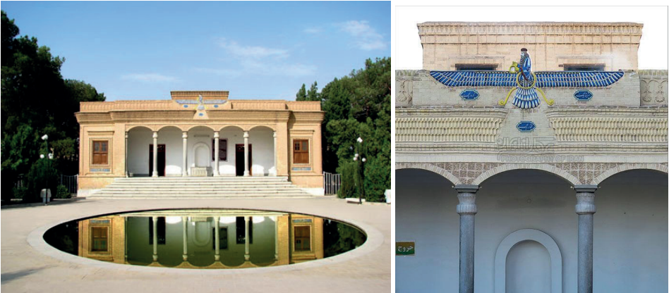
G. 6. (Solda) Yazd Zerdüşti Ateşkesesi (1934) Genel Görünüşü ve (Sađda) Cephesinde Kullanılan Furuher Simgesi (Arash Kazemivand Niar) Mimar: Anonim, Cemşid Emanet (Vahid Ghobadian, a.g.e)