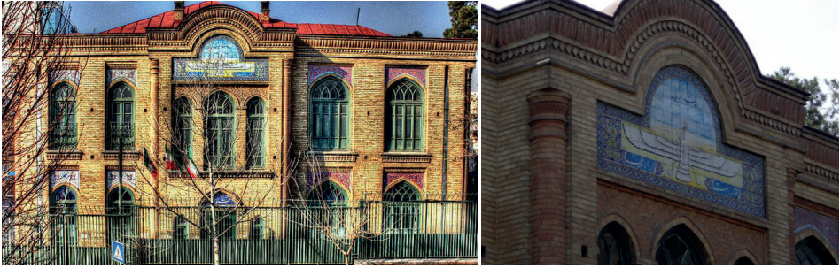
G. 5. (Solda) Firuz Bahramşah Okulu (1930-32) Genel Görünüşü ve (Sađda) Cephede Kullanılan Furuher Simgesi (Arash Kazemivand Niar) Mimar: Cafer Han Mimarbaşı (Vahid Ghobadian, a.g.e)