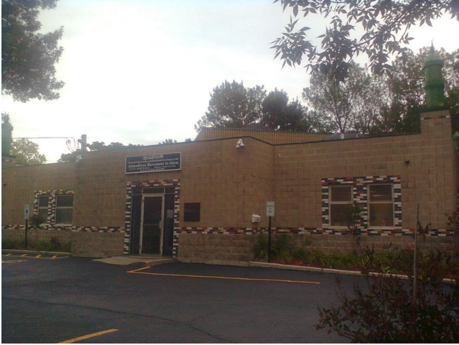
Chicago Ahmadiyya Mescidinin ön cephesi.