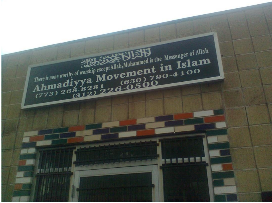
Chicago Ahmadiyya mescidinin ön cephesi üzerinde bulunan kelime-i tevhid ve İngilizce tercümesi.