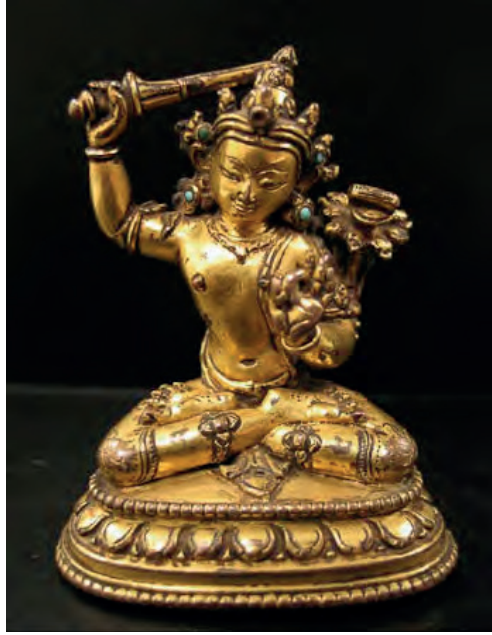
G. 8. Mañjuśrī, Nepal, 13-14.yy. bronz h. 6.5 cm. Collection of Nyingjei Lam (HAR 68442). (Debreczeny, a.g.e. , Cat. No: 24)