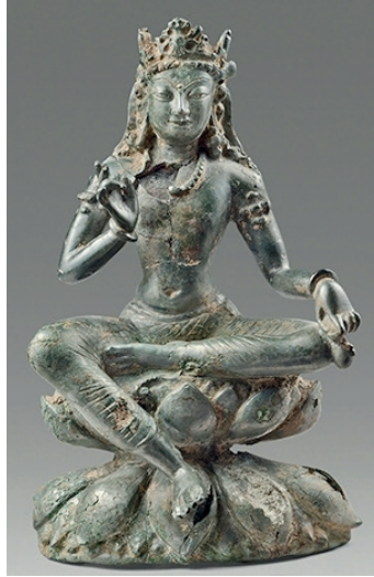
G. 5. Bodhisattva Maitreya, Swat vadisi, Kuzeybatı Pakistan, MS. 7. yy. h. 17.6 cm

Ancak taç artistik bakımdan incelendiğinde, açıkça Budist sanat içinde yer aldığı görülür.