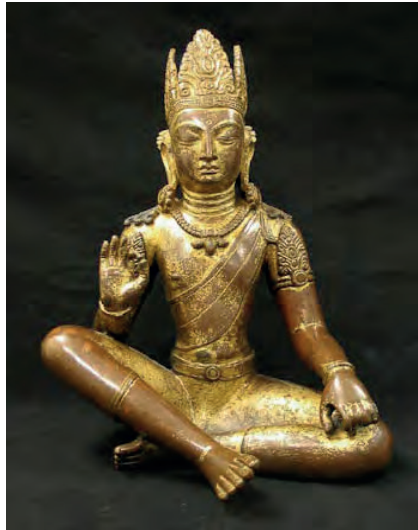
G. 7. Bodhisattva Mañjuśrī, Nepal. MS. 10. yy.

Wai-kam Ho, “Notes on Chinese Sculpture from Northern Ch’i to Sui Part I: Two Seated Stone Buddhas in the Cleveland Museum”, Archives of Asian Art , S. 22, 1968-1969, fig. 23).