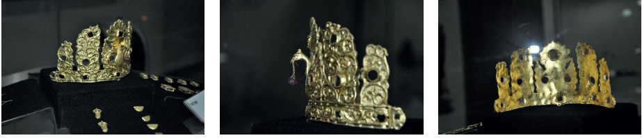
G. 1. (a-b-c) Moğolistan Tarih Müzesi'nde 2005-1 envanter numarası ile kayıtlı Bilge Kağan'a atfedilen taç Moğol Tarih Müzesi, Moğolistan

rin başlarında, börk ya da benzeri bir başlık olduğunu 6 , Çin kaynaklarından 7 ve günümüze ulaşabilen Gök Türk heykellerinden öğreniyorduk 8 . Ancak bir hükümdarlık sembolü olarak ilk defa elimize somut bir örnek geçmiş oldu. Aslında taç ile ilgili uygulamalar bozkırda oldukça eskiye uzanır. Geç Bronz / Erken Demir Çağı'na tarihlenen bazı petroglifler üzerinde 3 dişli taç kullanan figürler olduğu 9 ve bu formun kesintiye uğramadan Selçuklu Dönemi'ne kadar sevilerek kullanıldığını biliyoruz. 10