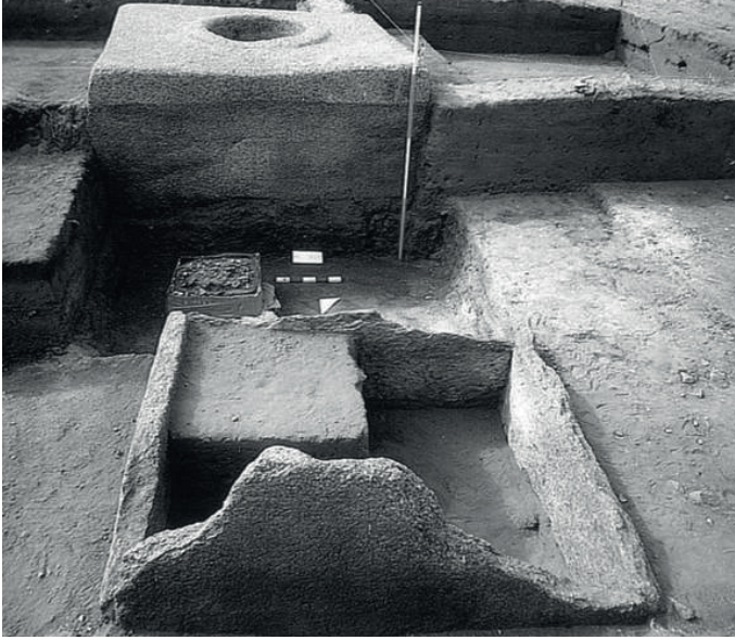
G. 12. Bilge Kağan Hazinesi olarak yayınlanan buluntu topluluğunun kazı esnasındaki durumu (Bahar, a.g.e., 2013, Görsel 6; Bayar, a.g.e., 2004, Görsel 7).

Kazı ekibi tezini desteklemek için koyduğu görselde de “orijinal taban sıvasının eserlerin üstünü kaplayacak şekilde sıvandığı” bilgisi olmakla birlikte, biz yapılan kazıda bu bilgiyi teyit edecek bir iz göremediğimizi ifade etmek isteriz. 41 Hatta görselden orijinal taban seviyesi görülmemektedir bile (G. 12).