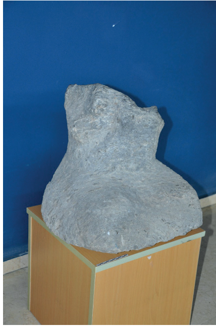
G. 4. Bilge Kağan külliyesine oturur şekilde tasvir edilmiş, oldukça tahrip olmuş bir heykel Höşöö Tsaydam Müzesi, Moğolistan