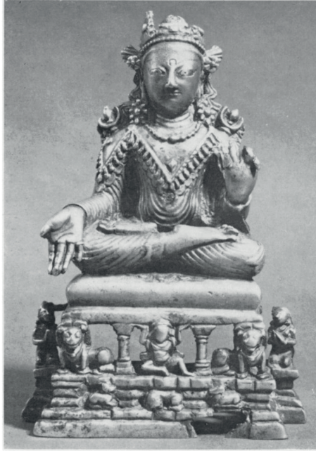
G. 6. Taçlı Buddha, bronz, Kaşmir, MS. 8-9.yy.lar