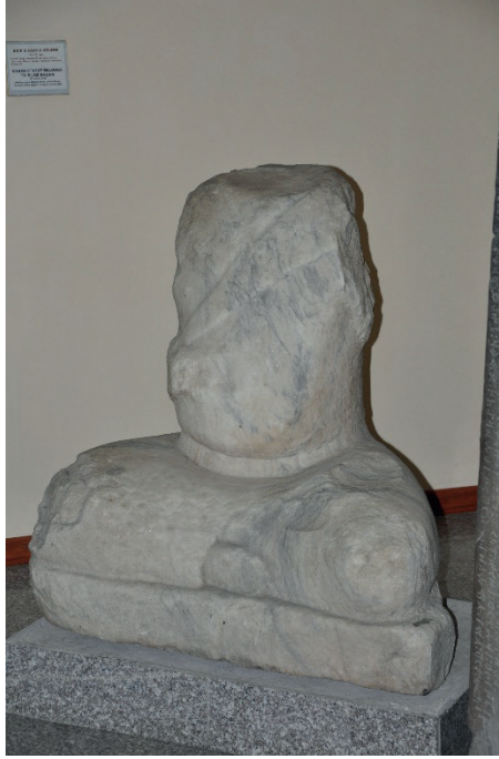
G. 2. Paltosunun soldan sağa doğru kapanması sebebi ile Bilge Kağan'a atfedilen heykel, Bilge Kağan külliyesi Moğol Tarih Müzesi, Moğolistan

tonun üzerinden geçirilmiş plakalardan mamul kemer, paltoyu sıkarak hareket etmeye kolaylık sağlıyor olmalıdır. Her iki heykelin de göğüs kısmı tahrip olmuştur ancak paltolarının yakaları gayet açık şekilde görülebilir. Heykele kuvvetli bir şekilde üç boyut etkisi yaratan sol kol gövdeden ayrı bir şekilde sol bacağından üzerinden kaval kemiğine doğru uzanır. Sağ kolları da ağır tahrip olmasına rağmen, vücuda yapışık bir şekilde göğüs yüksekliğinde durur. Diğer Gök Türk heykellerinden yola çıkarsak her iki heykelin de sağ elleri ile bir kap tuttıklarını söyleyebiliriz. Heykellerde dikkat çeken bir diğer husus, üzerlerinde silah olmamasıdır. Oysa geleneksel Türk heykellerinde poz veren Beyler çoğunlukla sol elleri ile ya kılıçlarını ya da bacağına doğru uzatmış şekilde gösterilirler. Heykellerdeki ince işçiliği de dikkate alırsak geleneksel ikonografik öğeleri tekrarladıklarını söyleyemeyiz. Heykeller bu halleri ile Pagodalardaki Buddha heykellerini çağrıştırmaktadırlar.