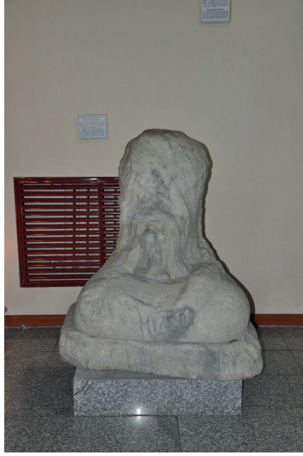
G. 3. Paltosunun sağdan sola doğru kapanması sebebi ile Bilge Kağan'ın karısına atfedilen heykel, Bilge Kağan külliyesi Moğol Tarih Müzesi, Moğolistan