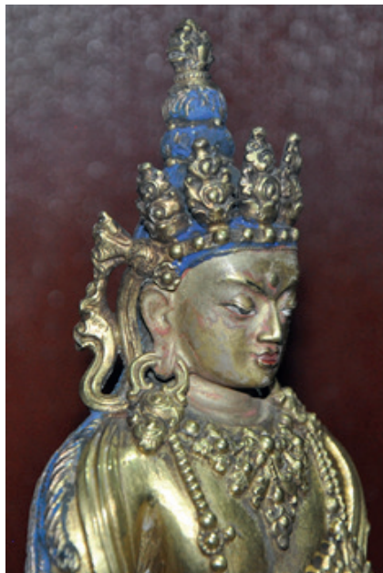
G. 10. Amitayus (detay), MS.18. yy. Zanazabar Müzesi, Ulaan Baatar, Moğolistan.