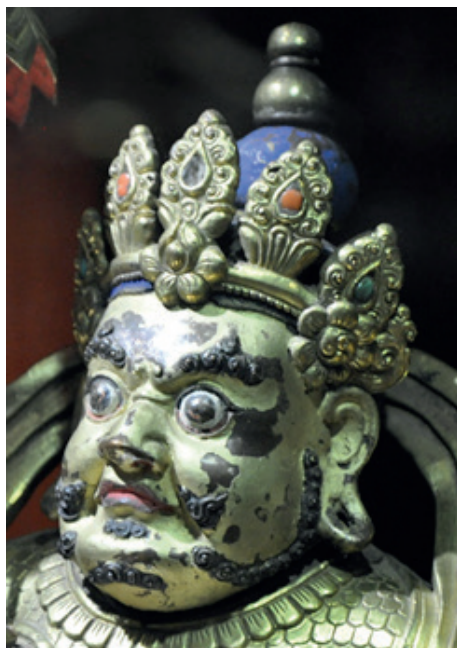
G. 11. Vaishravana (detay), MS.19.yy. Zanazabar Müzesi, Ulaan Baatar, Moğolistan.