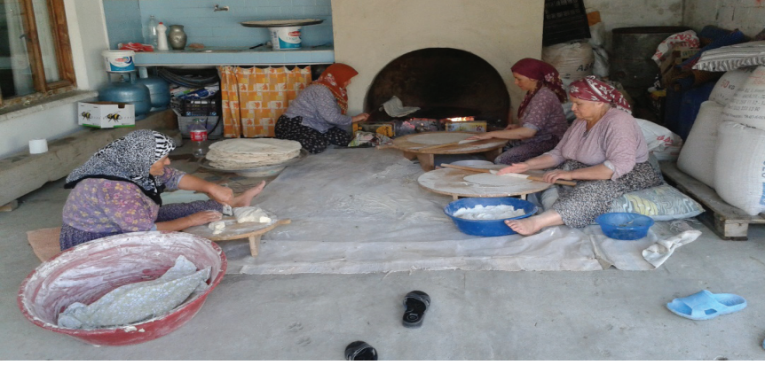
Görsel 12. Yufka yapımı

çörek'tir ve yöreye özgü bir pişirme şekli vardır. Buna göre önce sacın üstünde pişirilir; sonra kömür üzerine konan özel bir gereç üstünde kızartılır.