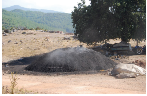
Görsel 2-3. Kömür yakma

Eskiden Kaş ve Üçağız merkezlerinde Rumlar, Meis Adası'nda ve Kale Mahallesi'nde Türkler yaşamış. Türklerin geçmişte denizle bir yerden bir yere gitmek dışında pek bir ilişkisi yokmuş. Onlar çobanlık yapar, karakeçi beslerlermiş. “Çobanlık tarımın seçeneğidir; ancak neredeyse hiçbir zaman ondan bağımsız olmamıştır” (Bates, 2009: 231). Kaş-Kekova bölgesinde de çobanlık; kuru tarım, zeytin yetiştiriciliği; keçiboynuzu, palamut, adaçayı toplayıcılığı; çeşitli otların yağının çıkarılması, kömür ve kireç yapımı ve arıcılık gibi işler ile birlikte yapılmıştır. Günümüzde bu faaliyetlerden kireç yakımı kalmamıştır. Kömürcülük de neredeyse yok olmak üzeredir. Arıcılık eskisine kıyasla azalmış durumdadır. Zeytincilik ve hayvancılık ise gittikçe azalmakta, kendi ihtiyaçlarını gidermek için bile yapılmaz olmaktadır.