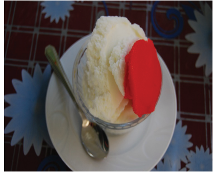
Görsel 9 ve 10. Kar şerbeti ve dondurma ile birlikte sunulan karlama