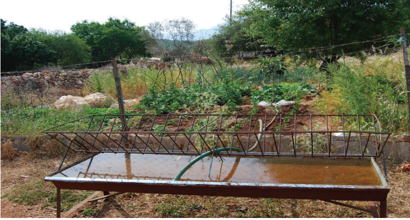
Görsel 4. Geçimlik sebze bahçesi

baklanın özel bir yeri vardır çünkü bu kurak bölgede yetişen nadir sebzelerden biridir. Yapılan görüşmelerde Kaş'ın özel bir baklasının olduğu dile getirilmiştir.