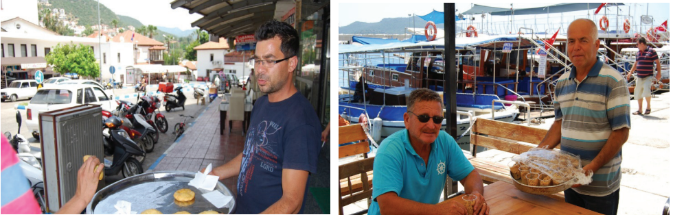
Görsel 16-17. Hayır dağıtılması

Bölgede balık geleneksel olarak kızartma ya da sulu yemek yapılarak yenir. Bunları restoranlar da yapmaktadır. Balığın yemeğine yahni denir. Yahni soğan, domates, sarımsak gibi sebzelerle sulu olarak pişirilir. O nedenle de balık yahnisi daha çok soğuk algınlığı olunca yapılmış.