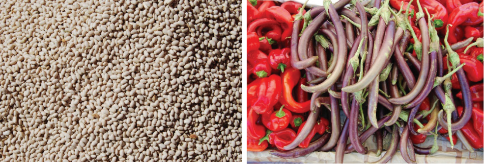
Görsel 7-8. Boncuk fasulye ve kebab yapılarak tüketilen yerli patlıcan

Yaylaya toplu gidilmez ama “on gün içinde herkes kalkar” deniyor. Yaylaya genelde 20 Mayıs’ta çıkılır ama mayısın onundan önce göçülmez. Sahil Barak’tan yaylaya gidiş üç gün sürer. Yaylaya göç edilirken köyde “soluklu bir şey kalmaz”, bütün canlılar götürülür. 20 Ekim’de de inilmeye başlanır, kasımda inilmiş olur. Bunun işaretleri; “servi ağacı yaprağını dökünce”, “ay şu dağı aştı mı sahile inilir” ya da “songüzün bir göç çiçeği çıkar, pembe çiçek açar, dibi soğanlı olur, güz çiçeği derler ama aslı göç çiçeğidir, bu açınca göçülür.” şeklinde ifade edilmiştir.