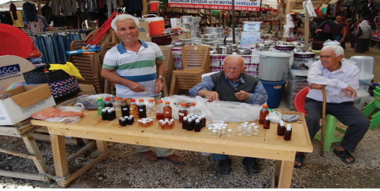
Görsel 18-19-20. Kekik yetiştirme, yağ teşkilatı ve pazarda satışı

Misafire buynuz dömeci ikram edilir. Dömeç yemeğin üstüne yenir. Kapaklı'da verilen bilgiye göre dömeç yapmak için; fazlaca buynuz ile az miktarda çitlembik ayrı ayrı dövülür, sonra karıştırılır. Karışım aynen çiğ köfte gibi birbirine yapıştığından parçalar halinde sunulur. Buna bazıları patlamış mısır da ekler.