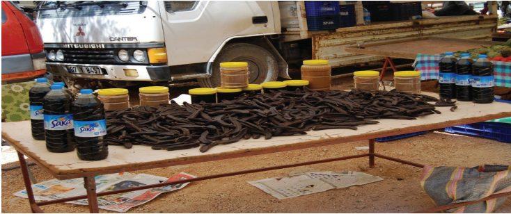
Görsel 11. Keçiboynuzu ve pekmezi

Keçiboynuzuna bölgede buynuz denir ve daha çok sahil köylerinde yetiştirilir. Eskiden keçiboynuzu satışı önemli gelir kaynaklarından biri imiş. Bir kaynak kişi dedesinin 200 dönümlük araziden 2-3 kamyon, yaklaşık 50 ton keçiboynuzu sattığını belirtmiştir. Buynuz aşılır, böylece akıllısı olur. Buna kerti denir. Akılsızına ve meyvesi olmayana keşir denir, sahilde olur, arı bundan polen yapar. Keçiboynuzundan günümüzde pekmez yapılmaktadır. Kapaklı'da bir kişi 1,5 ton pekmez sattığını söylemiştir. Buynuz toplandıktan sonra ne kadar beklerse, pekmezi de o kadar tatlı olurmuş.