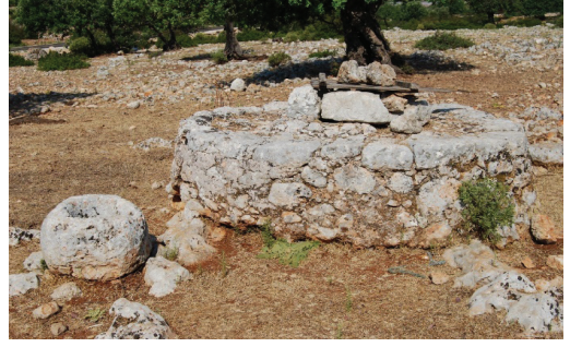
Görsel 21 ve 22. Kuyu Çeşitleri: Yer kuyusu ve Likyalılardan kalma kuyu