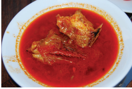
Görsel 15. Balık yemeği

Bölgede doğada kendiliğinden yetişen otların da mutfakta önemli bir yeri vardır. Kaş merkez ve yakın köylerinde baharda sarı ot , ilebada , körmen , ısırgan, ebegümeçi, kurşek , gelincik , deniz otu , acıbicik/ecibicik , kerdime gibi otlar toplanır. Otlar haşlanır, ekşili, sarımsaklı mezesi yapılır ya da az bulgurlu yemeği yapılır. Gelincik ve deniz otunun salatası ve turşusu olur. Kurşek , ısırgan, gelincik , acıbicik , körmen katmere, böreğe katılır.