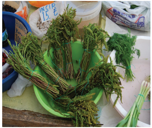
Görsel 13-14. Otlar

Kaş bölgesinin en yaygın yemekleri; fasulye, bulgur pilavı ve ayrandır. Bölgede et ihtiyacı için daha çok koyun-keçi kesilir. Düğünlerde ise tavuklu pirinç çorbası, et ya da nohutlu et, pilav, sarma, keşkek yapılır. Yaylanın fasulyesi meşhur olduğundan düğün yemeklerinde de fasulye, nohut yer alır.