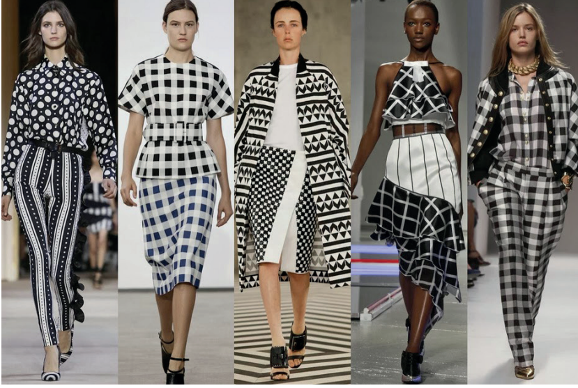
G. 8. 2014, Op Art Elbise Örnekleri

https://www.coolchicstylefashion.com/2014/01/fashion-inspiration-tendenze-per-la.html