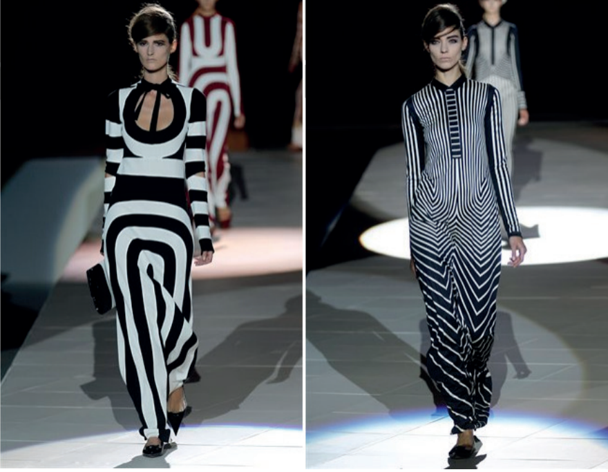
G. 6. (Solda), G. 7. (Sağda) 2013, Marc Jacobs, Elbise http://www.op-art.co.uk/2012/09/marc-jacobs-op-art-collection/

2014 Sonbahar Kış kreasyonunda Op Art ağırlıklı tasarımları ile dikkat çeken modacılar Derek Lam, Emanuel Ungaro, Edun, Rodarte ve Balmain, bu etkileyici formların etkisi ile izleyiciyi uzun süre etkisi altına almıştır (G. 8).