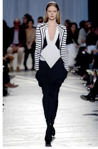
G. 6. 2010, Givenchyopart Ceket

https://irinairimia.wordpress.com/2009/10/05/377/