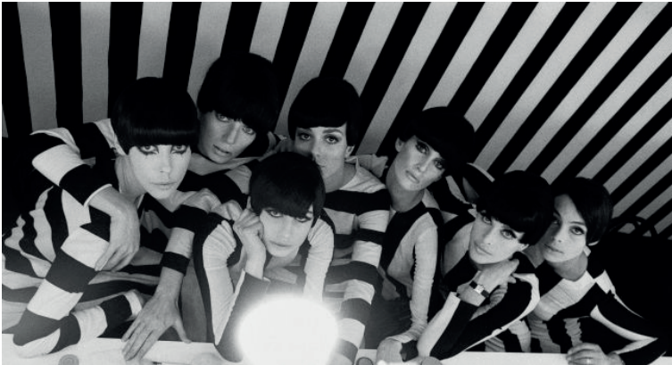
G. 4. 1966, Quietes-vous Polly Maggoo

https://www.ladepeche.fr/article/2016/04/20/2329215-monde-mode-retrouve-festival-hyeres-accueille-william-klein.html