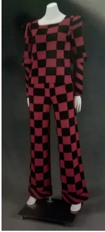
G. 5. 1967, Jarse Salon Giyisi Modanın Tarihi-1900'den Bugüne, 2013, s.243.

Genreich'in dikkat çekici tasarımı daha az tartışmaya yol açan cezbedici kolay giyiminin gölgesinde kalmış; yapısız dokuma jarse kalın renklerle ve Op Art modeliyle çağın modellerinden oldukça farklı bir üslupta sunulmuştur. 13 (G. 5).