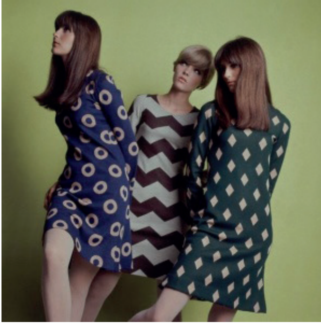
G. 3. 1966, Betsey Johnson, Modanın Tüm Öyküsü , 2014, s. 362.

Moda tasarımcısı Betsey Johnson da bu akımdan esinlenmiş ve 1966'da tasarladığı üç elbisenin geometrik desenlerinde, resimdeki göz yanıltıcı optik illüzyonları tanımlamak için kullanılan Op Art'a gönderme yapmıştır (G. 3). Op Art'ın tek renkli geometrik izleri, William Klein'ın 1966 filmi Quietes-vous Polly Maggoo 'da mod görünümünün cesur biçimlerini mükemmel bir şekilde tamamlanmıştır (G. 4).