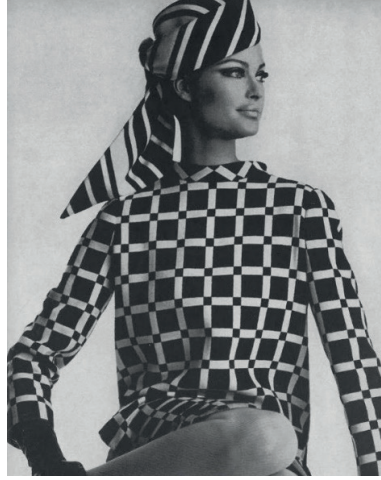
G. 1. 1967, Aldrich Tasarım Elbise

http://coutureallure.blogspot.com.tr/2012/03/weekend-eye-candy-larry-aldrich-1967