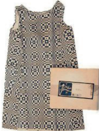
G. 2. 1966, Kâğıt Elbise

1965'te New York'taki Responsive Eye adlı sergide Bridget Riley ve Victor Vasarely'nin Op Art temalı eserleri oldukça dikkat çekmiştir. Bu dikkat çekiş ile aniden Op Art desenleri, giyimden reklâma, kırtasiyeden kumaşlara kadar her nesnenin üzerinde belirmeye başlamış ve 60'ların ikonik haline gelen Op Art sanatlı kâğıt elbisesiyle dönemine damga vurmuştur (G. 2).