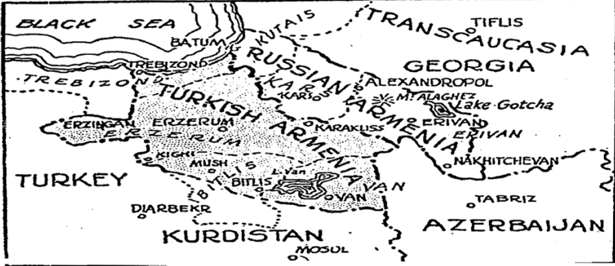
Kaynak: Chicago Daily Tribune, 31 Aralık 1922. "Prefer Turkey to Russia [(Ermeniler) Türkiye'yi Rusya'ya Tercih Ediyorlar]".

Başkan Harding'in Konferans'ın gidişatından memnun olduğunu ve Amerikan heyetinin faaliyetlerini tatmin edici bulduğunu açıklamasının 24 ardından, Ermenilerin kaderi konusunda Amerika'nın sessiz kalmamasını talep eden başyazılarda, "1920 Cumhuriyetçi Platformunda 'Ermenilerin durumunu anlayıp içten bir yakınlık duydukları ve uygun olacak her şekilde yardıma hazır olduklarının' ilan edildiği, Başkan Harding'in seçim sonrası henüz göreve başlamadan o günkü Başkan Wilson'a İtilaf devletlerini Türklerin taleplerine boyun eğip Ermenilere ihanet etmekle suçlayan sert bir protesto notası gönderdiği" hatırlatılıyor; "bugün Hristiyanlar Türkiye'den tamamen silinmeye çalışılırken ABD'nin neden sessiz kaldığı" sorgulanıyor; "eğer söylenen sözlerin arkası getirilemeyecekse ciddi bir protesto yapılmasının anlamsız olduğunu savunanlar bulunduğu" dikkat çekiliyor; "ancak savaş dışında da protesto yöntemleri olduğundan bahisle, Milletler Cemiyeti Sözleşmesi'nde belirtildiği üzere ekonomik boykot benzeri yollara başvurulabileceği, Türklerin haksızlıklarına karşı Amerikan halkından gelen ahlaki temelli itirazların göz önüne alınması gerektiği, Türklerin doğaları gereği ABD yönetiminden gelecek sert ve doğrudan açıklamaları göz ardı edemeyeceği" kaydediliyordu. 25