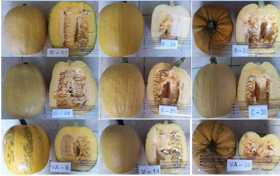
Şekil 1. Denemede kullanılan hatların meyve görünüşleri