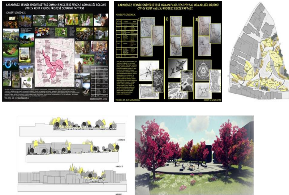
Şekil 3. Semina Aktaş'ın Tasarım süreci (senaryo paftası, eskiz öneri paftası, sonuç ürün, kesit-görünümler, render) (Figure 3. Design process of Semina Aktaş (scenario sheet, sketch sheet, result product, section-views, render))

Öğrenci çalışmasında ana etkinlik ve konseptini "Dinginlik" olarak belirlemiştir. Sorun önerisi olarak alanda gençlerin etkinlik alanlarının bulunmaması ve onlar için mekân yaratma endişesi ile çalışması gerçekleştirmiştir. Bu amaçla daha çok genç kullanıcılara yönelik konser ve açık hava sinemaları için yeşil alanlar, dinlenmek, oturmak ve uzanmak amacıyla hamaklar ve salıncaklar, kitap okuma gibi sosyalleşme mekânlarına ağırlık vermiştir. Konseptine uygun ihtiyaç-aktivite-mekân ilişkisini kurgulayıp yaratıcı seçenekler üretmiş, birini seçmiş ve geliştirmiştir.