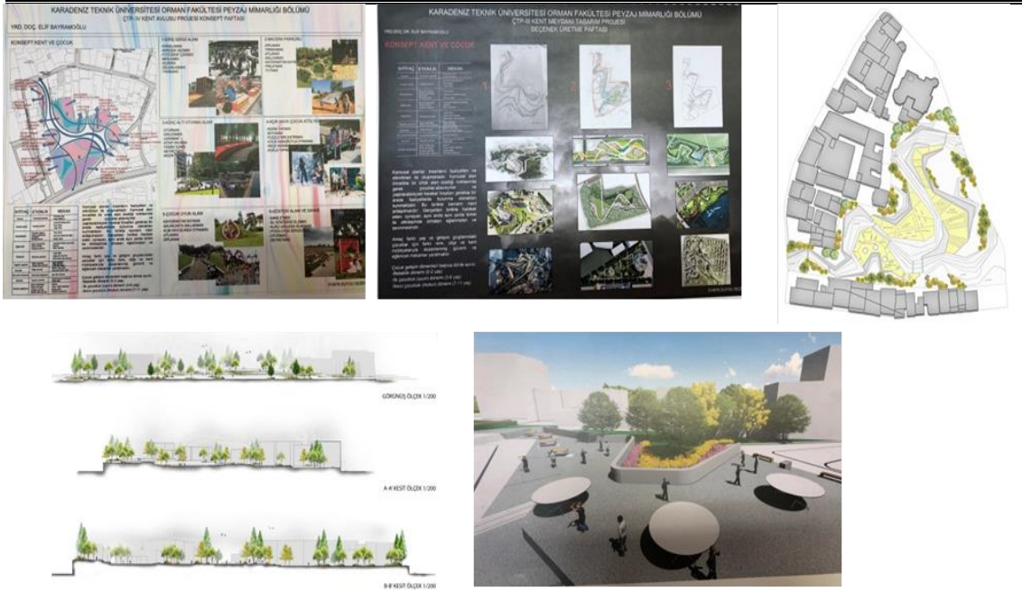
Şekil 4. Duygu Sezen'nin tasarım süreci (senaryo paftası, eskiz öneri paftası, sonuç ürün, kesit-görünüşler, rander) (Figure 4. Design process of Semina Aktaş (scenario sheet, sketch sheet, result product, section-views, rander))

3. çalışmada öğrenci kent meydanı konulu proje çalışmasında konseptini "Dostluk ve Sevgi" olarak belirlemiştir. Yapmış olduğu gözlemler sonucu kent halkının stresli ve yoğun tempolarından arınabilecekleri arkadaşları ve dostları ile vakit geçirebilecekleri kent içerisinde mekan olmayışını sorun olarak belirlemiştir. Bu soruna yönelik çözüm önerileri geliştirmiştir. Belirlediği ihtiyaçları hangi tür mekanlarda yapabileceğine dair örnekler toplamış ve kendi tasarımına uygun hale getirmiştir. Öğrenci kullanıcı ihtiyaçlarını dost olma-dostluk kazanmak, kendini geliştirmek, yürüme, yemek yeme, sosyalleşme, uyuma, dans etme, ders çalışma, eğlenme, dinlenme ve sağlıklı yaşam olanağı bulmak gibi etkinlikler olarak belirlemiş ve konsepti değerlendirmiştir. Bu amaçla kent halkının daha çok birlikte vakit geçirmelerini amaçlayan uzanmak, sohbet etmek, kaykay yapma, sallanma, izlemek, sokak sanatçılarını izlemek, sergilemek, dinleti alanları, müzik aletleri çalma gibi etkinlik mekanları oluşturmuştur. Belirlediği bu etkinliklere yönelik mekanlar tasarlamıştır.