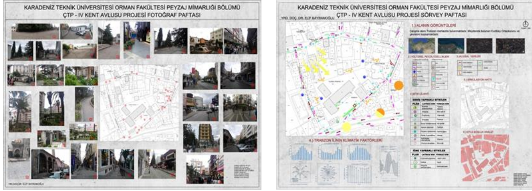
Şekil 2. Proje çalışma alanlarının sörvey, analiz ve fotoğraf paftaları

Peyzaj mimarlığı öğrencilerinin ilk projeleri öğrencilerin daha çok yaratıcılıklarını geliştirdiği proje anlayışı ile işlenirken ileri proje dersleri uygulamaya yakın ve ayakları yere basan projelerden oluşmaktadır. Bu nedenle IV. Proje olması nedeniyle belirlenen probleme ve sorunlara yönelik çözümlerin net olarak giderilmesi beklenmektedir. Dönem boyunca uygulanan proje tasarım süreci aşağıdaki gibidir. Bu kapsamda öğrencilerden 1-2. Haftada çalışma konusu, amacı ve kapsamında bilgi verilip arazi çalışması yapmaları beklenir. Öğrenciler grup olarak çalıştıkları alana giderler, alandaki bütün peyzaj elemanlarını fotoğraflayarak kayıt ederler. 2. Hafta sonunda ise sörvey analizleri ve fotoğraf paftalarını grup olarak dersin sorumlu hocasına sunarlar.