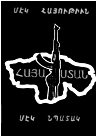
Şekil 7 ASALA'nın profil resmi

Yukarıda incelediğimiz grupların dışında Facebook’taki bazı Ermeni grupların doğrudan terör ve nefreti destekledikleri görülmektedir. Bu tür gruplar arasında öncelikle ASALA 52 dikkat çekmektedir. ASALA 1973 – 1986 yılları arasında meydana gelmiş toplam 699 Ermeni terör olayının 581’ini gerçekleştirdiği için en büyük Ermeni terör örgütü olarak değerlendirilir. 53 Böyle bir kimliğe sahip olan ASALA’nın Facebook’ta üye sayısı 180 civarındadır ve diğer gruplara göre (Ermenistan/Ermeni adında kurulmuş gruplara göre) daha az üyeye sahiptir. Grubun duvarındaki yazılar incelendiğinde belirli birkaç kişinin düşüncelerini yazdığı görülmektedir. Yazılanlar genelde Türkiye/Türk karşıtı sözlerdir. ASALA’nın mücadelesinin ne için ve nasıl olduğunu aşağıda verilen resim açıklamaktadır.