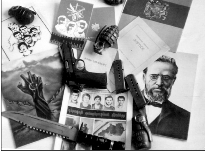
Şekil 3 “Armenian Revolutionary Federation” adlı grubun duvarında paylaşılan resim

Resimlerin silah, bomba ve bıçak içermesi, “Büyük Ermenistan” haritaları, Ermenistan bayrağı, Taşnaksutyun’un logosu ve Ermeni fedailerin resimleri dikkat çekmektedir. Kanlı bir elin üstündeki ay yıldız resmi doğrudan Türkiye’ye gönderme yapmaktadır.