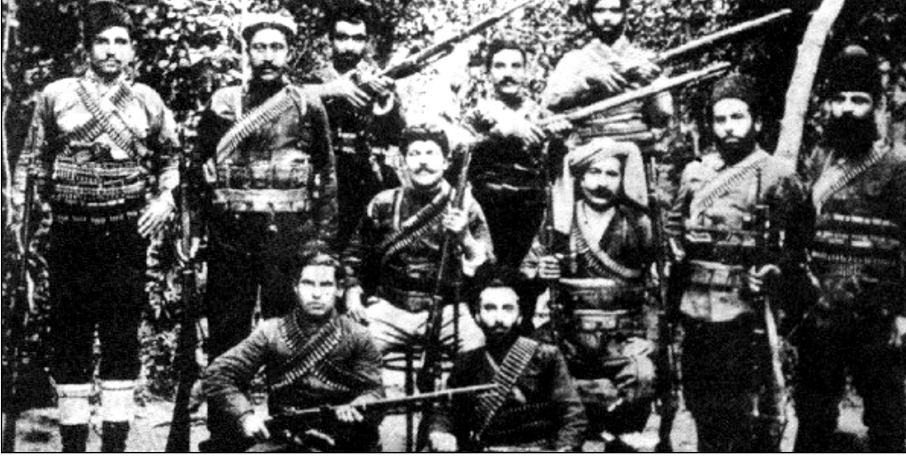
Şekil 4 “Armenian Revolutionary Federation” adlı grubun duvarında paylaşılan resim.

Resimlerin silah, bomba ve bıçak içermesi, “Büyük Ermenistan” haritaları, Ermenistan bayrağı, Taşnaksutyun’un logosu ve Ermeni fedailerin resimleri dikkat çekmektedir. Kanlı bir elin üstündeki ay yıldız resmi doğrudan Türkiye’ye gönderme yapmaktadır.