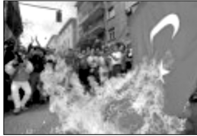
Şekil 6 “Armenian Revolutionary Federation” adlı grubun paylaştığı resim.

Resmin üstünde “Er ya da Geç”, resmin altında “Ermeni soykırımı kabul edilecek” yazmaktadır. “Ok” içerdiği renklerle Ermenistan’ı simgelemekte, “12”den vurulan ise Türkiye’yi (Türk bayrağını) temsil etmektedir. Ermenilerin internet üzerinde bu tür propaganda afişlerini sunmak için sponsorlar aracılığı ile özel siteler kurdukları da görülmektedir. 43