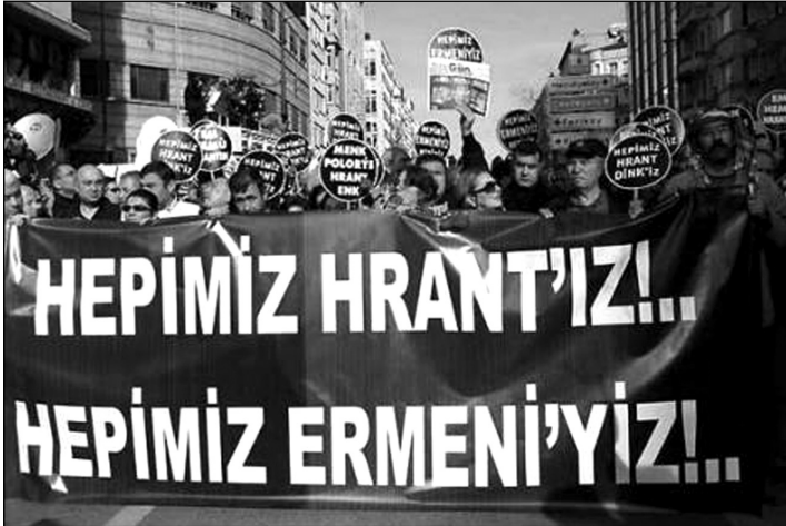
Şekil 2 "RECOGNIZE THE ARMENIAN GENOCIDE" adlı grubun profil resmi

Sayınca en fazla üyeye sahip olan "Recognize the Armenian Genocide" adlı gruptan sonra doğrudan siyasetle ilişkisi olan Ermeni Devrimci Federasyonu'nun İngilizce ve Ermenice ismiyle kurulmuş gruplarını değerlendirebiliriz. 39 Ermeni Devrimci Federasyonu 1890'da Tiflis'te kurulmuştur. "Hınçakların sol ideolojiyi benimsemelerine rağmen Taşnaklar aşırı sağcıdır. Örgütün amacı isyan yoluyla "Türkiye Ermenistan'ı" için siyasi ve ekonomik özgürlük elde etmektir." 40 Kısaca tarihî amaçları bu şekilde olan grubun (Հայ Յեղափոխական Դաշնակցություն) sanal ortamda üye sayısı 288'dir. Grubun duvarında Ermeni " fedai " 41 leri gösteren videolar bulunmaktadır ama yazı/yorum bulunmamaktadır. Grup 18 adet resim paylaşmaktadır. İngilizce ismiyle kurulmuş grubun üye sayısı 2,461'dir. Bu grup 500 civarında görsel paylaşmaktadır. Aşağıda paylaşılan görsellerden örnekler sunulmuştur.