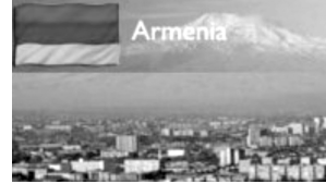
"Armenia", "Hayastan – Armenia" ve "Hayasdan" adlı grupların profil resimleri