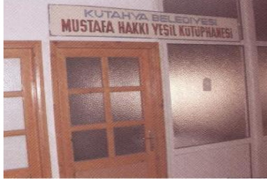
Mustafa Hakkı Yeşil Kütüphanesi

Yapacak olduğumuz çalışmada, sadece künye niteliğinde bir bibliyografyadan ziyade, Osmanlı Türkçesi ile yazılmış eserleri tanıtmak amacıyla, daha ayrıntılı bilgi veren katalog çalışması yapılmaktadır. Osmanlı Türkçesi ile yazılmış katalog çalışmalarına örnek olabilecek Amnon Schilolah'ın 1979'da yapmış olduğu "The Theory of Music in Arabic Writings" sisteminden yararlanılacaktır. Bunun yanı sıra Schilolah'ın sisteminden farklı olarak, daha anlaşılır olabilmesi adına çalışmada matbu ve el yazması eserlere iki ayrı bölümde yer verilecektir. Nedeni ise; günümüzde zor bulunan, bulunduğu zaman ise tek örneği olan el yazması eserlerinin bir arada toplanarak kolay ulaşılabilir olmasıdır.