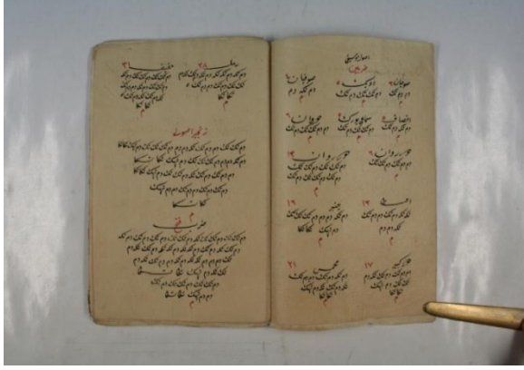
El yazması Eserlerden Bir Örnek: Usul-ü Musiki ve Şarkılar