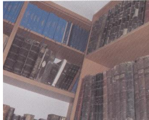
Kitaplarından Bir Görüntü