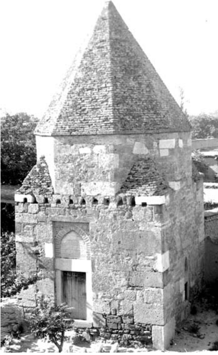
Resim 2. Kuzey cephe.

Türbe dıştan sade bir görünüme sahiptir (Resim 2-3). Kuzey cephedeki kapı ile doğu, batı ve güney cephelerdeki pencereler benzer düzenleme yansıtır. Lentolu ve söveli dikdörtgen biçimli kapının üzerinde dikdörtgen çerçeveli sivri kemerli alınlık, pencerelerin üzerinde ise sivri kemerli pencereler bulunur. Kapının alınlığı kitabe levhası olarak değerlendirilmiştir. Altta dikdörtgen, üstte sivri kemerli/ çift katlı pencere kurgusu dıştan kademeli dikdörtgen çerçeve ile kuşatılır. Pencere yükseklikleri altta 0,67-0,80 m, üstte 0,43-0,54 m arasında değişmektedir. Kapı ve pencerelerin kemer köşelikleri bezemelidir.