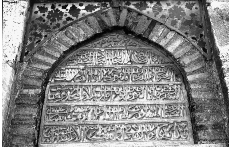
Resim 8. Kitabelik.