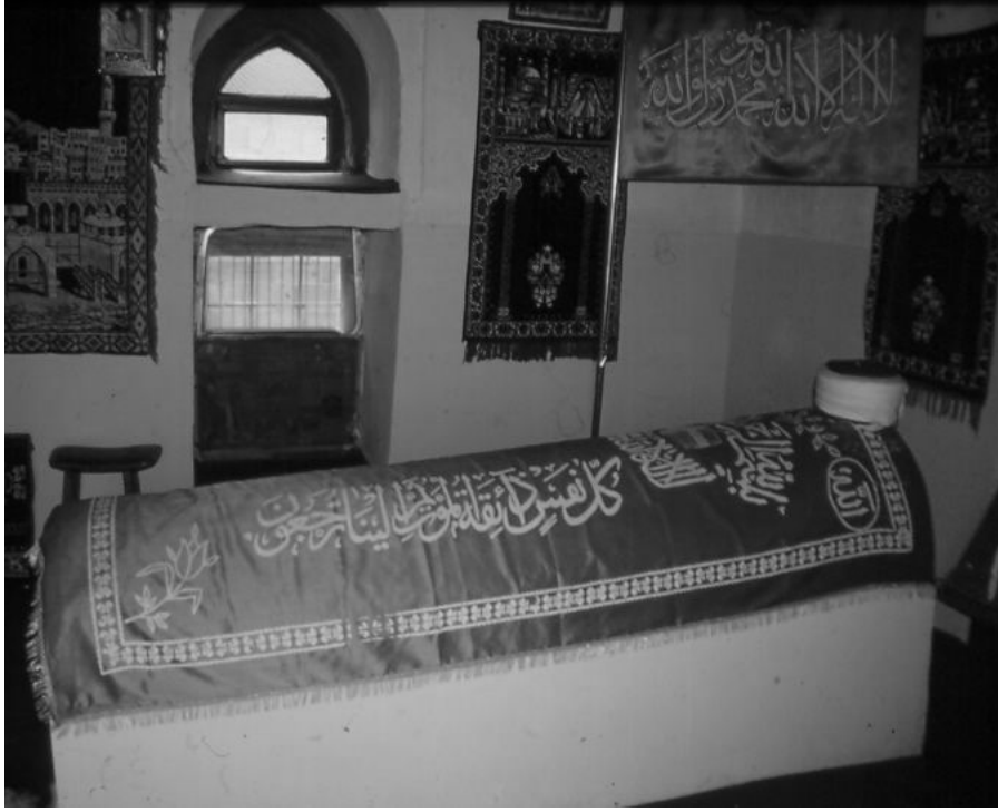
Resim 4. Türbe içten görünüm, sanduka.

Türbeye girildiğinde kapı ve pencerelerin dışta olduğu gibi içe yansıdığı görülür. Kapının üzerinde içte sivri kemerli bir niş vardır. Türbenin içinde Burhaneddin Fakih'e ait bir sanduka bulunur (Resim 4). Sandukanın baş şahidesinde bulunan kitabe basık kemerli alınlıklı bir yüzeye yazılmıştır (Resim 5).