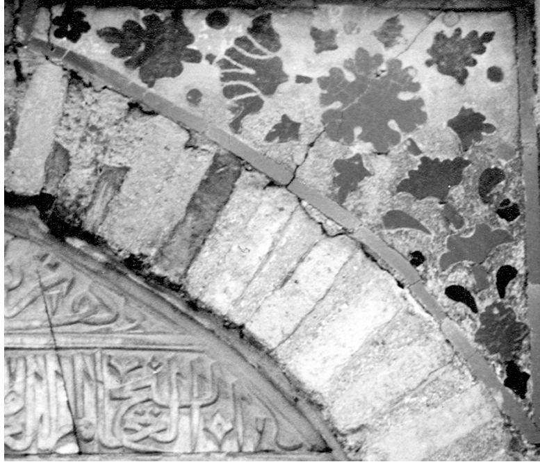
Resim 9. Kitabelik, kemer köşeliği.

Köşeliğin merkezini üstten görünömlü altı dilimli yapraklı şakayık motifi belirler. Ayrıca kemer kilit taşında tahrip olduđu için sadece bir bölümü algılanan düğüm motifi yer alır.