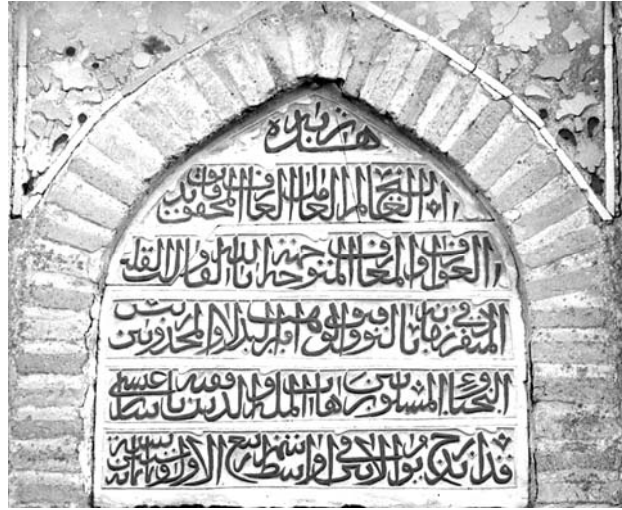
Resim 1. Konya Fakih Dede Türbesi, kitabe (Mevlana Müzesi Arşivi, 1941).

Konya Fakih Dede Türbesi'nin kuzey cephesinde eksenden batıya kaymış olan kapısının üzerindeki dikdörtgen çerçeveli sivri kemerli alınlığın yüzeyinde inşa kitabesi yer alır (Resim 1). Mermer üzerine sülüsle yazılmış altı satırlık inşa kitabesine göre yapı 860 H./ 1456 M. yılında İsa oğlu Şeyh Fakih Paşa için yaptırılmıştır (Löytved, 1907, pp. 84; Diez-Aslanapa ve Koman, 1950, ss. 136-138; Önder, 1962, ss. 180-181; Konyalı, 1964, s. 593; Türkmen, 1989, s.120).