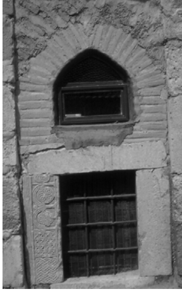
Resim 6. Güney cephe, pencere.