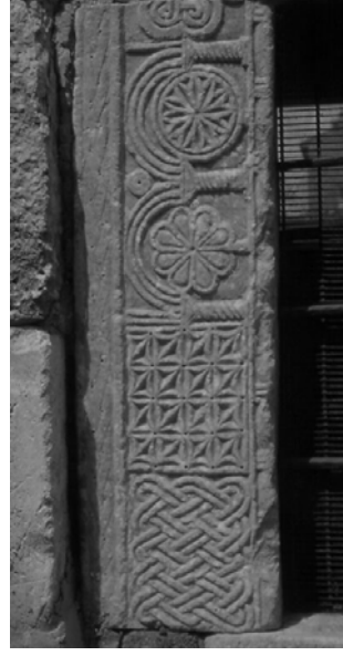
Resim 7. Güney cephe, pencere, devşirme malzeme, ayrıntı.

Tuğla kapı ve pencere kemerleri ile içte kubbe, dışta külahta kullanılmıştır (Resim 2-3, 6). Ayrıca kapının üzerindeki kitabenin kemer köşeliğini firuze renkli sırlı tuğlalar sınırlar.