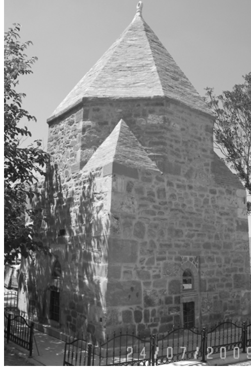
Resim 3. Güney ve doğu cepheler.

Yapının cephe köşeleri üst seviyede üçgen biçimli pahlanarak sekizgene dönüşmüş ve sekizgen pramidal külahla örtülmüştür. Türbede 2003 yılı onarımları öncesinde, kuzey/ön cephede, kübik gövdenin bitiminde yatay olarak dizilen on bir hatıl yuvası dikkatî çeker. Hatıl yuvalarının yalnızca türbenin