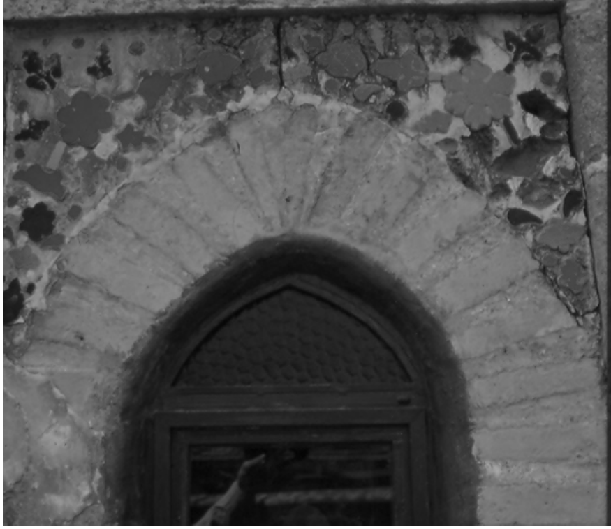
Resim 11. Batı cephe, pencere, ayrıntı.