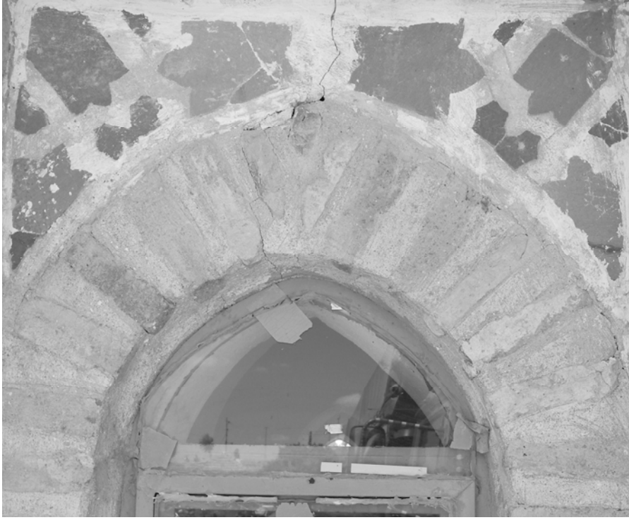
Resim 10. Doğu cephe, pencere, ayrıntı.

Doğudaki pencerenin kemer köşeliğindeki firuze renkli çiniler düzgün olmayan (üçgen çıkıntılı dörtgen ve üçgenler) geometrik biçimlerde kesilerek daha özensiz bir teknikle uygulanmıştır (Resim 10). Batıdaki pencere kemer köşeliğinde ise firuze ve patlıcan moru çinilerle şakayık motifinin yandan ve üstten kesitleri sunulmuştur (Resim 11). Bu pencere süslemeleri açısından kitabenin köşeliği ile benzerlik yansıtır. Özellikle köşeliklerin merkezi üstten görünümlü şakayık ve altı yapraklı çiçekle vurgulanır. Bu örnekte bazı çinilerin düşmüş olması sıva üzerine yerleştirilen çiniler hakkında bilgi verir. Güneydeki pencere kemer köşeliğinde bulunan çiniler tümüyle dökülmüştür (Resim 6).