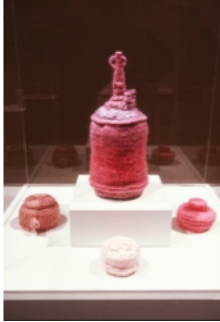
Resim: 6- “Antipersonnel (Bomba/Mayın)”, Detay.

Çalışmalarını pembe renkli iplikle gerçekleştiren Hunt, insan bedeninin korunmasıyla örgünün yakın bir ilişkisi olduğunu belirtmektedir. Asker berelerinin bir zamanlar örgüden yapıldığını, kadınların hala asker ve evsizler için çorap ördüklerini söylemektedir. Örgünün; bakımı, korumayı ve iyileştirmeyi temsil ettiğini belirten sanatçı; örgünün bu yönünü gücün kötüye kullanılması ve yıkıcı bir cismin zarar vermeyecek şekle dönüştürerek ilişkilendirdiğini belirterek savaşlara karşı olduğunu göstermektedir. Hunt, çalışmalarında pembe rengin kullanılmasını;