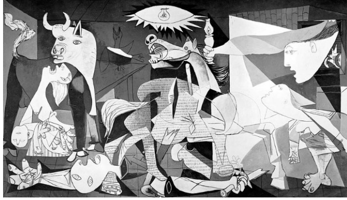
Resim: 3- Pablo Picasso, “Guernica”, Tuval üzerine yağlı boya, 3,5 x 7,8 cm, 1937.

20. yüzyılın sonlarına gelindiğinde, özellikle 1960’lardan sonra birçok plastik sanat alanında savaş teması sanatçıların konusu olmuştur. Sanatçılar, bu temayı, kişisel deneyimleri ve içerisinde taşıdıkları politik anlamlar ile birlikte kullanarak, karşı-sanat fikrinin öncüleri olarak sanat tarihinde yer edinmişlerdir.