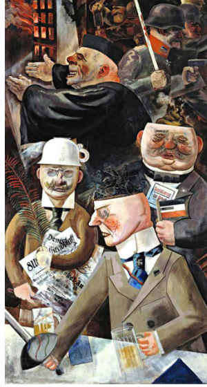
Resim: 2- George Grosz, “Toplumun Temel Direkleri”, Tuval Üzerine Yağlıboya, 200 x 108 cm, 1926.

Yine aynı şekilde 20. yüzyıl resim sanatının şekillenmesinde önemli rol oynayan savaş teması, dada akımının ortaya çıkmasına da neden olmuştur. Dadaizm;1. Dünya savaşı sırasında İsviçre’de ünlü düşünür ve şair Hugo Ball tarafından Voltaire Caberet adıyla ortaya çıkmış toplumsal bir harekettir (Çeken, Akengin ve Arslan, 2017, s.50). Bu hareketin Almanya’daki güçlü temsilcilerinden olan George Grosz (1893-1959) savaşa en başından karşı çıkmıştır. Grosz’un, Toplumun Temel Direkleri (Resim 2) adlı karışıt yapıtı dikkat çekici örneklerden birini temsil etmektedir.