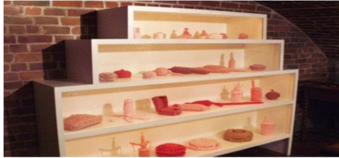
antipersonnel knitted yarns variable dimensions 2001

Hunt, 1998’de Kanada Konseyi tarafından Paris’e örme hakkında araştırma yapmak için gönderilmiştir. Seyahati sırasında The Pyramid of Shoes adlı sergiden çok etkilenmiştir; çünkü sergi, tamamen arazilere döşenen mayınları protesto etmek amacı ile açılmıştır. Hunt, bu sergiden sonra savaşlara karşı çıkmak için örme tekniği kullanılarak yapılmış silahları ve savaşlarda kullanılan diğer malzemeleri kaynak olarak ele almıştır. Sanatçı yaptığı çalışmaları; “ Bazı insanlar benim askeriyeye karşı olduğumu sanıyor. Hayır, ben Askeriye’ye değil, savaşlara ve savaşlarda kullanılan korkunç silahlara karşıyım. ” şeklinde değerlendirmektedir (Searle, 1989, s.141).