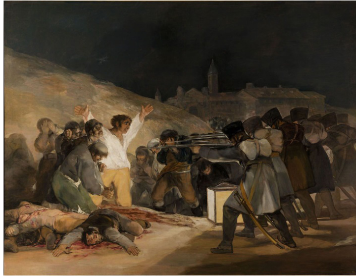
Resim:1- Francisco de Goya, “3 Mayıs 1808”, Tuval üzerine yağlı boya, 268 x 347 cm, 1814.

Savaştan bunalmış ve çokça yara almış savaş karşıtı sanatçılar, kalıcı eserler vermişlerdir. Bu anlamda; Goya'nın 3 Mayıs 1808 (Resim 1) adlı eseri ile birlikte Batı sanatında oldukça ciddi bir kırılma yaşanmıştır. Nitekim İspanyol resim sanatının başyapıtlarından biri olarak kabul edilen eser, Sanat Tarihçisi Kenneth Clark tarafından: “ Tarz, konu ve işlem olarak kelimenin tam manası ile devrim sayılabilecek ilk büyük resim ” olarak değerlendirilmiştir (Aktaran: Arslan ve Karaaslan, 2016, s. 49),