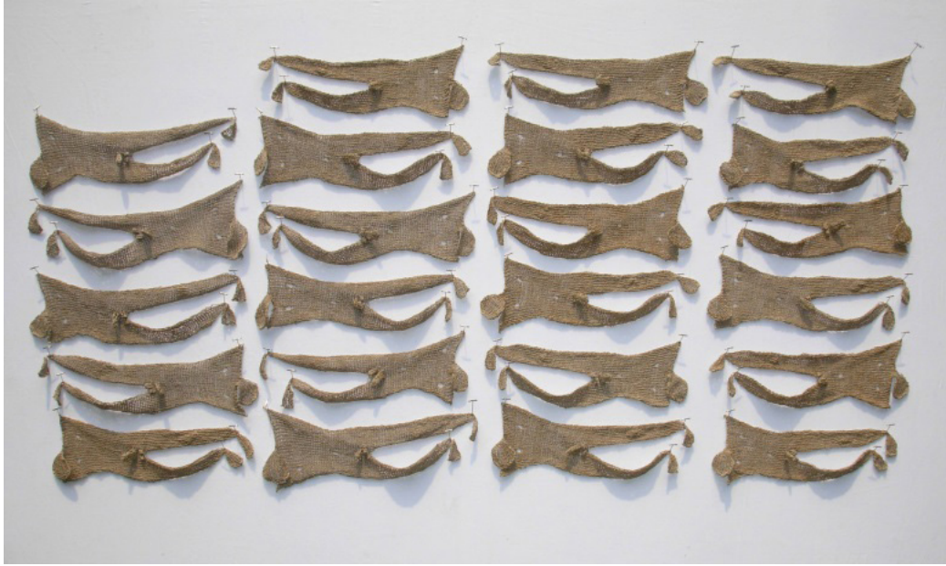
Resim: 7- Adrienne Sloane, “Cost of War (Savaşın Maliyeti)”, Makine Örne Tekniği, 30 cm x 62cm, 2006.