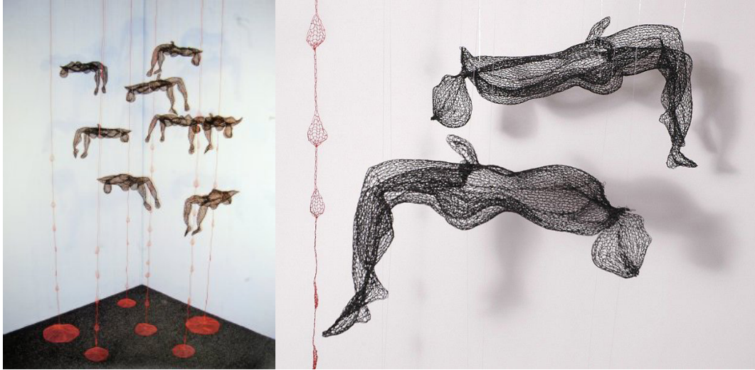
Resim: 8- Adrienne Sloane, “Truth to Power (Gücün Gerçeği)”, Makine Örne Tekniği, 62 x 24 x 36cm, 2007.