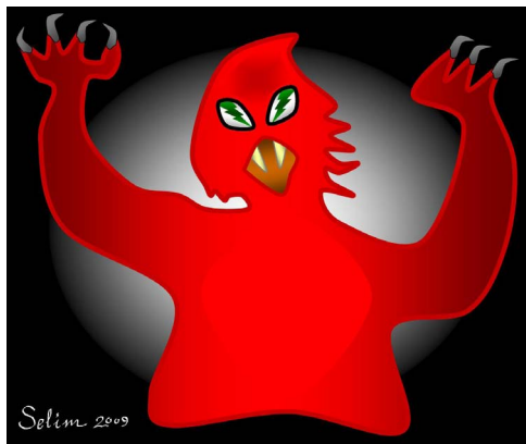
Resim 1. Albasması imgesi (Dr. Selim Kadioğlu kompozisyonu)

Albasması lohusa kadının kâbusu olarak da nitelendirilmektedir 6 . Kırkı çıkmamış bebeğin yanına adetli bir kadının gelmesi ve bebeğe bakması durumunda bebeği de albasacağına, vücudunun göz göz yara olacağına inanılmaktadır. Albasmasına ilacın fayda etmediği düşünülmektedir 9 . Alkarısının ahır, samanlık, viraneler, nehir kenarları, çeşme ve kaynak başlarında bulunduğu ve atlarla, lohusa kadın ve çocuklarına musallat olduğuna inanılmaktadır. Çukurova'da bu konuda çeşitli efsanelere rastlanmaktadır 5 .