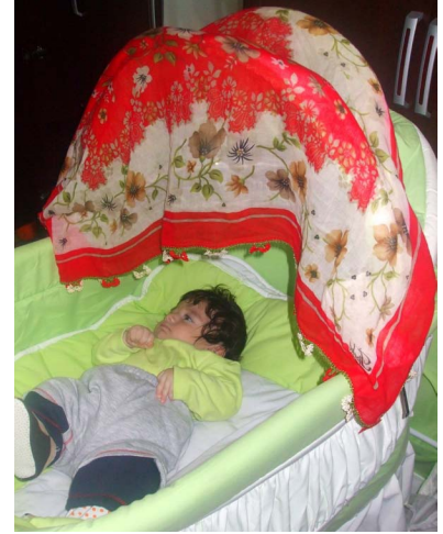
Resim 3. Albasmasından korunmak için kırmızı örtü kullanılması

Kadın sağlığının korunması ve geliştirilmesinde ebeler/hemşirelerin önemli sorumlulukları vardır. Özellikle doğurganlıkla ilgili sorunların önlenmesinde gebelik, doğum ve doğum sonu dönemde ebeler/hemşireler tarafından verilen bakım oldukça önemlidir. Ebe/hemşirelerin bu dönemlerde sundukları bakımın etkili ve gereksinime uygun olması için kadının içinde yaşadığı çevre ve bu çevrenin özellikleri ile bir bütün olarak ele alınması ve değerlendirilmesi önemli bir noktadır 18 . Temel hasta bakımı kaynaklarında "Bütüncül Bakım" olarak adlandırılan bu bakım felsefesinde kültürel faktörlerin bilinmesi ve kullanılması önemlidir 19,20 . Albasmasına yönelik yapılan uygulamaların sağlık açısından doğrudan bir zarar vermediği, aksine kadının yalnız bırakılmaması ile sosyal destek sağlandığı görülmektedir. Sağlık hizmeti sunumundan önce hizmet sunulacak birey aile ve toplumun bu konudaki tutum davranış ve uygulamalarının bilinmesi birçok açıdan olduğu gibi hizmetin etkinliğinin artırılması açısından da önemlidir 21 . Sağlık çalışanları geleneksel uygulamalardan zararlı ve gecikmelere neden olanlar konusunda eğitim vermeli ve bireyleri uyarmalıdır. Yararlı geleneksel davranışları ise desteklemelidir.