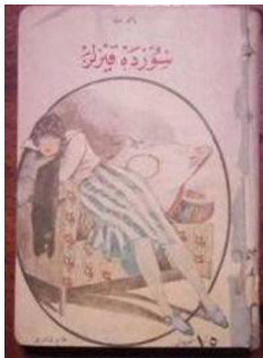
Resim 1. Sözde Kızlar

İstanbul'un ahlaki çöküntüye uğramış kısmı bu şekilde anlatılırken, bir taraftan da Anadolu'yu temsil