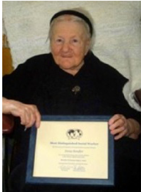
Şekil 8. Irena Sendler "Beyaz Kartal Nişanı" ile. 10 Kasım 2003