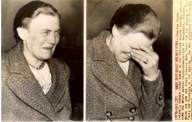
Şekil 4. 400 mahkûmun öldürülmesi ile suçlanan Irmgard Huber

az 120 cinayetten suçlu bulunmuştur. İkinci mahkemede Huber'in öldürülecek hastaları seçip diğer hemşirelere verdiği kanıtlanmış, ölüm cezasına çarptırılrsa da hastalığı yüzünden cezası hapis cezasına çevrilmiştir. Irmgard Huber, eylemlerinin soğuk savaşın siyasi baskıları ile olduğu kanısına varılarak, 1952'de serbest bırakılmıştır. Sonra tekrar profesyonel hemşirelik yapıp yapmadığı bilinmemektedir. Irmgard Huber 83 yaşında ölünceye kadar eylemlerini gerçekleştirdiği Hadamar'da yaşamıştır. 5,15,19-20