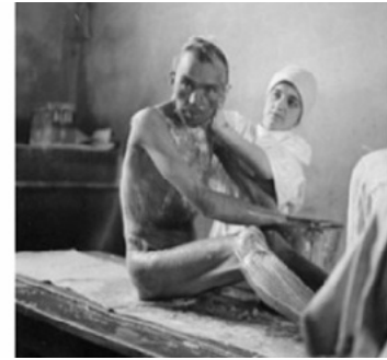
Şekil 6. Nazi hemşireleri toplama kamplarındaki mağdurlara yardım ederken