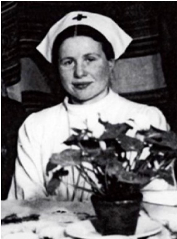
Şekil 7. Irena Sendler'in hemşire kıyafetinde Getto'ya girdiği zamanlardan

Ne yazık ki Naziler Sendler'in bu yeraltı çalışmalarını öğrenmiş ve 20 Ekim 1943'de tutuklamışlardır. Pawiak Cezaevinde üç ay boyunca işkenceye maruz kalan Sendler tüm bunlara rağmen arkadaşlarıyla