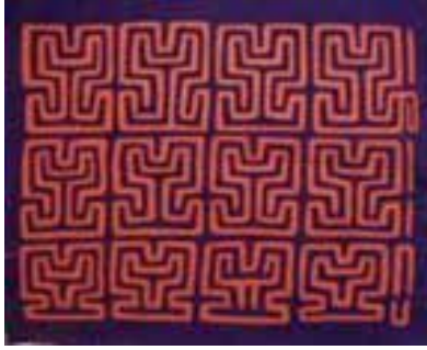
Görsel 11. İki renkli mola 'mugan'