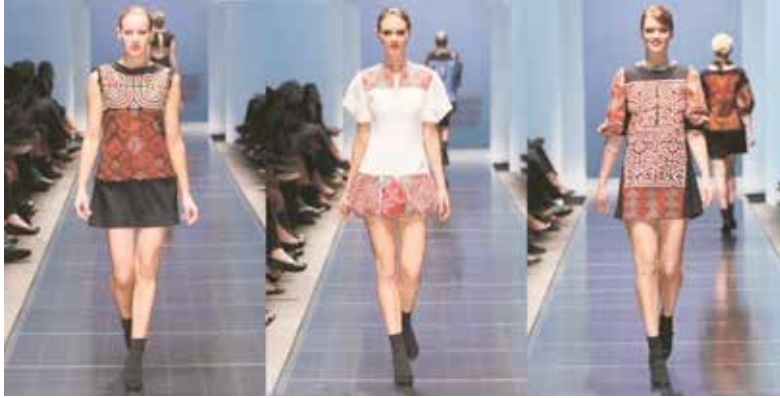
Görsel 20. Ameli Toro, 2011 İlkbahar/yaz koleksiyonu

Moda dünyasına yepyeni giysi ve kumaş tasarımları kazandıran modacı Ameli Toro, ilk kez 2011 yazı için kullandığı, karmaşık desenlerle kesilmiş çok sayıda kumaş tabakasından oluşan ve ters bir applike türü olarak düşünülen molaları dünya podyumlarına taşımıştır (Görsel 20). Kuna kadınının geleneksel kıyafetleri ve mola aplikeleri dönem dönem tasarımlarının dayanak noktası olmuştur.