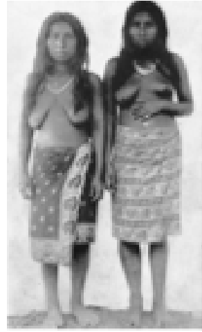
Görsel 1. Kuna yerli halkı vücut boyaması Görsel 2. Kuna kadınları