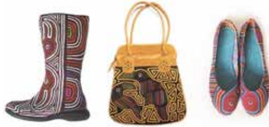
Görsel 25. Mola kullanılmış çanta, çizme ve babet örnekleri

Kuna yerli halkı tarafından üretilen renkli mola aplikeler, kendine özgü bir tekstil tasarım ürünü biçimidir ve bu özgün yaratıya sahip tekstiller sadece giysi koleksiyonlarında değil, tamamlayıcı bir unsur olan ve kadınlar tarafından da her zaman büyük ilgi gören, el yapımı çanta, ayakkabı ve cüzdan gibi çeşitli aksesuarlara da dahil edilmiştir (Görsel 25). Tasarımcı Yasmin Sabet'in 2016 ilkbahar/yaz koleksiyonu için hazırladığı çanta koleksiyonu Kuna, yerli halkına ait geleneksel mola tekniğini renk ve desenleriyle ön plana çıkartmıştır (Görsel 26).