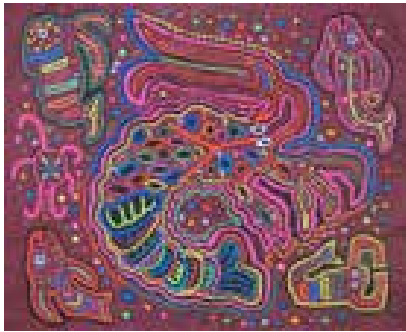
Görsel 13. Merkezi ana figürlü mola örneği

Kuna tasarım düzeni, boşlukların tamamen doldurulması, ince detayları tekrarlama, asimetri, görünürlük, karmaşıklık ve ilgi çekici bir konuyu içeren desenler, teknik sürecin ustaca yönetilmesine ve işin içeriğine dayanır (Bartra, 2003, s. 60). Kuna görsel düzenleme kavramları, desenlerin genel olarak iki yönlü dengelenmesi ve tüm alanların doldurulmasının gerekliliğini önermektedir. Bir mola applike parçasının sağ ve sol yanları az ya da çok simetriktir. Merkezi ana figürler, çevresinde dengeli dağılım ve arka plandaki dolgu elemanları birleşerek dikkat çekici bir desen oluşturur (Görsel 13). İncelenen görseller dikkate alındığında mola applike parçalarının genelde dikey eksene veya çeyrek parçalara ayrılmış olduğu gözlenmiştir. Desenler genellikle Kuna için ritüel sayılar olan dört veya sekizli kümeler halinde görülür (Görsel 14). İlk bakışta molalar sıklıkla simetrik görünse de, kadınlar aşında desenin şekli, dış çizgilerin rengi veya dolgu motiflerindeki değişimle asimetriyi vurgularlar (Görsel 15). Tekrarlar mola desenlerinde önemli bir unsur oluşturmaktadır. Soyut desenler, üçgen, daire gibi geometrik desenler ve kesikler boşlukları doldurmak üzere tekrarlanır.