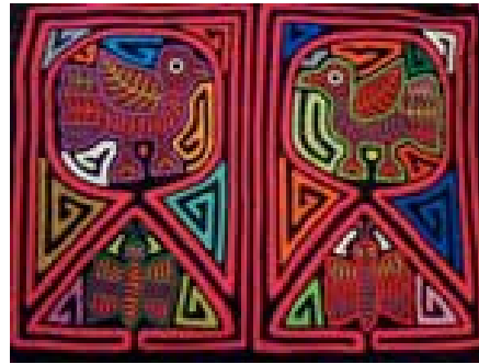
Görsel 14. Dörtlü kümeleneşmiş mola örneği