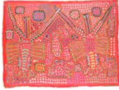
Görsel 15. Simetrik görünmesine karşın renk ve dolgu motiflerindeki farklılık asimetrik görünümü vurgular

Desenlerin kaynakları yaratıcının hayal gücünden, doğasından, kültürel veya dini geleneklerinden ve dış dünyadan alınır ve birçok tasarım mizah ve ironi unsurlarıyla bezelidir. (Deacon, 2014, s. 118). 1920'den günümüze koleksiyonlarda, en basit geometrik çizgilerden, hareket, gerçekçilik ve perspektif içeren ilgi çekici karmaşık resimsel desenlere kadar dikkate değer bir dizi motifin yer aldığı görülmektedir (Bartra, 2003, s. 61). Bartra'nın (2003, s. 61) belirtildiği gibi, bugün yapılan pek çok mola da ilk dönem kullanılan desenler tekrar kullanılmaktadır. İlk dönem kullanılan bu desenlere "sergan" denmektedir. Sergan, deseni ifade eder ve "eski" ya da "geçmişten kalan" anlamına gelmektedir. Kısmen tropik bölgelerde, pamuklu kumaşların iklim şartlarına bağlı olarak bozulmasından dolayı ve bir kadın genellikle molası ile birlikte gömüldüğünden, Kuna Yala'da çok az sayıda eski mola örnekleri ele geçmiştir. Bu da ilk dönem ve sonrasına ait mola teknik ve desen örneklerinin sınırlı olmasına, çağdaş molalarla karşılaştırma imkanının kısıtlanmasına neden olmaktadır.