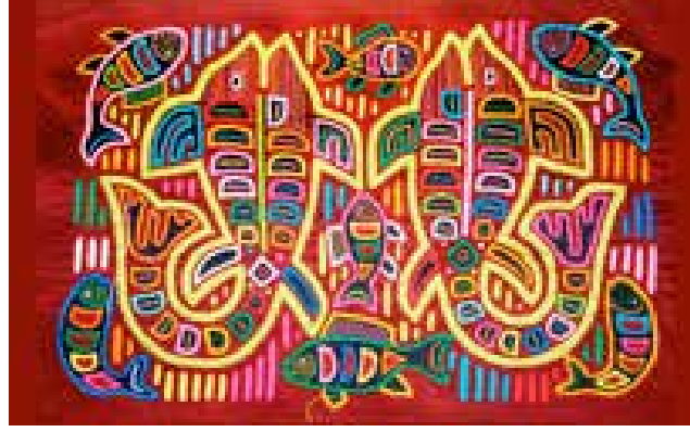
Görsel 10. Parlak renklere sahip mola örneği

Bir mola yapmak için, kaliteli ve parlak, pamuklu, dikdörtgen kumaşa ihtiyaç vardır. Genellikle çok parlak kırmızı, sıcak turuncu ya da siyah renkli kumaş kullanılır. Kullanılan baskın renkler kırmızı, mavi, sarı, turuncu ve beyazdır. Kontrastlık önemlidir, aynı rengin tonları birbirinin üstünde yer almaz. Mavi ve yeşil gibi yakın aralıktaki renkler aynı kabul edilir, birlikte kullanılmaz. Zaman içinde yeşiller ve neon renkler de dahil olmak üzere diğer renkler eklenmiştir. “Kırmızı ya da açık kadmiyum kırmızısı, vişne çürüğü ya da koyu kök kırmızısı, turuncu, siyah hemen hemen sadece en üst katman için kullanılır” (Shaffer, 1985, s.6). Renkler dikkat çekici ve estetik bir kombinasyonla bir araya getirilirler. Kuna kadınları tarafından seçilen renkler canlı ve parlaktır, ancak her zaman dikkatli bir denge içerisinde kullanılır (Görsel 10). “Çok katlı mola aplikelerin ikinci, üçüncü ve diğer katlarını oluşturan renkler ise limon sarısı, kadmiyum sarısı, koyu sarı, kadmiyum açık kırmızı, kök sarısı, kiraz kırmızısı, mor, eflatun, pas yeşili, zümrüt yeşili, yağ yeşili, prusya mavisi, beyaz” olarak sıralanabilir (Shaffer, 1985, s.6).