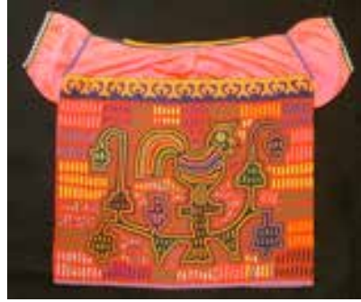
Görsel 18. Mola aplikelerin en büyük özelliği yüzeyde boş alan bırakmamaktır

Merkezi motif düzenlemesinde ana desen genellikle merkezi olarak yer alır ve onu çevreleyen detaylardan her zaman daha büyüktür. “Bir mola üzerinde merkezi bir figür varsa, ancak alt boşluklar merkeze bağlı geometrik desenler ile doldurulursa, dolgu bisu-bisu olarak adlandırılır. Boş alan bırakmamak üzere en popüler doldurma tekniğine tas-tas denir” (Graburn, 1976, s. 175) (Görsel 18). Desenler, günlük yaşamda bulunan yerel bitki örtüsü ve hayvanlar veya nesnelere içerebilir. Tarihsel konulu yapılan molalar ise Kuna köy yaşamı, mitoloji ve dini imgelerin tasvirlerini içerir. Bir diğer desen teması ise dini içeriklidir. “Günümüzde Kuna son yıllarda misyonlaştırılmaya tabi tutulsa da, çoğu kaynaklardan elde edilen bigilere göre bir çeşit bağdaştırıcı dini takiben, çoğunluğu hala aborijinal inançlara sahiptir. Onlar, maddi kültür de dahil olmak üzere, yaşamın diğer yönleriyle olduğu gibi, dini fikirlerde de her sistemin sunduğunun en iyisini alarak bir düzen kurmuşlardır” (Graburn, 1976, s. 178).