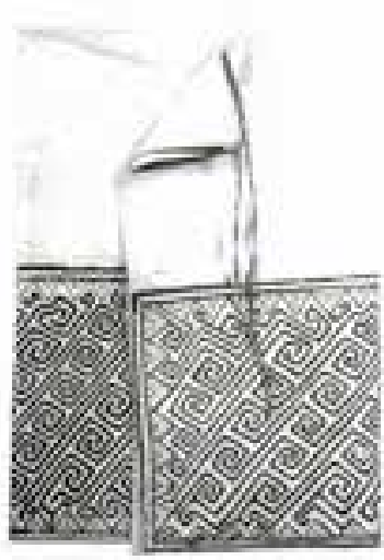
Görsel 3. Kuna yerli halkına ait picha denen diz ya da bileğe kadar uzanan etek

1800'lü yıllarda ise, genel olarak yerli vücut boyamasının giysi üzerine aktarılması, ilk önce picha denen diz ya da bileğe kadar uzanan etek üzerinde görülmüştü (Görsel 3). “Kuna kadınları uzun eteklerinin alt kenarını geniş desen ve sembollerle süslemeye başlamış ve bu sanat formu on dokuzuncu yüzyılın ortalarına kadar devam etmiştir” (Shaffer, 1985, s.4). Sonraları Kuna kadınları uzun tunik bluzlar giymişlerdi. Vücut boyamalarında kullandıkları geometrik ya da imgesel formlar böylece kumaş üzerine boyanmaya başlanmıştı.