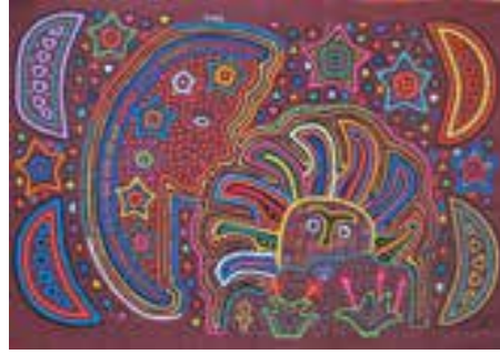
Görsel 12. Çok renkli mola 'obo galet'