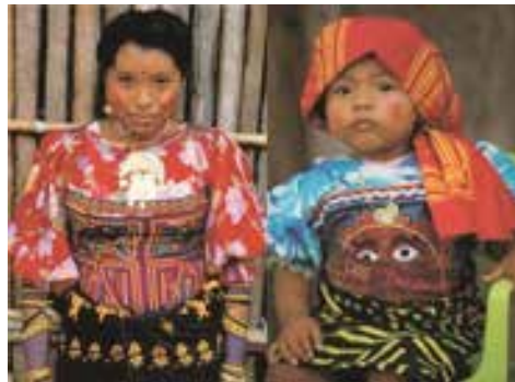
Görsel 19. Geleneksel giysili Kuna kadını ve çocuğu

Giysi, hem soyut hem de somut göstergelere dayanan bir iletişim biçimidir. Dünya modasının merkezi olduğu kabul edilen Batı dışındaki kültürlerin kıyafet geçmişi de uzun bir tarihe sahiptir ve Kuna mola bluzları gibi, Batılı olmayan giysilerin de moda olduğunun anlaşılması nispeten yenidir. Batı dünyasında yaygın olan ve modanın, ulus ötesi olduğu bir dünyada, farklı kültürlerin giysileri ve tekniklerinin kimlik ve etnik kökenini tanımlamaya devam ettiği görülmektedir (Marks, 2016, s. 30). Kuna kadınlarının kıyafeti, özellikle Kuna kimliğini yaratmanın bir yolu olarak gelişirken, Kuna yerel kıyafetinin tarihini inceleyerek, geçmişte ve bugünkü kültürel ve ekonomik üretimi düzenleyen mekanizmaların yanı sıra, kültürlerin ve bireysel yaşamların, geleneksel çizgilerini koruyarak giysi tarzlarına güncel yaklaşımlar sağlamada etkilerini görmek mümkündür (Görsel 19).