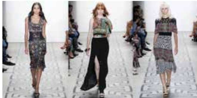
Görsel 23. Nicole Miller, 2017 ilkbahar/ yaz hazır giyim koleksiyonu

Tasarımlarında biçim, desen ya da renk zıtlıklarına yer veren Nicole Miller için mola aplikeleri önemli detaylarından biridir. Zıt renklerin kullanımı, 2017 ilkbahar/ yaz hazır giyim koleksiyonuna ilham kaynağı olmuştur (Görsel 23). Mola applike desenlerine özgü vücut boyama detaylarına sahip geometrik çizgileri temsil eden, güncel yorumlarla, yeni görsel etkiler içeren tasarımlar yaratmıştır.