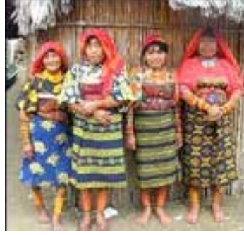
Görsel 4. Geleneksel giysileriyle Kuna kadınları