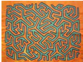
Görsel 16. Geometrik desenli labirent mola örneği

Deacon'ın (2014, s. 117) War Imagery in Women's Textiles adlı kitabında aktarılan bilgiye göre, Teena Jennings molalarda kullanılan beş desen kategorisini belirlemiştir. Labirent stili, yuvarlatılmış eğrilerle ya da daha köşeli geometrik, doğal bir tarzda yapılan karmaşık tasarımları içerir. Bu labirent tarz için orijinal ilhamın Kuna vücut resim geleneğinden gelmesi muhtemeldir. Vücut boyama tasarımları ile bazı mola tasarımları arasında, özellikle iki renkli geometrik molalar arasında benzerlikler vardır (Görsel 16) (Graburn, 1976, s. 170). Zikzak ve labirent gibi fazlasıyla girintili-çıkıntılı, kısa ve köşeli çizgilerden oluşan bu karmaşık desenlerin uygulaması ustalaşmış bir yetenek gerektirir (Görsel 17).