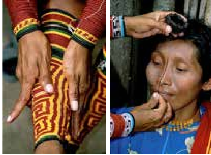
Görsel 5. Kuna kadınları el ve ayak bileklerinde geometrik desenli, boncuklardan oluşan aksesuarlar kullanırlar Görsel 6. Kuna kadınları, burunlarını ön plana çıkarmak için burun kemiklerinin üstüne siyah çizgi çekerler

Needlework Through History: An Encyclopedia adlı kaynaktan edinilen bilgiye göre, Kuna bluz modeli muhtemelen 16.yy Fransız protestanları olan Huguenot giyiminden alınmıştır (Leslie, 2007. s.172). Kuna bluzu, ön ve arka omuzlar üzerinde uzanan bir roba, kısa büzgülü ya da pilili kollar ve robadan bedene uzanan tamamlayıcı renkli ve temalı görüntülere sahip ön ve arka mola aplikeler olmak üzere beş dikdörtgen parçadan oluşur. Araştırma sırasında elde edilen kaynaklardaki görseller incelenerek çizilen mola bluz teknik çiziminde de görüldüğü gibi bluz tamamen geometrik bir formdan oluşmaktadır (Çizim 1). Yaka için dikdörtgen omuz parçasının ortasında bir boyun açıklığı meydana getirilir ve kenarları zıt bir renk biye ile temizlenir. Yine görsellere dayanılarak oluşturulan mola bluz kalıp parçaları kol evi ve yaka oyuntusu olmaksızın düz hatlardan oluşmaktadır (Çizim 2).