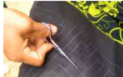
Görsel 17. Labirent mola uygulaması