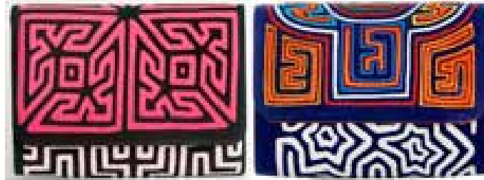
Görsel 26. Yasmin Sabet, Portföy Çanta, 2016 İlkbahar/ yaz koleksiyonu