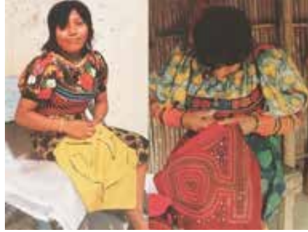
Görsel 8. Mola yapma yeteneği Kuna kadınları arasında bir statü kaynağıdır

kumaşlar üzerine çizilen desenler kesilip çıkarılarak, detaylı ve ayrıntılı mola aplikeleri dikerek içinde bir sanat biçimi olan eşsiz bir bluz tarzını yaratmışlardır. Yıllar geçtikçe kadınlar yüzlerce mola desenini geliştirmişler ve bunları gerçekleştirmenin daha yaratıcı yollarını araştırmışlardır (Görsel 8). Kaç kat kumaş kullanıldığı, görünmez dikiş özelliği, kesilen kenarların düzgün kıvrılması ve genişliği, eğimli kenarlarda köşelenme oluşmaması, nakış gibi ekstra ayrıntıların eklenmesi, tasarımın genel sanatsal üstünlüğü ve renk düzenleri, bir mola kalitesini belirleyen faktörlerdir.