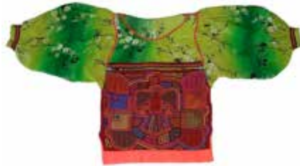
Görsel 7. Kuna kadınları tarafından farklı stillerde molalar giyilmektedir

Kaynak arařtırmalarında incelenen görseller göz önünde bulundurulduğunda bluzların, kemer gibi bedeni saran ön-arka korsaj parçasını oluşturan mola aplikelerin aynı olmadığı dikkat çekmiştir. Ancak genellikle birbirleriyle ilgili konulara ve temelde aynı renklere sahiptir. Benzer desenler boyut, şekil ve renkte küçük farklılıklar gösterir. Kol ve roba kumaşı farklı olmalıdır. Baskılı kumaş çok sık kullanılmıştır. Eğer düz renk kullanılmışsa, genellikle temel renk veya moladaki renklerle zıtlık oluşturan bir renk tercih edilmiştir. Roba ve mola parçayı birleřtiren dikişler genellikle dekoratif řeritlerle süslenmiştir (Görsel 7).