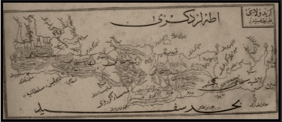
Harita 1: Girit'in Coğrafi Durumu 8

Batılıların Kreta, Crete, Creta ; Arapların İkriyyə, İkritiş, İkritis olarak adlandırdıkları Girit, Akdeniz'in beşinci 4 , Doğu Akdeniz'in ise Kıbrıs'tan sonra en büyük ikinci adasıdır. 5 23° - 31' ve 26° - 20' doğu meridyenleri ile 34° - 55' ve 35° - 41' kuzey paralelleri arasında bulunan adanın yüzölçümü 8.261 km 2 'dir. 6 Batı-doğu istikametinde uzunluğu yaklaşık 265 km., genişliği ise 15-50 km. arasında değişmektedir. 7