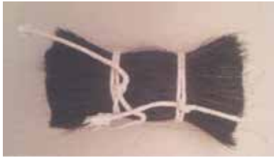
Görsel 5. Ebrû fırça yapımında kullanılan atkuyruğu kılı