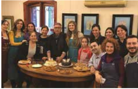
Görsel 13. Ebrû yapımı sırasındaki sosyal ortam

Ritüelin, ebrû yapım safhasında hem ebrucuların hem de teknedeki suyun dinlenmesi için çay arası verilmektedir. (Görsel-13) Bu sırada aynı tekneyi kullanarak ortak bir faaliyet içine giren ebrûcuların, sosyal bir ortam içinde buldukları duygusu da tecrübe edilmektedir.