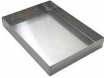
Görsel 1. Ebrû Teknesi

Ön hazırlık safhası, ebrû yaparken kullanılan tekne (Görsel-1), bız (Görsel-2, toz boya (Görsel-3), kitre ve fırça (Görsel-4), atkuyruğu kılı (Görsel-5), taraklar (Görsel-6), öd ve kâğıt başta olmak üzere diğer yan malzemelerin bir araya getirilmesidir.