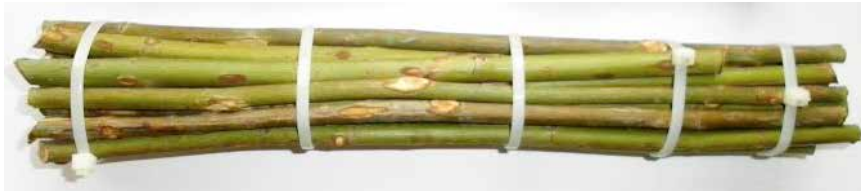
Görsel 8. Ebrû fırça yapımında kullanılan gül dallarının kurutulması

Gül dalları, bahar ve yaz döneminde çiçek vermiş, esnekliğini kaybetmemiş, serçe parmağı kalınlığındaki dallardan seçilir. Yaklaşık yirmi gün süren kuruma döneminde balya belli aralıklarla çözülüp gül dalları elle düzleştirilir ve yeniden sıkıca bağlanır. (Görsel-8) Fırça yapımı için gerekli kuruluğa ulaşan dalların uç kısmındaki kabuk, fırça yaparken atkuyruğundan yapılan kıllarının sıkıca bağlanabilmesi için soyulur. (Görsel-9) Böylece at kılların ebrû yaparken teknedeki suyun yüzeyine dökülmemesi sağlanır. Fırçalar, özel birbağlama şekli uygulanarak hazırlanır.