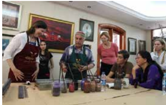
Görsel 10. Ebru yapılacak ortamın kurulması

Ebrû ritüelinin hazırlık safhası, ebrû yapım aşamasından hemen önceki safhadır. Bu safha, tekne açma safhasıdır. Ebru teknesi açılacak ortamın, kapalı olması gerekir. Aksi takdirde rüzgârın getirdiği toz zerrecikleri teknedeki suyun yüzeyine düşebilir ve boyalar suyun yüzeyinden kâğıda alındığında estetik olmayan beyaz boşlukların oluşmasına sebep olabilir. Ebrû yaparken kullanılacak masa ya da sehpa, daha sonra temizlenmesi kolay olsun diye büyük bir örtü ya da gazete kâğıtlarıyla örtülür ve diğer malzemeler yerleştirilir, (Görsel-10).