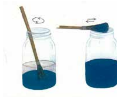
Görsel 11. Ebrû fırçasına boya alınması

Ebrû ritüeli, ritüelin gözlemlenebilir ve tecrübe edilebilir safhası olan hazırlık safhasının hemen ardından, ebrû yapım safhası ile devam eder. Bu safha, ebrû yapımını dışarıdan izleyenlerin ritüeli gözlemlemeye başladıkları safhadır. Kitreli su ebrû teknesine dökülmüş ve kıvam ayarı yapılmıştır. Boyalar, fırça ve/veya biz vâsıtasıyla teknedeki suyun yüzeyine atılacak şekilde hazırlanmıştır. Sırada fırçaya boya alma vardır. Fırçadaki boyanın miktarı, boyanın su yüzeyinde vereceği tepkiyi etkiler. Fazla boya yüzeyi doldurur ve başka renklere yer kalmaz. Az boya ise boyanın su yüzeyinde istenen yayılmayı yapmamasına sebep olur. Bu yüzden fırça boyaya batırıldıktan sonra fazla boyanın fırçada kalmaması için hep fırça aynı kenarı kavanozun ağzına gelecek şekilde sürülür. (Görsel-11) Fırçanın kıllarının etrâfa boya sıçratmamasına dikkat edilir.