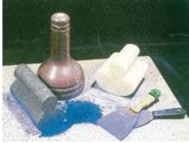
Görsel 3. Ebrû yapımında kullanılan toz boyalar ve el taşı