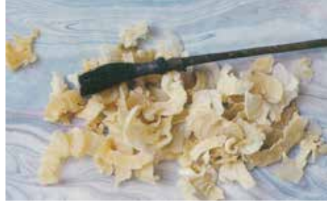
Görsel 4. Ebrû yapımında kullanılan kitre ve fırça