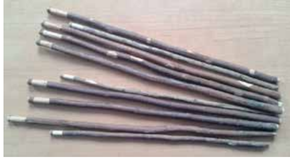
Görsel 9. Ebru fırçası yapımında kullanılan gül dallarının fırça yapımı için hazırlanması

Gül dalları kururken toz boyalar da çeşitli şekillerde ezilir. Bu ezme, klâsik ebrû yapımında “dest-i seng” (el taşı) (Görsel-3) denilen kendine has bir şekli olan mermer ile yapılır. Bir renk toz boyanın ezilmesi, her seferinde üç-dört saat olmak üzere yirmi-yirmi beş saat sürebilir. Boya ezmeye ara verildiğinde boyalar kuruyabilir ama bu boyanın kıyamına zarar vermez. Toz boyaların ezilmesi sırasında etrâfın kirlenmemesi için kapalı ve sık kullanılmayan, tercihen atölye ortamları tavsiye edilir. Hem böylece, ritüeller için önemli bir unsur olan bu işe özel bir mekân da oluşturulmuş olur.