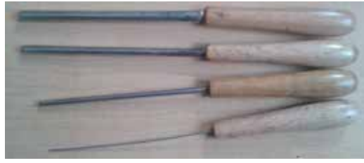
Görsel 2. Ebrû yapımında kullanılan bızlar