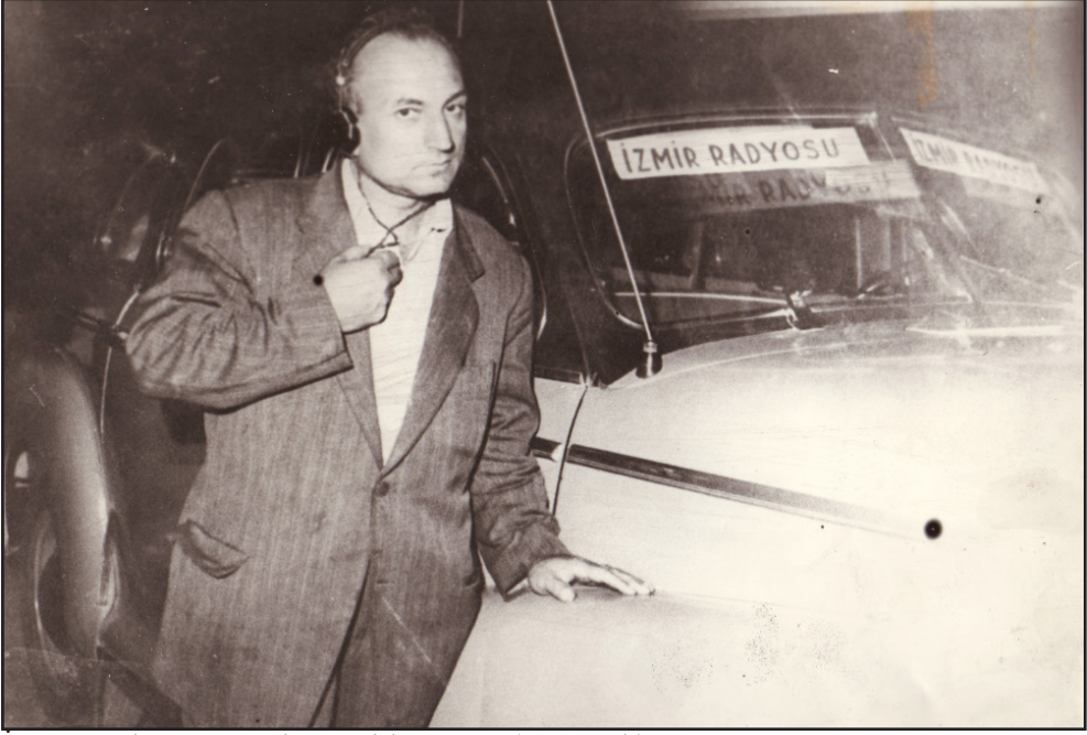
İzmir Radyosuna Tahsis Edilen Araç (1953 Yılı)