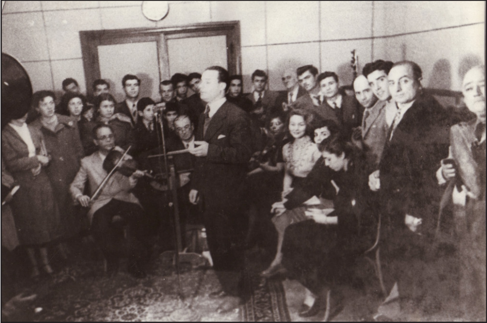
İzmir Radyosu Ses ve Saz Sanatçıları (1953 Yılı) (TRT İzmir Radyosu Arşivi)