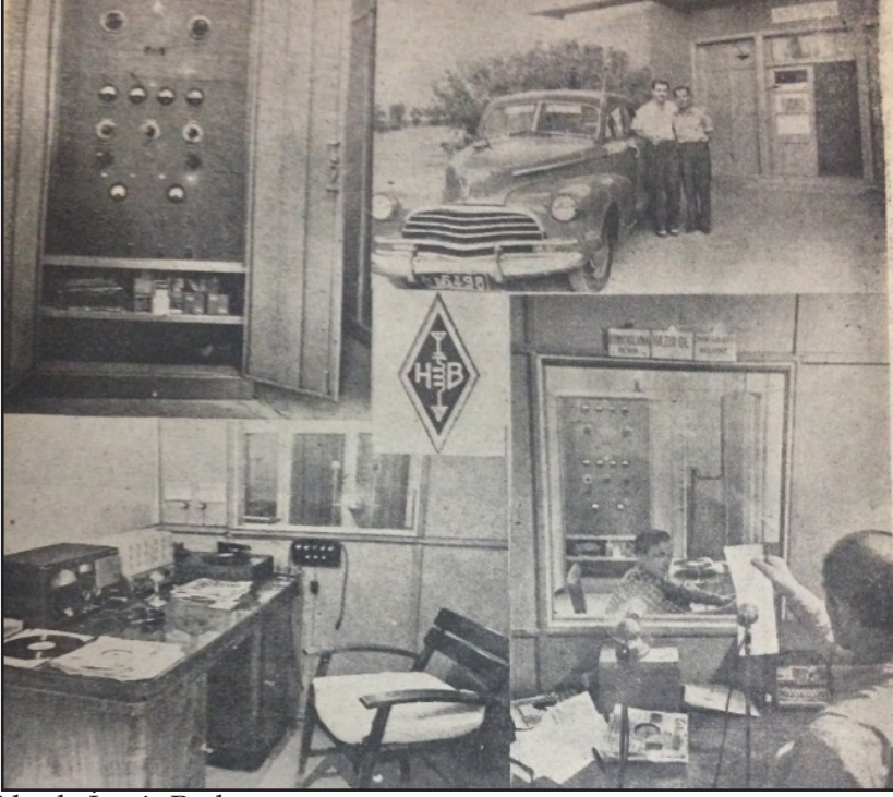
1951 Yılında İzmir Radyosu (Reklam Satış Dergisi 1951 Radyo Televizyon Yıllığı, s.28.)