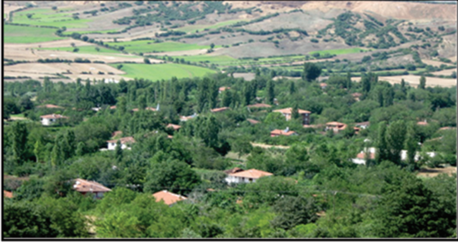
Şekil 2. Erbaa'daki Çerkez Köylerinden İverönü Köyü ( http://mapio.net/pic/p-25579257/30.04.2018 ).