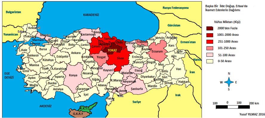
Şekil 4. Başka Bir İilde Doğup, Erbaa'da İkamet Eden Nüfus Dağılımı (2015).

Tabloya göre illerin dağılımına bakıldığında, ilçe genelinde Erbaa doğumlular dışında en çok Amasya doğumlu (1487 kişi) nüfus yaşarken, bu ili 1058 kişi ile Ordu ve 886 kişi ile Samsun izlemektedir. Yörede az nüfusa sahip olan illerin, genelde Erbaa'ya uzak iller olduğu görülmektedir. İlçedeki yabancı nüfusun neredeyse yarısını oluşturan (% 49,53) bu üç ilin tamamının Erbaa'nın yakın çevresindeki iller olduğu dikkati çekmektedir (Şekil 4).