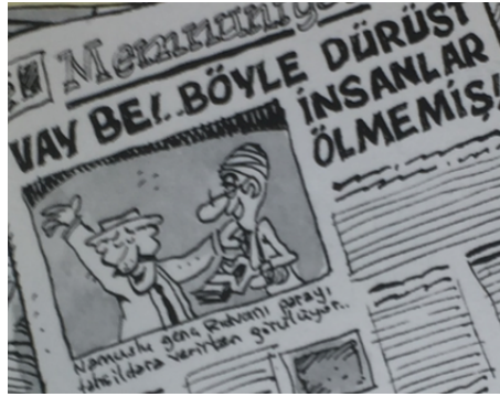
Resim 1. Rıdvan’ın düzmece haberlerle popüler yapılma sürecini betimleyen çizim kareleri (Arabacıoğlu, 2011, s. 15)

Rıdvan’ın halk nezdinde oluşmuş bulunan olumlu imajından yararlanmak isteyen patronlar onu banker yapmak istemektedirler. Rıdvan ise kendisinin banker yapılmak istenmesine şiddetle karşı çıkmaktadır. Rıdvan’ın söz konusu karşı çıkışı, bankerlik mesleğini sıradan bir iş olarak algılamasına dayanmaktadır. Kişisel dünyasında, kendisinin bir kahraman olduğu yanılısamasıyla yaşayan Rıdvan,