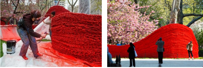
Resim 4-5. Orly Genger, 'Red, Yellow and Blue', Örne Enstalasyon, Madison Square Park, Manhattan, 2013

oluşturmuştur. Kuşkusuz bu da zor ve tekrarlı bir sürece işaret etmektedir” (URL 7).