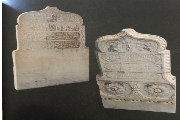
شواهد ضريح مصطفى باشا

لقد تولى مصطفى باشا شؤون ولاية الجزائر خلال 1798-1805 ويقال بأن شواهد ضريح المذكور لازالت موجودة في متحف الجزائر. ويتضح من السجلات التاريخية بأن مصطفى باشا نفذ خلال فترة ولايته الكثير من الاستثمارات الهامة. كما أسهم في تطوير العاصمة من خلال تخصيص منطقة مصطفى باشا للإسكان. وتتضمن الكتابة المنقوشة على شاهدة ضريحه العبارة التالية: "هو الباقي وهو الدائم وأن هذا الضريح بخص سيد مصطفى باشا الذي ارتحل إلى الدار الآخرة في ظل مغفرتة عز وجل. وكل شيء عرضة للفناء إلا هو المبين لا شريك له 17 .