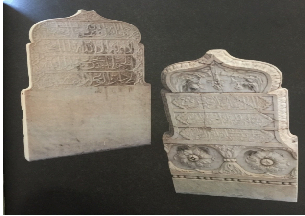
Cezayir Mustafa Paşa Sarayı 1799

القصر بقطع الصيني المستوردة من هولندا التي تتحلى بصور السفن وزخارفها. ولا زال هذه القصر قيد الاستخدام بمثابة " دار مصطفى للفنون الجميلة" tamamladıktan sonra aşağıdaki kitabeyi Sarayın giriş kısmına yerleştirmiştir(Tercüman'ın notu: metinde böyle bir kitabe rastlayamadım)