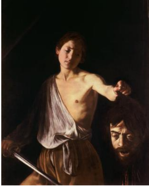
Görsel VIII: Michelangelo Merisi da Caravaggio, Golyat'ın kafasıyla Davut, 1610