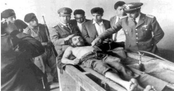
Görsel I: Che Guevara'nın otopsisini, 1967

Gözleri açık, üzeri çıplak, yakalandığına giydiği kanlı pantolonuyla teşhir edilen Che Guevara'nın ölü bedenine yapılanlar da bu mekanizmanın bir parçası ya da ölü adamdan duyulan korkudur. Che öldürüldükten sonra, önce saklanmış, sonra sergilenmiş, ardından bilinmeyen bir yerde isimsiz bir mezara gömülmüş, oradan da çıkarılıp elleri kesildikten sonra yakılmıştır (Berger, 1998:127).