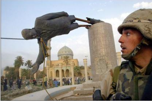
Saddam Hüseyin heykelinin devrilişi, Bağdat, 2003

Antik çağlardan bu yana hükümdar imgeleri aynı zamanda gücün de simgesi halinde sunula gelmiştir. Tanrının yeryüzündeki sureti ve sıfatlarının taşıyıcısı olan hükümdar paraların üzerinde, heykellerinde ve resimlerinde güçlü ve muzafferdir. Tam da bu sebeple devrilen hükümdarın ivedilikle imajının ortadan kaldırılması gerekmektedir. Saddam Hüseyin, Che Guevara ve Muammer Kaddafi'nin yanı sıra Amerikan propaganda sisteminin hedefi olan ve yenilgiye uğrayan birçok liderin sonu aynı olmuştur. Mussolini sevgilisi ile birlikte kurşuna dizildikten sonra ayaklarından ters asılarak teşhir edilmiş, Adolf Hitler ise belki kendisi de muazzam bir propaganda sisteminin uygulayıcısı olduğu için bedenini yakarak intihar etmiştir.