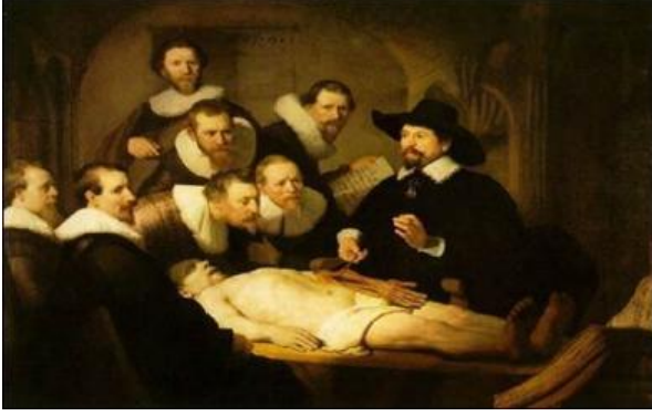
Görsel II: Rembrandt van Rijn “ Dr. Nicolaes Tulp’un Anatomi Dersi ” 1632

Che Guevara’nın öldürüldükten sonra teşhir edildiği ahırda çekilen fotoğraflarla Rembrandt’ın “ Dr. Nicolaes Tulp’un Anatomi Dersi ” adlı tablosu arasındaki benzerliğe dikkat çeken John Berger bu ikisi arasındaki temel benzerliğin amaçları olduğunu söyler. Berger’e göre tablo tıp alanında ders verirken Guevara’nın fotoğrafı siyasal bir uyarı olarak ele alınmalıdır ve verdiği ders politiktir. Bolivyalı gazeteci ve askerlerin yanı sıra bir Amerikan ajanının da başında beklediği Che’nin ölü bedeninin sergilenme amacı efsaneye son vermektir (Berger, 1998: 128).