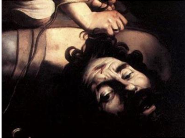
Görsel IX: Michelangelo Merisi da Caravaggio Golyat'ın kafasıyla Davut, 1600 (Ayrıntı)