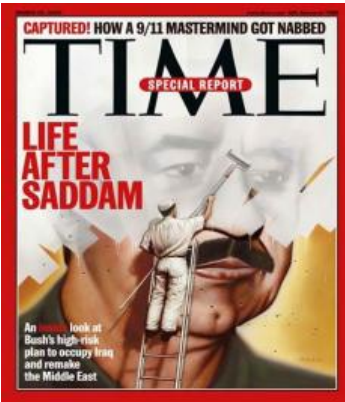
Görsel V: Time Dergisi, 10 Mart 2003

Antik çağlardan bu yana hükümdar imgeleri aynı zamanda gücün de simgesi halinde sunula gelmiştir. Tanrının yeryüzündeki sureti ve sıfatlarının taşıyıcısı olan hükümdar paraların üzerinde, heykellerinde ve resimlerinde güçlü ve muzafferdir. Tam da bu sebeple devrilen hükümdarın ivedilikle imajının ortadan kaldırılması gerekmektedir. Saddam Hüseyin, Che Guevara ve Muammer Kaddafi'nin yanı sıra Amerikan propaganda sisteminin hedefi olan ve yenilgiye uğrayan birçok liderin sonu aynı olmuştur. Mussolini sevgilisi ile birlikte kurşuna dizildikten sonra ayaklarından ters asılarak teşhir edilmiş, Adolf Hitler ise belki kendisi de muazzam bir propaganda sisteminin uygulayıcısı olduğu için bedenini yakarak intihar etmiştir.