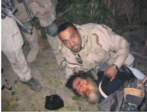
Görsel III: Saddam Hüseyin’in ele geçirilişi, 2003

Kaddafi gibi bir delikte ele geçirilen Saddam Hüseyin “ yargılanıp ” idam edilmeden önce uğradığı itibarsızlaştırma aslında ABD müdahalesinin başından bu yana Saddam imajına yapılan saldırıdan daha kuvvetli değildi.