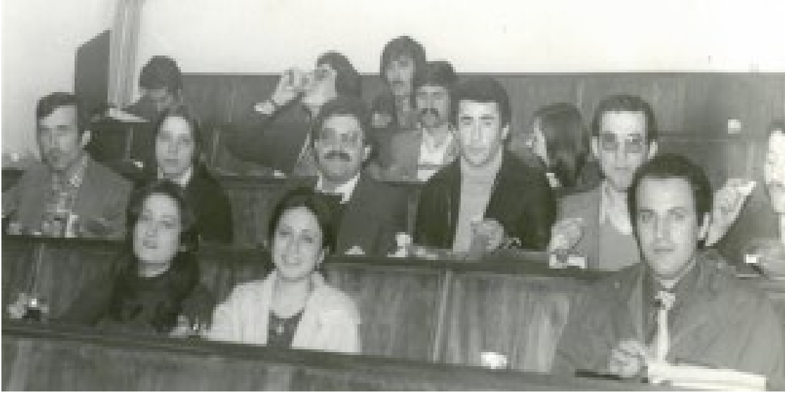
İstanbul Üniversitesi Edebiyat Fakültesinde A7'de arkadaşlarıyla bir ders öncesi.