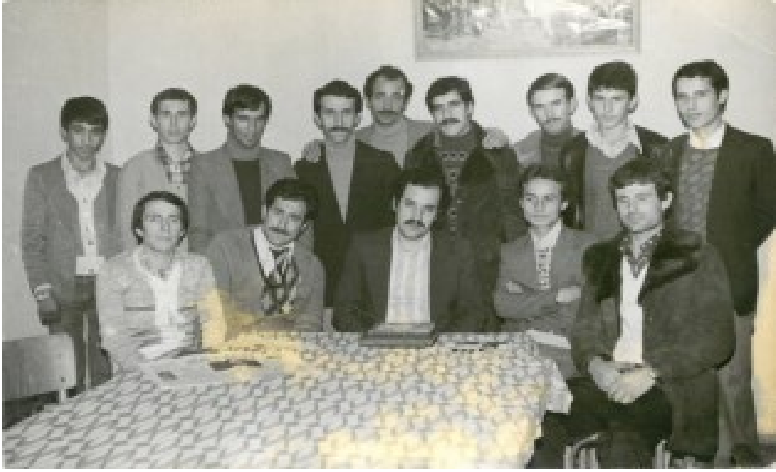
Yeniden Milli Mücadele yıllarında Küçükçekmece Kültür Ocağı'ndaki arkadaşlarıyla.