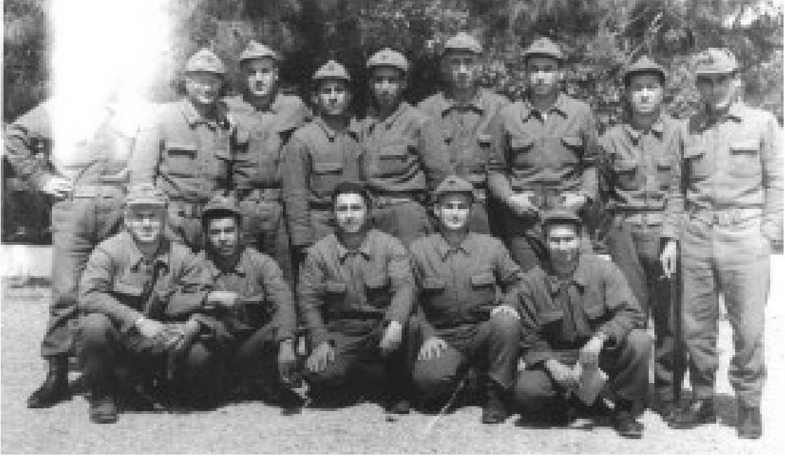
Kürsü sekreterliği sonrası Denizli'den dört aylık kısa dönem askerlik eğitimi hatırası.

üzere neredeyse bütün meslektaşlarıyla ciddi polemiklerle geçmiş ve her defasında kendisini en üstün pozisyonda görmeyi karakter edinmiş Abdülkadir Karahan Hoca gibi bir şahsiyetin, yeni mezun olup bölüm kütüphanesindeki memuriyeti esnasında para karşılığı öğrencilere tez yazmaktan başka ilmî bir faaliyetine şahit olamadığımız İskender Pala'dan akademik anlamda korkup çekineceğine ve bir de bu endişelerini bu değerli arkadaşımızın yüzüne karşı dile getireceğine inanmak mümkün değildir. Üstelik ikinci imtihana hiç girmediği hâlde, buna da katıldığını ve yine Karahan Hoca'nın, bile bile kendisine sınavı kazandırmadığını söylemesi ancak ateş ile izah edilebilecek bir durum arz etmektedir. Zira İskender Pala birinci imtihanı kazanamayınca Deniz Harp Okulunda edebiyat öğretmenliğine başladığından zaten böyle bir kadroya müracaat etmesi fiziken mümkün değildi.