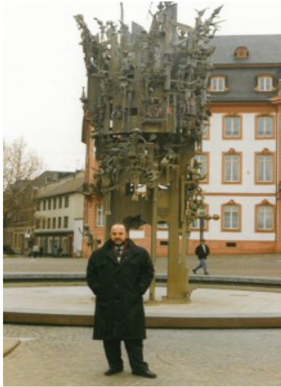
Solda: Konferans için gittiği Almanya'da Friedrich Schiller heykelinin önünde. Sağda: Almanya'da modern bir heykelin önünde.