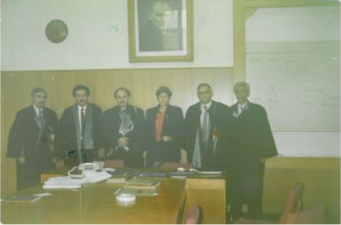
İstanbul Üniversitesi Edebiyat Fakültesi Kurul Salonunda doçentlik jürisi sonrası hatıra fotoğrafı.