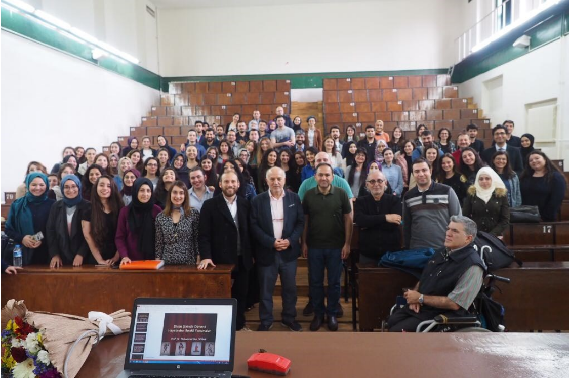
2018 Mayıs'ında İstanbul Üniversitesi Edebiyat Fakültesi A5'teki son derlerinden birini verirken asistanlar ve bir grup öğrencisi bir vefa sürprizi olmak üzere aniden dersine girerler ve böylesine unutulmayacak derecede güzel bir hatıra fotoğrafı çekilir.