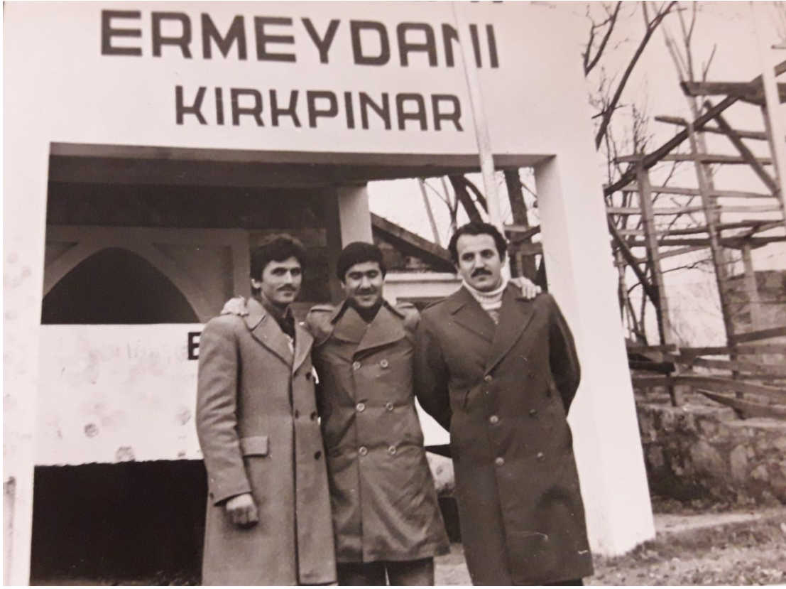
Millî Mücadele Birliği yıllarında Edirne Ermeydanında arkadaşlarıyla