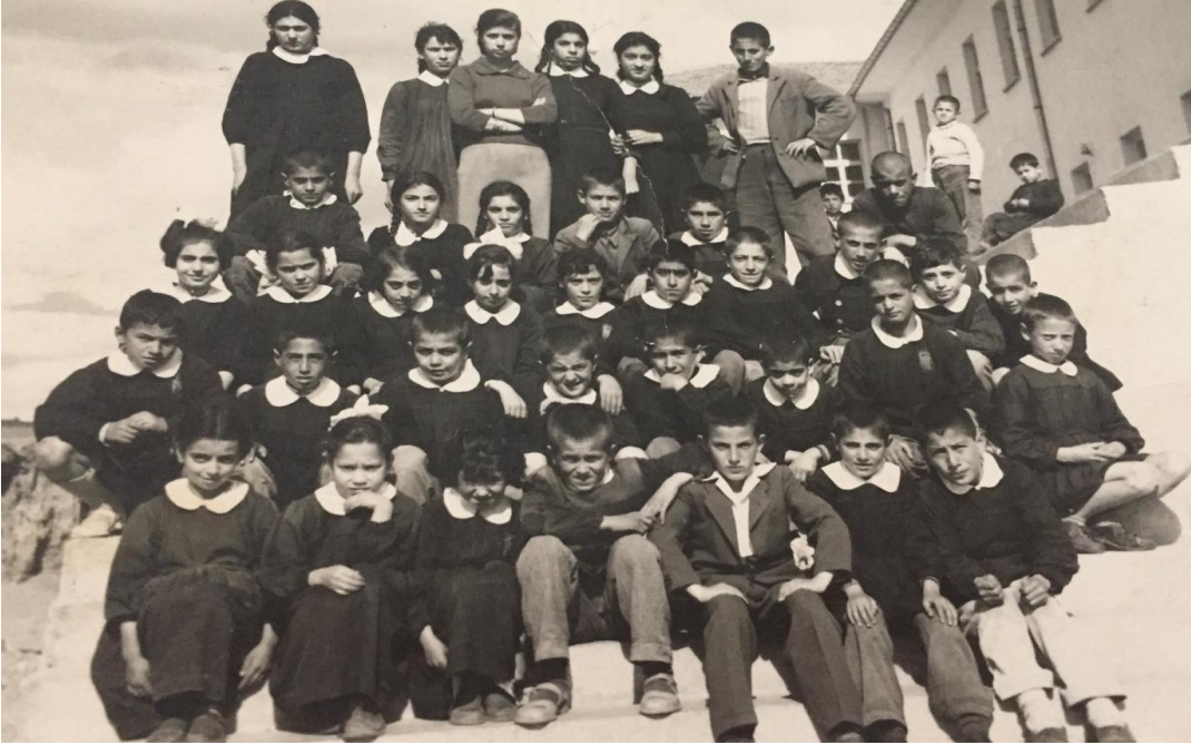
Erzurum Ali Ravi İlkokulu 5 sınıf arkadaşlarıyla toplu hâlde