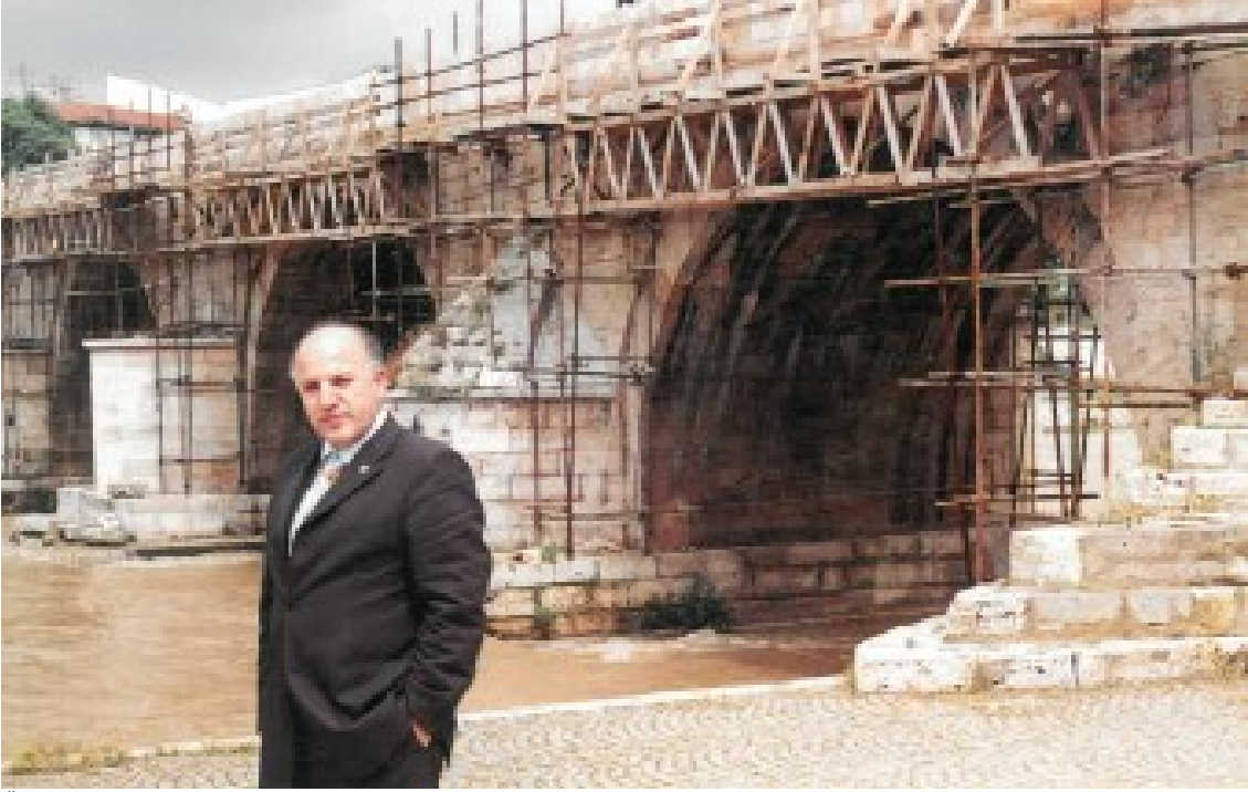
Üsküp'te Osmanlı yapımı Taşköprü'nün gölgesinde.