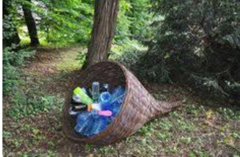
Resim 12. Wela (Elisabeth Wierzbicka) “Bereket Boynuzu”, 2013

Asıl adı Elisabeth Wierzbicka olan yerleştirme sanatçısı Wela’nın Bereket Boynuzu adlı çalışması tüketim toplumuna yönelik son derece eleştirel bir bakış sunar. Yapıt günümüzün en büyük sorunlarından olan kirlilik ve doğanın uzun süreçlerde dönüştüremediği plastik atıklarla dolu bir cornucopia’yı betimler. İronik bir yaklaşımla günümüzün bolluk ve bereket simgesi olarak ürün ambalajlarını seçmiştir. Doğayı gözetmeksizin aşırı tüketimin sonucunu betimleyen plastik şişelerden oluşan atık ürün ambalajları cornucopianın içine tıkıştırılmıştır. Wela bu çalışmasıyla; tüketim, kirlilik, doğanın insan eliyle bozulması gibi çevresel ve küresel sorunları düşündürür.