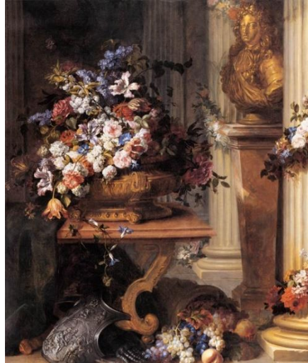
Resim 7. Jean Baptiste BELİN DE FONTENAY, "Altın Vazoda Çiçekler, 14. Louis'nin Büstü, Bereket Boynuzu ve Zırh", 1687, Louvre, Fransa

Botticelli'nin "Bereketin Alegorisi" adlı bu çalışmasında, bir kadın olarak resmedilen "bereket" sembolü olarak kolunda bir cornucopia taşır ve ona meyve taşıyan putti 9 eşlik eder. Cornucopia Rönesans'tan başlayarak batı resim geleneğinde mitolojik konulu resimlerde yer alan bir sembol olarak karşımıza çıkar. Diğer yandan bitkisel motiflerin resmin ana konusu olduğu natürmort türündeki örneklerde de cornucopia imgesine rastlarız.