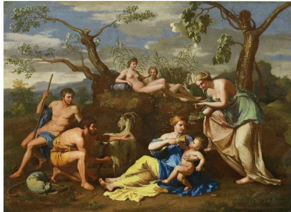
Resim 2. Nicholas POUSSIN, "Çocuk Jüpiterin Nymph'ler tarafından Beslenmesi", 1650

“Kronos, kutsal bitkisi meşe olan kız kardeşi Rhea ile evlendi. Toprak Ana ve ölmekte olan babası Uranos, oğullarından birinin bir gün Kronos'u devireceği kehanetinde bulundu. Bu nedenle her yıl Rhea'nın kendisi için doğurduğu çocuğu yuttu. İlk olarak Hestia'yı, daha sonra Demeter'i, sonra Hera'yı, daha sonra Hades'i ve en sonunda da Poseidon'u yutarak varlığını tehdit edebilecek tehlikelerden kurtulmayı denedi. Rhea çok öfkeleni. Üçüncü oğlu Zeus'u gece karanlığında ıssız Arkadia'daki Lykaion Dağı'nda dünyaya getirdikten sonra onu Neda Nehri'nde yıkayıp Toprak Ana'ya emanet etti. Toprak Ana'da onu Girit'teki Lyktos'a götürüp İda Dağı'ndaki Diktys Mağarası'nda gizledi. Kendisine bakması için de Melisseus'un kızları dişbudak perisi Adrestia ile onun kız kardeşi İo'yu ve Keçi-peri Amaltheia'yı tayin etti. Zeus burada, üvey kardeşi Keçi-Pan ile birlikte Amaltheia'nın sütünü yanı sıra balla beslendi. Zeus iyi yürekliliklerinden dolayı bu üç periye minnet duyuyordu ve Evrenin Hükümdarı olduğunda Amaltheia'nın resmini oğlak burcunun simgesi olarak yıldızların arasına yerleştirdi. Amaltheia'nın bir ineğinkini andıran boynuzunu alıp Melisseus'un kızlarına verdi; bu boynuz ünlü Cornucopia, yani sahibinin dilediği yiyecek ve içeceklerle dolan bereket boynuzu haline geldi.” 3