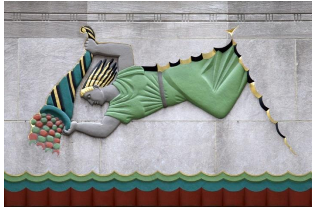
Resim 9. Lee LAWRIE, "Cornucopia of Plenty", 1937, Rockefeller Center, New York.

Rockefeller Center’da insanın ruh, bilim, endüstri ve diğer alanlardaki gelişimini göstermek amacıyla sanat eserlerinden yararlanılmıştır. Cornucopia ise bu bağlamda ticari başarı, zenginleşme, endüstrileşme gibi kavram ve vaatlerin bir sembolü olarak kullanılmıştır. Bu örnekte cornucopia, doğadan gelen ve doğal olanla ilişkili bir bereket imgesi olmak yerine kapitalizmin vadettiği zenginleşmeyle ilişkili bir sembol olarak değerlendirilmiştir. 20. Yüzyıl doğayı sömürme üzerine kurulmuş kapitalist ekonominin egemenliğindedir.