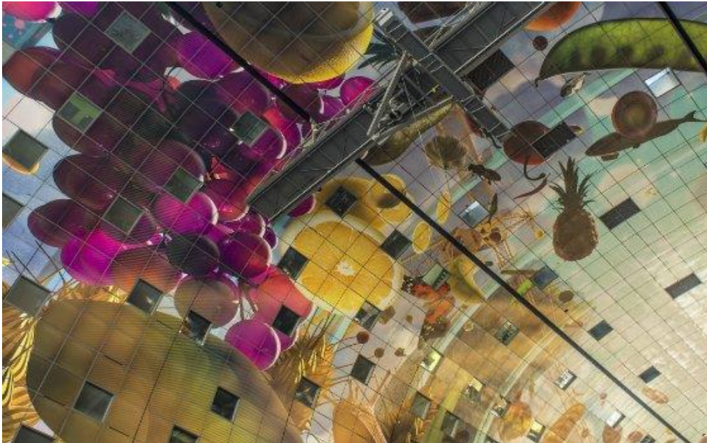
Resim 11. Arno COENEN ve Iris Roskam tarafından Rotterdam Markthal iç duvarının tasarımını oluşturan "Horn of Plenty"(Bereket Boynuzu) adlı dijital duvar resmi.

Cornucopia sembolünün günümüz sanatındaki yorumlarından biri de Hollanda'da, Rotterdam Markthal olarak inşa edilen kemer biçimindeki yapının iç duvarında yer almaktadır. Hollandalı sanatçılar Arno Coenen ve Iris Roskam'ın tasarımcı ve animatörlerden oluşan bir ekiple birlikte tasarladıkları "Horn of Plenty" (Bereket Boynuzu) adlı bu sanat çalışması 11.000 metrekarelik bir alanı kaplamaktadır.