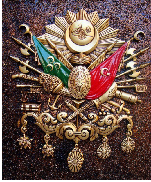
Resim 14. Osmanlı Arması, 1882

Cornucopia bir nesne olarak bakıldığında, içinde bolluğu, bereketi taşıyan bir kaptır. Meyveler ve çiçekler gibi güzel bulunan nesnelere doludur. Günümüzde kullandığımız ürün ambalajları da yiyecek ve içeceklerimizi barındıran çeşitli formlarda kaplardır. Cornucopia'nın ergonomik açıdan kolay taşınabilme ve sivri ucunu saplayarak kullanılabilmesi de işlevsel olduğunu düşündürür. Estetik bir görünümü de olmasıyla, endüstriyel tasarımla ilişkilendirilir. Günümüzün tüm ürün ambalajları da işlevsellik ve albeni açısından tüketimi özendirerek biçimde tasarlanır. Bu bağlamda günümüzde bir çocuğun elindeki ambalajlı külah dondurma, belki de cornucopiaya en yakın imgedir. Özetle kapitalizm kazanca dönüştürebileceği her olguyu kullandığı gibi, cornucopia gibi mitolojik kaynaklı değerleri de, gerçek anlamı dışına çıkararak, tüketime özendirmek için kullanabilir.