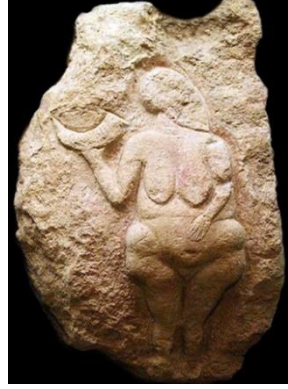
Resim 1. Laussel Venüsü, M.Ö.25.000-23.000. Fransa

Çatalhöyük'te bulunan boğa başları tarım toplumunu işaret eden bir bereket kültürünün simgeleri olmuştur. Cornucopia'nın orijinini de bir boynuz oluşturmaktadır. Ancak Yunan mitolojisini irdelediğimizde karşımıza çıkan Cornucopia imgesinin ataerkil toplum düzeniyle eril bir sembole dönüştüğü gözlenebilir. Ortaya çıkışıyla ilgili mitolojik söylenceler tanrıçalarla değil tanrılarla ilgilidir.