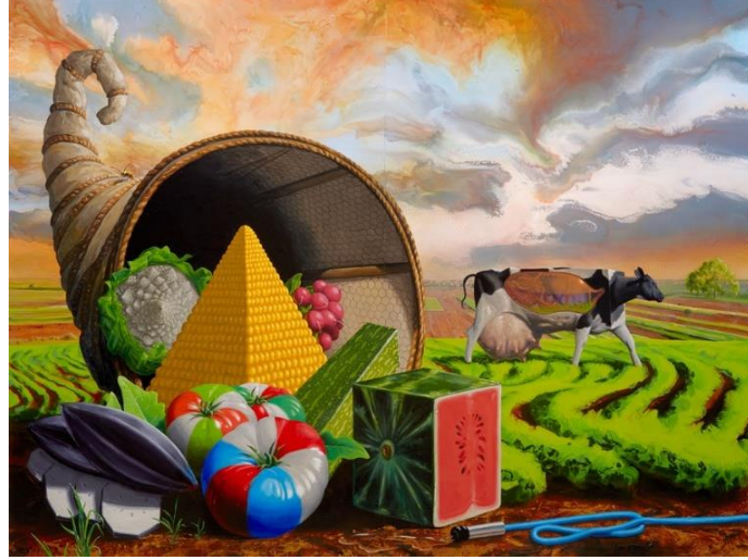
Resim 10. Alexis ROCKMAN, "Horn of Plenty", 2012

Cornucopia sembolünün günümüz sanatındaki yorumlarından biri de Hollanda'da, Rotterdam Markthal olarak inşa edilen kemer biçimindeki yapının iç duvarında yer almaktadır. Hollandalı sanatçılar Arno Coenen ve Iris Roskam'ın tasarımcı ve animatörlerden oluşan bir ekiple birlikte tasarladıkları "Horn of Plenty" (Bereket Boynuzu) adlı bu sanat çalışması 11.000 metrekarelik bir alanı kaplamaktadır.