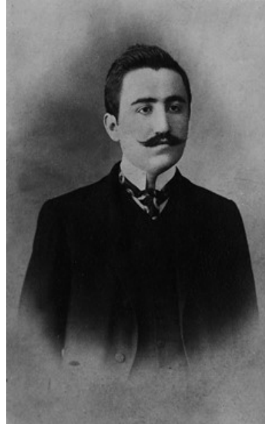
Resim 2. Mazhar Osman [Uzman] c.1910

Mazhar Osman'ın, Harf Devrimi'nden (1928) önce yayımlanan temel eserleri, Latin harflerine çevrilerek devrimden sonra yeniden basılmıştır. 16 1914 yılında yayımladığı Bimarhaneler'in İdaresi Hakkında Nesâiyih kitapçığını ise ilerleyen yıllarda yeniden yayımlamamış, gerek Toptaşı Bimarhanesi Başhekimi, gerekse Bakırköy Başhekimi olduktan sonra, doğrudan akıl hastanelerinin yönetimiyle ilgili başka bir eser kaleme almamıştır. Metnin