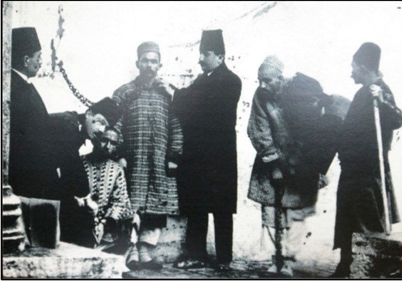
Resim 3. Mazhar Osman’ın farklı zamanlarda kaleme aldığı yazılarında, bir ‘başlangıç miti’ gibi tekrar tekrar hatırlattığı meşhur sahne: “Edirne’de Yıldırım Bayazid Bimarhanesi 1325 senesinde kapatılırken Prof. Mazhar Osman Uzman delilerin zincirlerini çözüyor.” Mazhar Osman Uzman, Tababet-i Ruhiye , c.1, Kader Basımevi, İstanbul, 1941, s.94.

“Kırk seneden beri, yevmi [her gün] mezkûr [adı geçen] dârüşşifanın önünden gelir geçer, ara sıra içerisine girerek mecânin-i mevcude hallerini [hastaların durumlarını] ve memur ve hidmelerinin [hizmetçilerin, hastabakıcıların] her bir güne vaki olan muamelelerini nazar-ı tedkikatten geçirerek hakikatten mecânin-i mevcudeye acır idim. Bu zavallıların, boyun ve ayaklarında yirmi otuz kiloluk demir zincir ile kârgir bina derununda çakılı, altlarında bir tahta kerevit ile yalnız tek bir hasır, elbiseden ma’ra [elbisesiz, çıplak] üstlerinde fersudeleşmiş bir kebeden [eskimiş, yırtık bir kebeden] başka bir şey olmadığı...”