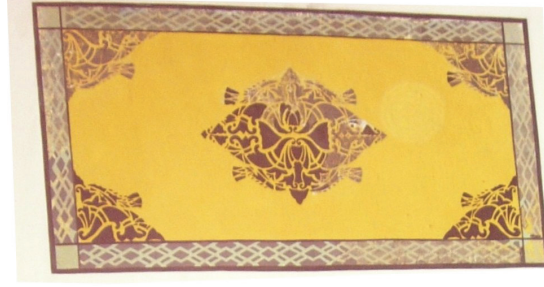
Fotoğraf 9. Denizli Kale Cevher Paşa Camii son cemaat yeri batı duvarı dokuma resmi

Nevşehir’deki sivil mimari örneklerinden Göreme Küçük Mehmet Konağı (1825), duvar resimlerinin çokça kullanıldığı bir diğer yapı-