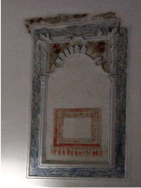
Fotoğraf 2. Cincin Abdülaziz Efendi Cami doğu duvarı dokuma resmi