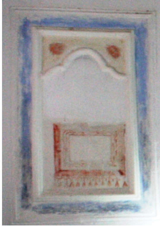
Fotoğraf 4. Cincin Abdülaziz Efendi Cami batı duvarı dokuma resmi