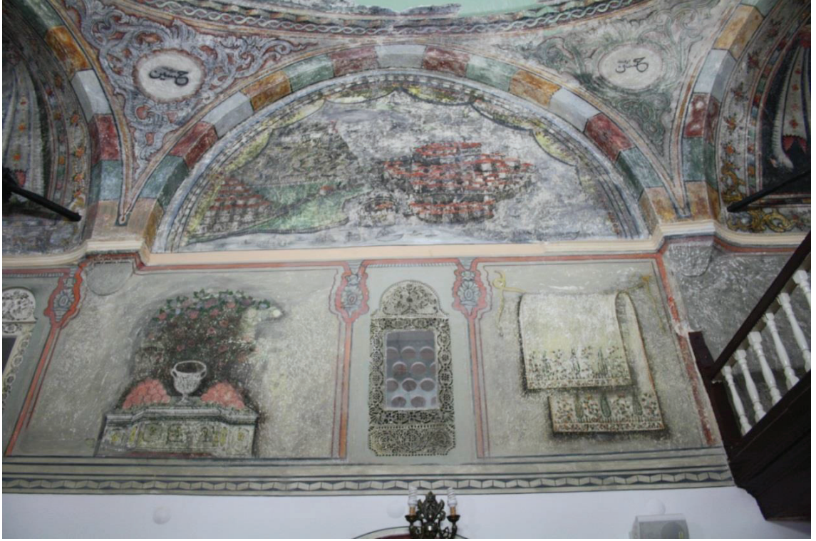
Fotoğraf 7. Koçarlı Mustafa Ağa Camii batı duvarında bulunan resimler