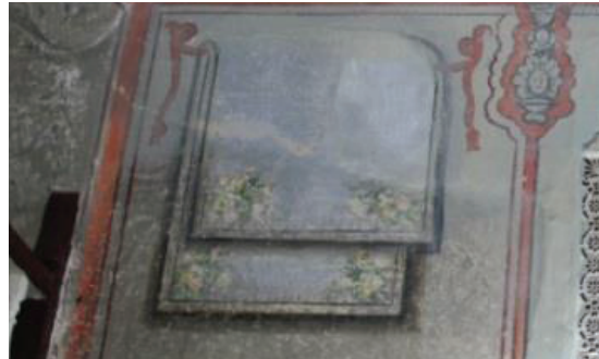
Fotoğraf 6. Koçarlı Mustafa Ağa Camii doğu duvarında dokuma resmi

halı veya kilimin sarkıtılması tesadüf değil sanatkârların isteyerek yaptığı bir durum olarak karşımıza çıkmaktadır. Bazı araştırmacıların ifade ettiği gibi camilerde yabancı ustaların veya bu ustaların çalışmalarını takip etmiş gayrimüslim sanatçıların varlığı bilinmektedir. Bu durum bize gayrimüslim sanatçıların oryantalist resimlerdeki halı tasvirlerinden esinlenerek bunu camilere yansıttığının göstergesi olarak kabul edilebilir 19 (foto 5-8).