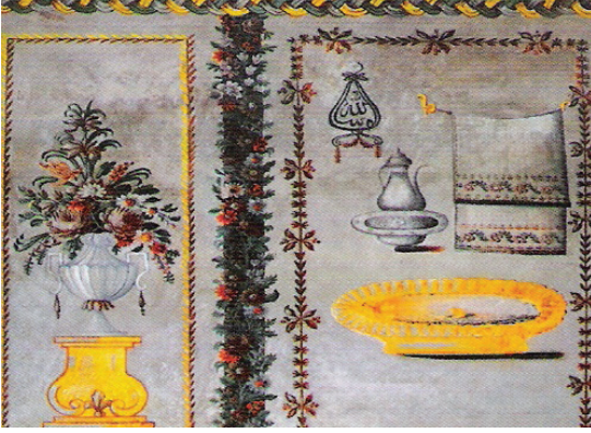
Fotoğraf 11. Neveşehir Küçük Mehmet Konağı duvar resmi

İbrik ve leğen sembolizmi Türk sanatında günlük edebiyata da yansımıştır ve Türk evlerinde misafirlere yönelik levhalar olduğu kaynaklarda geçmektedir;