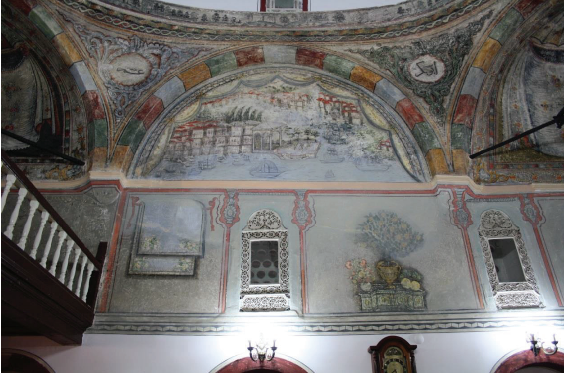
Fotoğraf 5. Koçarlı Mustafa Ağa Camii doğu duvarında bulunan resimler

lanmışlardır 17 . Halıların çok geniş kullanım alanı vardır ve bunlara göre de adlandırılırlar. Döşeme örtüsü olarak yere serilen halılar ekseriya dört parçadan ibarettir. Dini nitelikli kompozisyonlarda, özellikle dönemin ileri gelen şahsiyetlerinin tablolarında bir Türk halısının masa üstünde veya yerde serili durduğu yahut balkondan sarktığı ya da bir kilisenin apsisini süslediği görülür 18 .