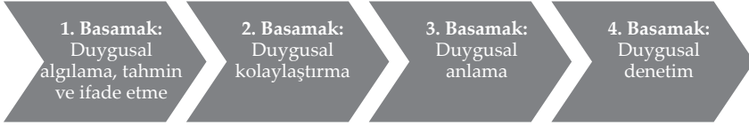
Şekil 1.2: Duygusal Zekânın İşleyiş Akışı 13

Kaynak: Mayer ve Salovey 1997 ve Prati 2009 dan uyarlanmıştır.