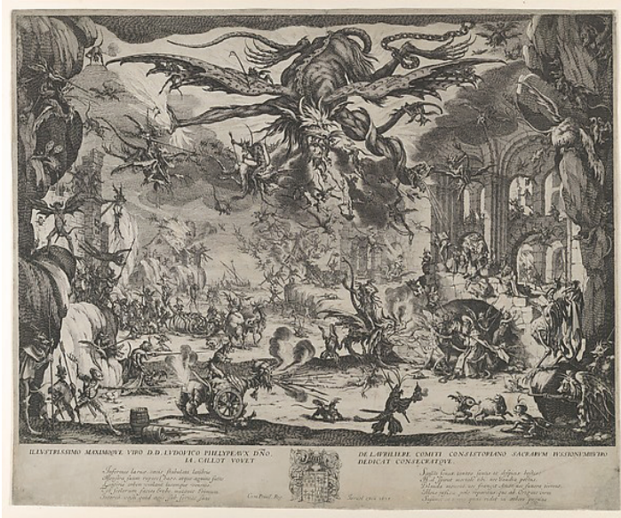
Jacques Callot, The Temptation of St. Anthony , 1635, Kağıt Üzerine Asitli Oyma Baskiresim. 36.1 x 47 cm, Metropolitan Müzesi http://www.metmuseum.org/art/collection/search/336568