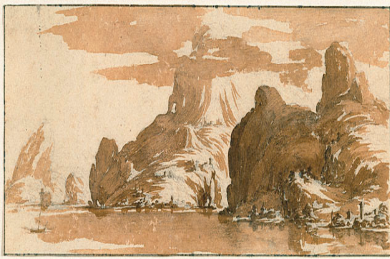
Jacques Callot, A View of Mountains across a Lake , 1632, Siyah Kağıt Üzerine Tebeşir ve Mürekkep, 9.98 x22.5 cm, J. Paul Getty Müzesi Koleksiyonu, Erişim Tarihi: 14 Ekim 2013, http://www.getty.edu/art/gettyguide/artObjectDetails?artobj=141&handle=li

Günümüze ulaşabilmiş çok sayıdaki eskiz, çizim ve boyaresimlerinden çok üretken bir sanatçı olduğu anlaşılan Callot'un bu çalışmalarının bir kısmının baskiresimlerine ön hazırlığa matuf detaylı ve grotesk özelliktedirler. Deneysel ve yenilikçi olan sanatçının sürekli çizim ve boyamalar yaptığı ve her kompozisyon çalışmasında kendine özgü grotesk betimleme anlayışı içinde akıcı, iç içe geçmiş sık kavisli ve gittikçe incelen hareketli hatları rahat bir detaycılığa uygun bir teknik uygulamıştır. Özgün gerçekçiliği ve detaycı ama espası kompozisyon bütünlüğü içinde çeşitli planlara bölerek iyi değerlendirebilen özelliği nedeniyle, resimlerinin her bir bölümü veya planı kendi başına birer kompozisyon özelliği de sunmaktadır. Resim düzleminde karşıt tonları yan yana geniş bir yelpaze halinde kullanma konusunda oldukça yetenekli olduğu gözlemlenen Callot'un bu tutumunu hem boyaresimlerinde hem de baskiresimlerinde eş zamanlı sürdürdüğü değerlendirilmiştir. Bu iradi artistik tavrı Callot'u boyaresimlerindeki plastik sonucun benzerini baskiresimlerinde de üretme sürecinde uygun plastik arayış ve çözümlerde istediği sonucu elde etme noktasında cüretkar deneme, keşifler yapmaya zorladığı düşünülmektedir. Sanatçının bunun için giriştiği geleneksel boya ve baskiresim teknik ve yöntemlerini münhasır artistik ihtiyaçları doğrultusunda uyarlayarak kullanma, dönüştürme veya yeni işlevler yükleyerek uygulama çabalarının ona sanatsal üretiminde tutum birliği imkanı yarattığı düşünülmektedir.