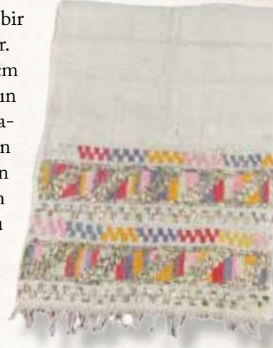
Fotoğraf: 8. 5.1.80 envanter numaralı keten peşkir

Alanın basit sıralı olarak düzenlendiği birinci örnek geometrik motifli peşkir olup, Fotoğraf 9a,b 'de görülmektedir.