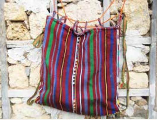
Fotoğraf 6. Düz dasdarla dokunmuş ve birleştirerek çanta haline getirilmiş heybe

zor elde edilir hale gelmiştir. Bu hal, gençlerin geleneksel meslek dalına ilgi duymamasını da yanında getirmiştir. Bugün artık kilim ve halı dokuma tezgâhları neredeyse kullanımdan kalkmış depolarda tozlar arasına terk edilmiştir. Bölgede dokumacılığın daha kolay hali olan dasdar dokuma türü tercih edilmektedir.