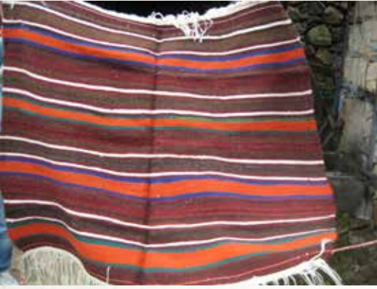
Fotoğraf 5. Kök boya ile elde edilen saf yünden dokunmuş düz dasdar